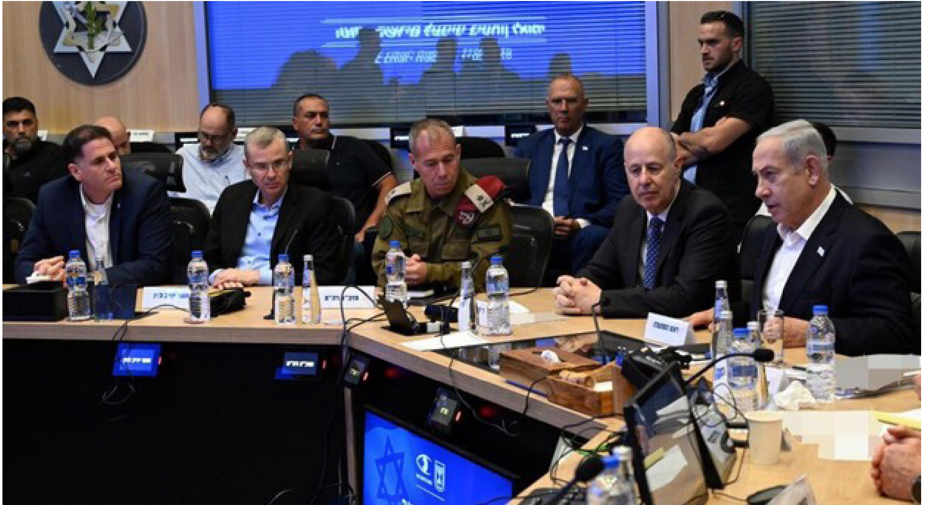
קבינט המלחמה המיוחד, פלוס משקיפים

הטקט של יו"ר האופוזיציה, ח"כ יאיר לפיד, שגם בפתחת כנס החורף טרח לשגר רמזים בענייני הרפורמה המשפטית), העבירה הכנסת בקריאה ראשונה את הצעת החוק שגובשה בהכוונתו של שר הפנים משה ארבל, לדחייתן של הבחירות המקומיות בשלושה חודשים, לתאריך כ' שבט ה'תשפ"ד, 30 בינואר 2024.