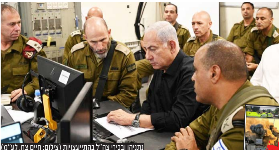
נתניהו ובכירי צה"ל בהתייעצויות

החשש מהפצצת צה"ל בעזה שתפגע בחטופים ובשבויים, הפגישה הטעונה של ראש הממשלה נתניהו עם משפחות הנועדרים, העמדה הלא אחידה של נציגי המשפחות, והראיון שהעניק נשיא המדינה ל-CNN בו הציג את "המדריך ללוחם - גרסת הג'יהאד" שנתפס בנגדי המחבלים