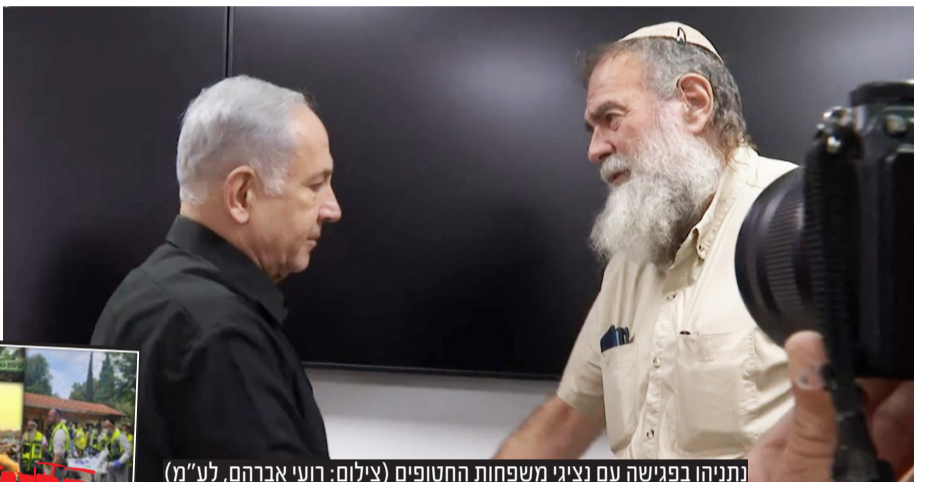
נתניהו בפגישה עם נציגי משפחות החטופים

צפוי להגביר את הלחץ על ההנהגה המדינית בישראל, וקורא לה לנקוט בפעולה נחרצת כדי להבטיח את שחרורם של החטופים מידי האכזריות של חמאס.