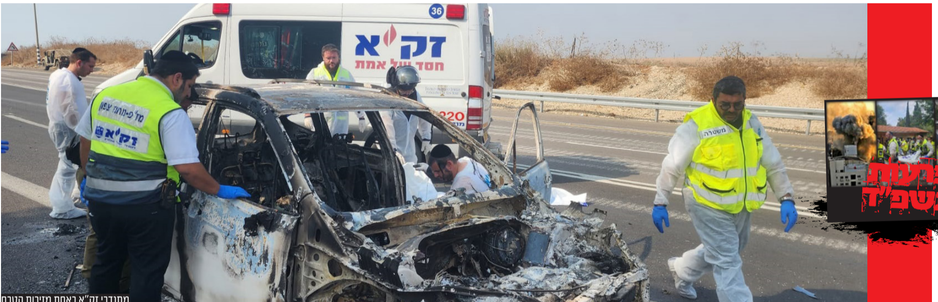
מתנדבי זק"א באחת מזירות הטבח