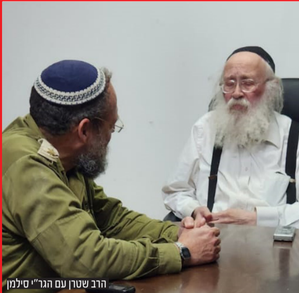
הרב שטון עם הגר"י סילמן

שאלות רבות בענייני ממונות, הובאו לשולחנו של ראב"ד בני ברק הגאון הגדול רבי יהודה סילמן שליט"א בעקבות המלחמה - אנו מביאים כמה מהתשובות שהשיב ויש בהם נפקא מינא לציבור • ומתי בירך הראב"ד "ברוך דיין האמת"