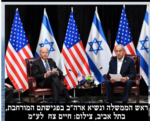
ראש הממשלה ונשיא ארה"ב בפגישתם המורחבת, בתל אביב