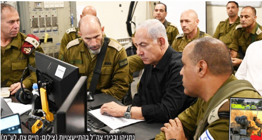
נתניהו ובכירי צה"ל בהתייעצויות

החשש מהפצצת צה"ל בעזה שתפגע בחטופים ובשבויים, הפגישה הטעונה של ראש הממשלה נתניהו עם משפחות הנועדרים, העמדה הלא אחידה של נציגי המשפחות, והראיון שהעניק נשיא המדינה ל-CNN בו הציג את "המדריך ללוחם - גרסת הג'יהאד" שנתפס בנגדי המחבלים