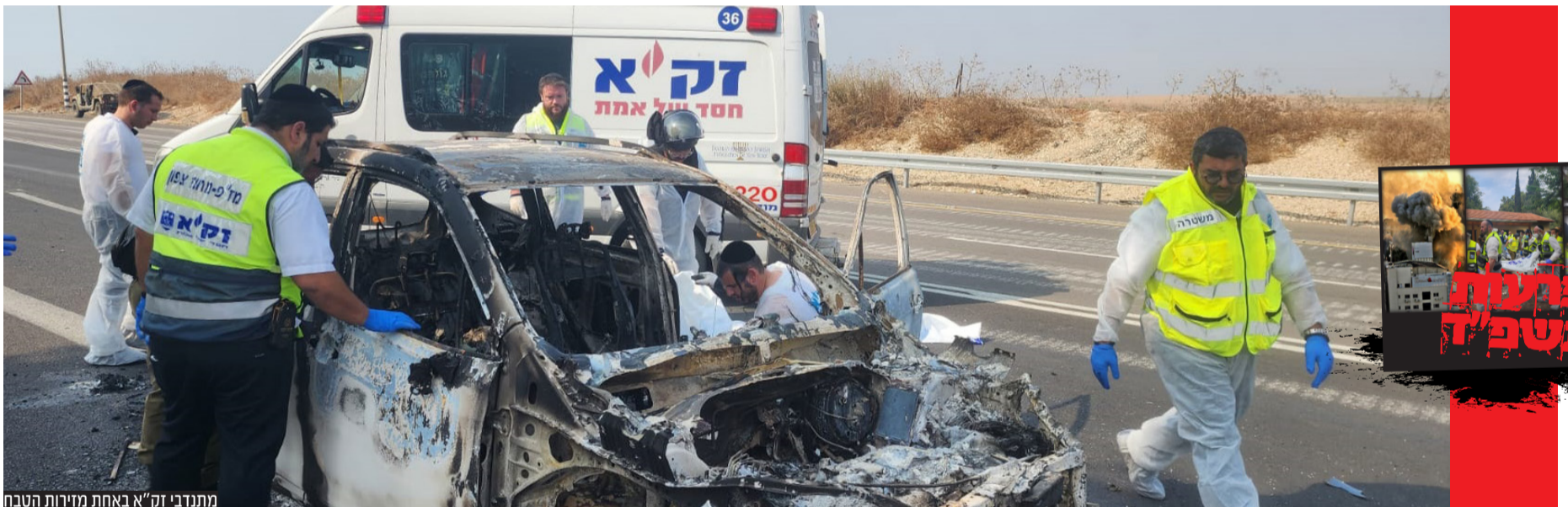
מתנדבי זק"א באחת מזירות הטבח