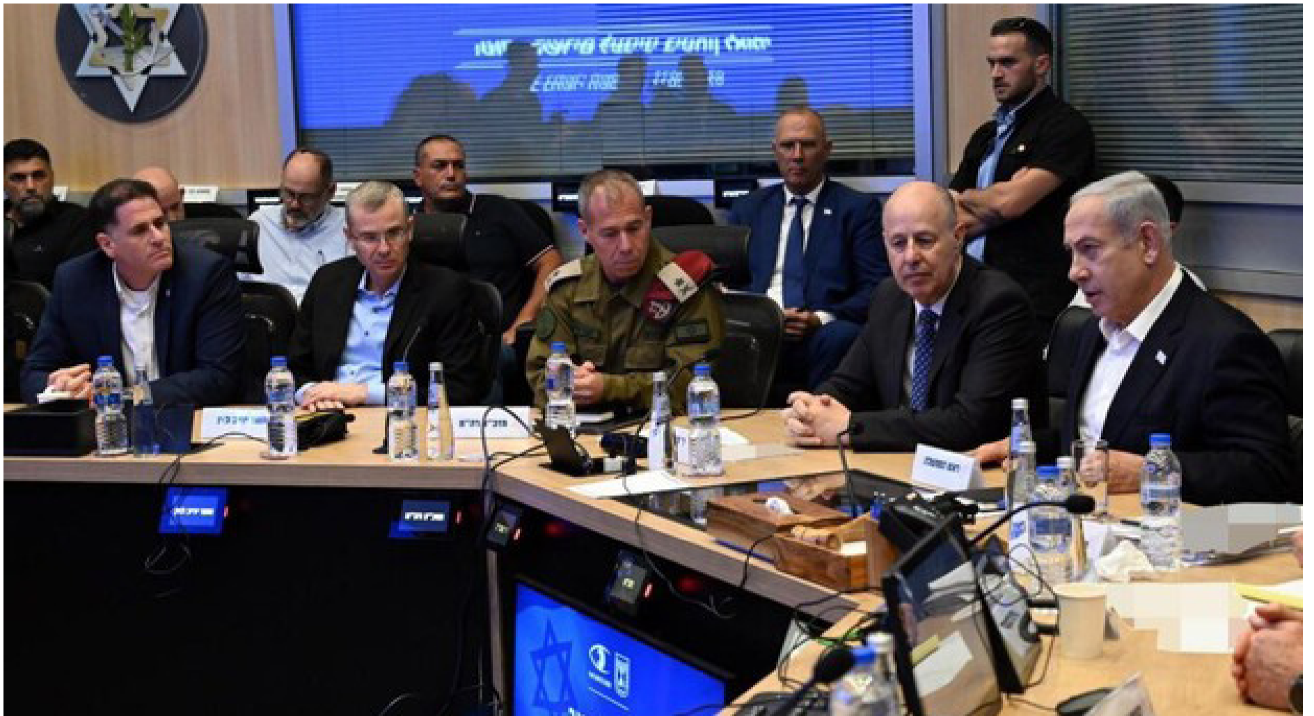
קבינט המלחמה המיוחד, פלוס משקיפים

הטקט של יו"ר האופוזיציה, ח"כ יאיר לפיד, שגם בפתחת כנס החורף טרח לשגר רמזים בענייני הרפורמה המשפטית), העבירה הכנסת בקריאה ראשונה את הצעת החוק שגובשה בהכוונתו של שר הפנים משה ארבל, לדחייתן של הבחירות המקומיות בשלושה חודשים, לתאריך כ' שבט ה'תשפ"ד, 30 בינואר 2024.