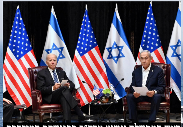
ראש הממשלה ונשיא ארה"ב בפגישתם המורחבת, בתל אביב