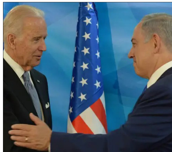
« בדרך לישראל, נשיא ארה"ב ג'ו ביידן »

« נתניהו, אמן ההישרדות הפוליטית, יודע שהוא נקלע בעל כורחו לקרב הגדול ביותר שהיה לו. ואין מדובר רק בהישרדות גרידא, מדובר בשאלת החותם ההיסטורי שיותר אחריו. האם בנו של ההיסטוריון ייזכר לדורות כראש הממשלה בעל תקופת הכהונה הארוכה ביותר, משקם כלכלת ישראל ו'מר ביטחון'? או כזה שאחראי למחדל הגדול ביותר מאז הקמת מדינת ישראל, ולפחות כזה שלא נופל בחומרתו ממחדל יום הכיפורים המפורסם? »