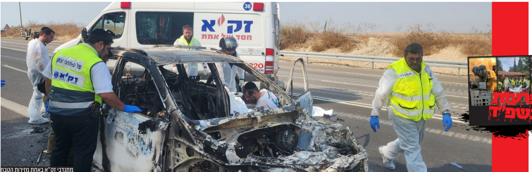
מתנדבי זק"א באחת מזירות הטבח