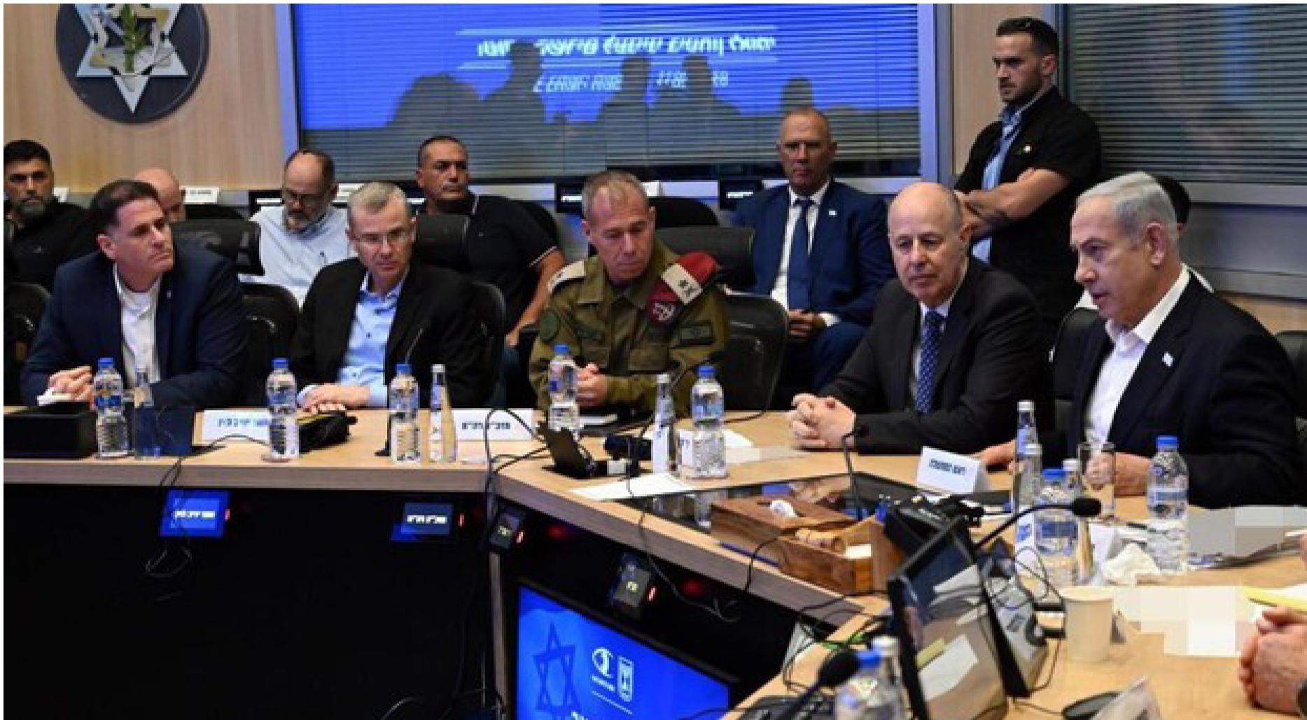
קבינט המלחמה המיוחד, פלוס משקיפים

הטקט של יו"ר האופוזיציה, ח"כ יאיר לפיד, שגם בפתחת כנס החורף טרח לשגר רמזים בענייני הרפורמה המשפטית), העבירה הכנסת בקריאה ראשונה את הצעת החוק שגובשה בהכוונתו של שר הפנים משה ארבל, לדחייתן של הבחירות המקומיות בשלושה חודשים, לתאריך כ' שבט ה'תשפ"ד, 30 בינואר 2024.