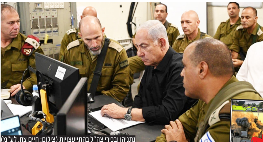
נתניהו ובכירי צה"ל בהתייעצויות

החשש מהפצצת צה"ל בעזה שתפגע בחטופים ובשבויים, הפגישה הטעונה של ראש הממשלה נתניהו עם משפחות הנועדרים, העמדה הלא אחידה של נציגי המשפחות, והראיון שהעניק נשיא המדינה ל-CNN בו הציג את "המדריך ללוחם - גרסת הג'יהאד" שנתפס בנגדי המחבלים