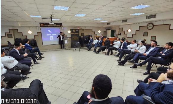
הרבנים ברב שיח

מלאכה קשה שבמקדש, והיא דורשת הצטיידות בכלים חדשים ומעודכנים.