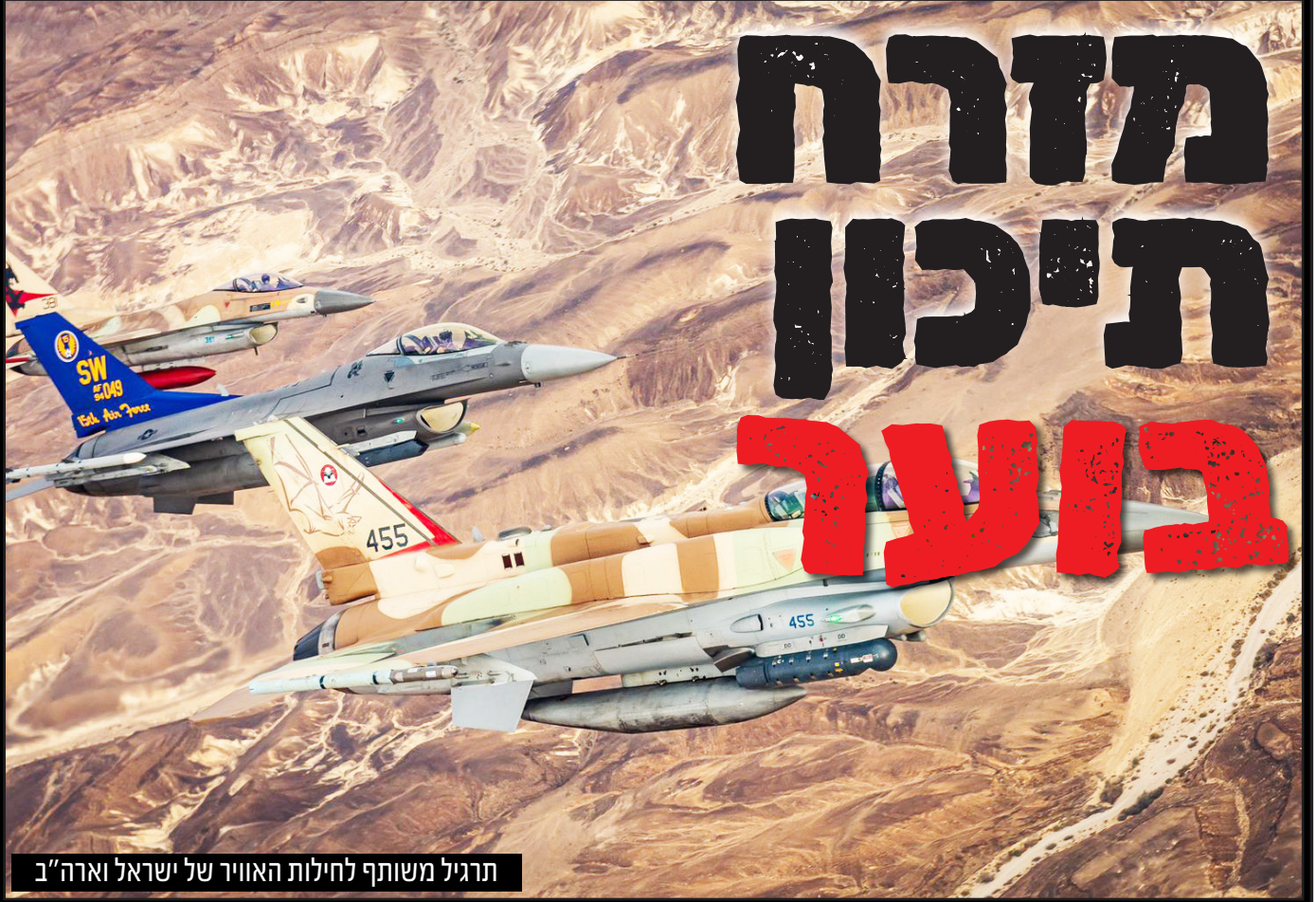
תרגיל משותף לחילות האוויר של ישראל וארה"ב