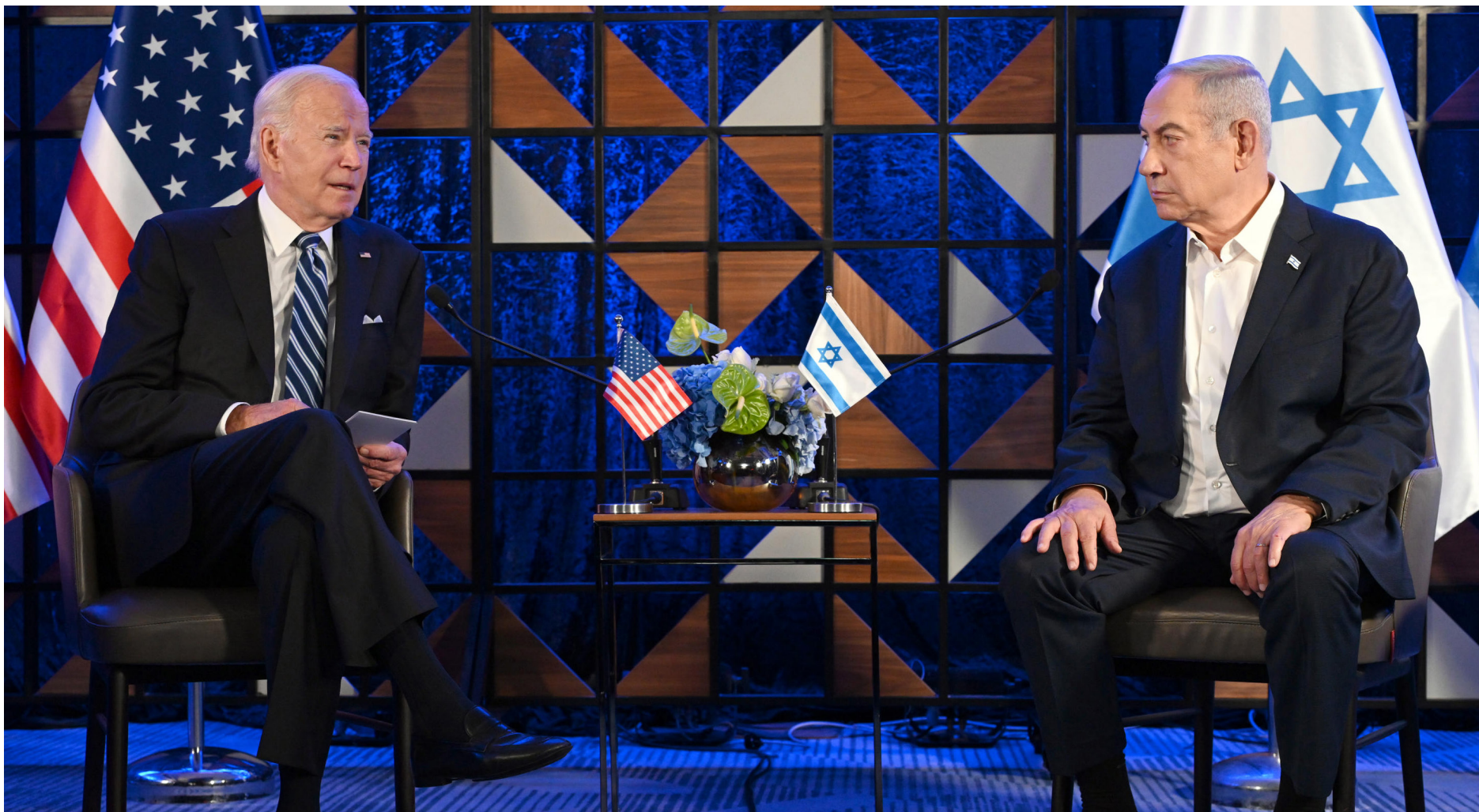
הדילמה האמריקנית. נשיא ארה"ב ג'ו ביידן וראש הממשלה בנימין נתניהו