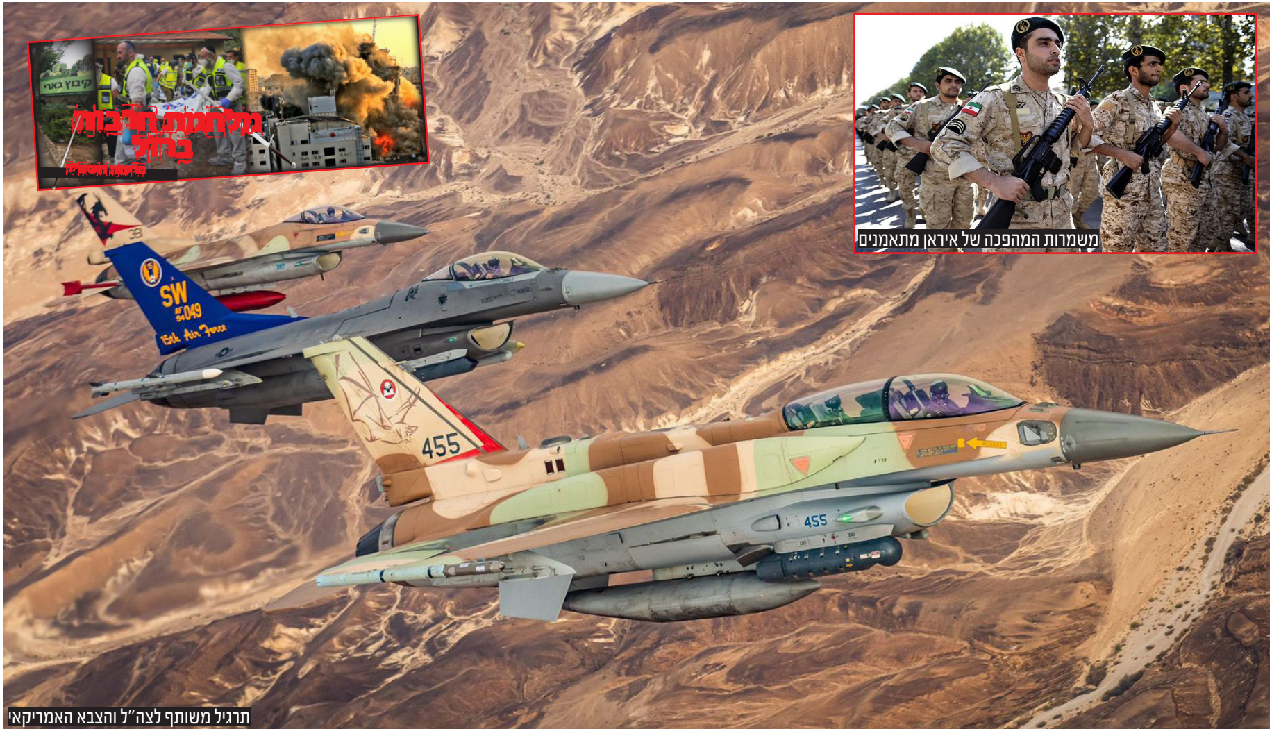
תרגיל משותף לצה"ל והצבא האמריקאי