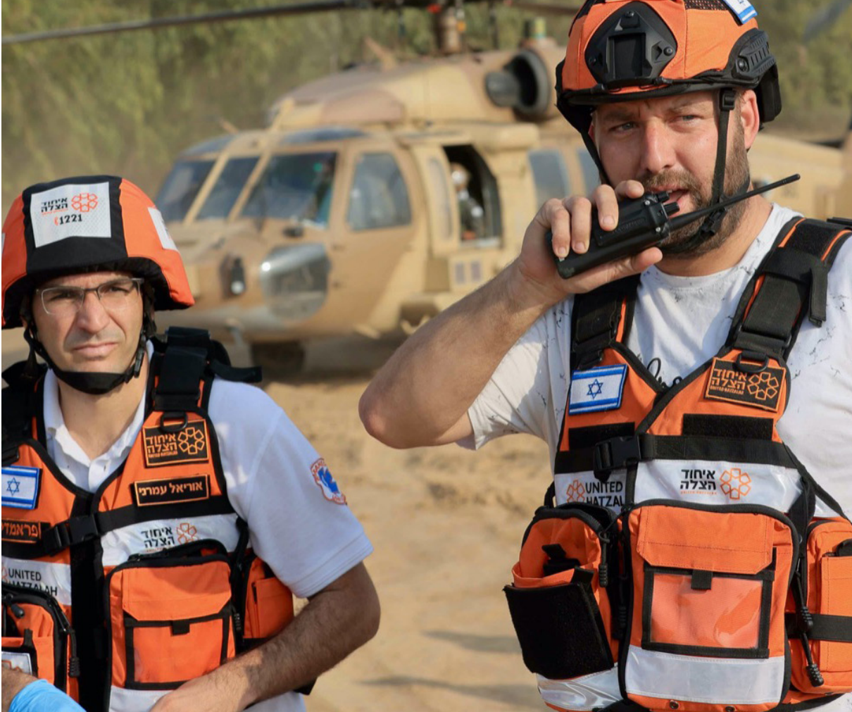
מתנדבי איחוד הצלה מפנים פצועים בזירה