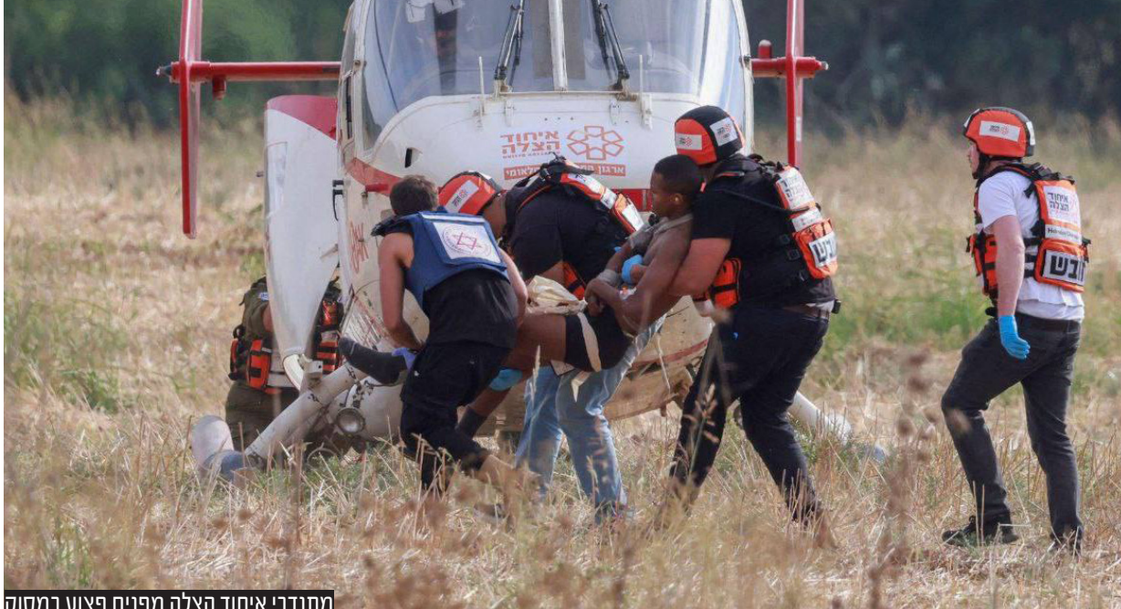
מתנדבי איחוד הצלה מפנים פצוע במסוק