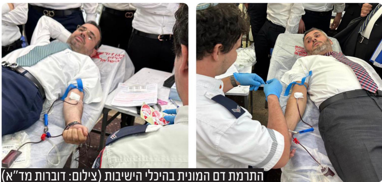
התרמת דם המוניות בהיכלי הישיבות

דם ומרכיביו והצלחת חייהם". השר הרב חיים ביטון: "קשר הדם שלנו כעם יהודי בא לידי ביטוי בהירתמות ובעזרה ההדדית בעתות מצוקה, כמו מיזמים שונים בחברה הישראלית שאנו רואים מאז האסון הנורא, כאשר כל צד דואג לשני. בימים קשים אלו חובה על כל אחד מאתנו להטות שכם". שר הבריאות הרב אוריאל בוסו: "מרגש לראות את מבצע שירותי הדם של מד"א שמקים מוקדים של התרמות דם בכל רחבי הארץ ומעניק לציבור את ההזדמנות לתת ולהיות שותף במאמץ הלאומי. מאז פרוץ המלחמה אנו נחשפים יום יום למיזמי התנדבות ותרומה לקהילה של העם המיוחד שלנו. תרומת דם מהווה חלק בלתי נפרד מעוצמתה של מערכת הבריאות ומסייעת לצוותים הרפואיים להציל חיים".