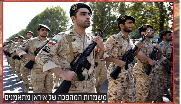
משמרות המהפכה של איראן מתאמנים

ב-22 באוקטובר תקף כלי טיס של צה"ל תשתית טרור תת-קרקעית במסגד אל-אנצרי במחנה הפליטים ג'נין שבו הסתתרה חולייה של 5 מחבלים של חמאס וגא"פ שעמדה להוציא פיגוע. על פי דיווחים פלסטיניים, לפחות 2 נהרגו ועוד 3 נפצעו או נלכדו מתחת להריסות.