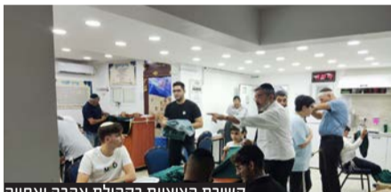
קשירת הציציות בקהילת אהבה ואחוה