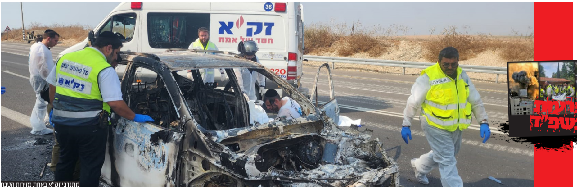
מתנדבי זק"א באחת מזירות הטבח