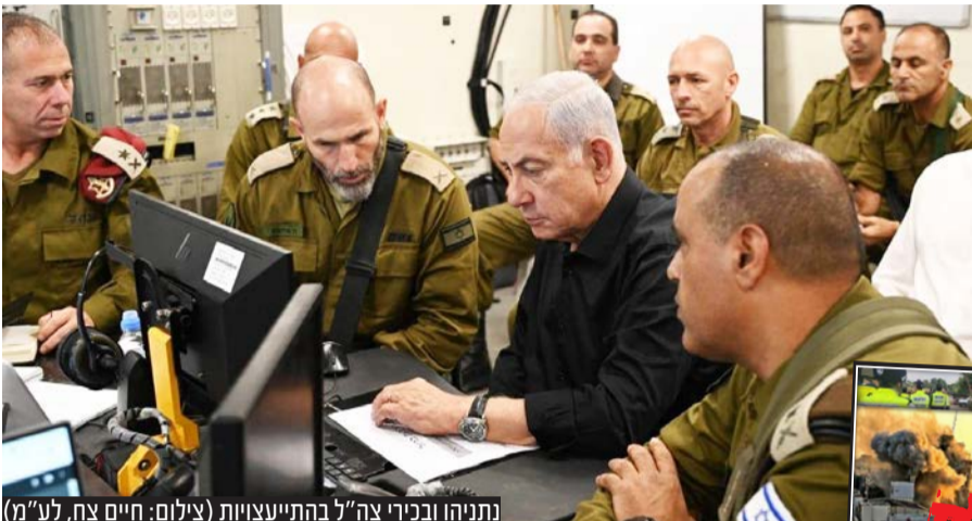
נתניהו ובכירי צה"ל בהתייעצויות

החשש מהפצצת צה"ל בעזה שתפגע בחטופים ובשבויים, הפגישה הטעונה של ראש הממשלה נתניהו עם משפחות הנועדרים, העמדה הלא אחידה של נציגי המשפחות, והראיון שהעניק נשיא המדינה ל-CNN בו הציג את "המדריך ללוחם - גרסת הג'יהאד" שנתפס בנגדי המחבלים