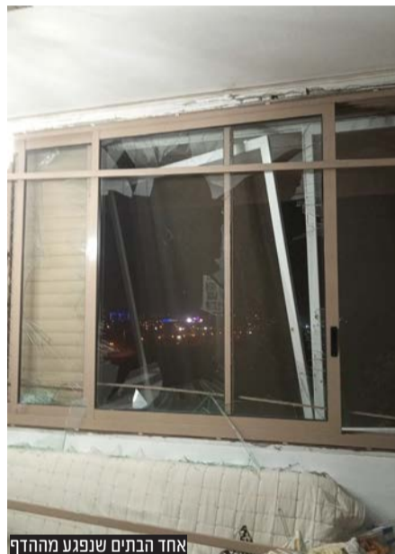
אחד הבתים שנפגע מההדף

בן כלל הפעילויות שהיו בעיר לטובת תושבי העוטף ניתן למנות גם קבוצה של בחורות סמינר שפרסמו על שירות שמרטפות ובאו לשמור על ילדים בתפקיד בייביסיטר