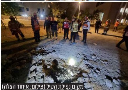
מקום נפילת הטיל