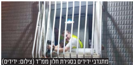
מתנדבי ידדים בסגירת חלון ממ"ד