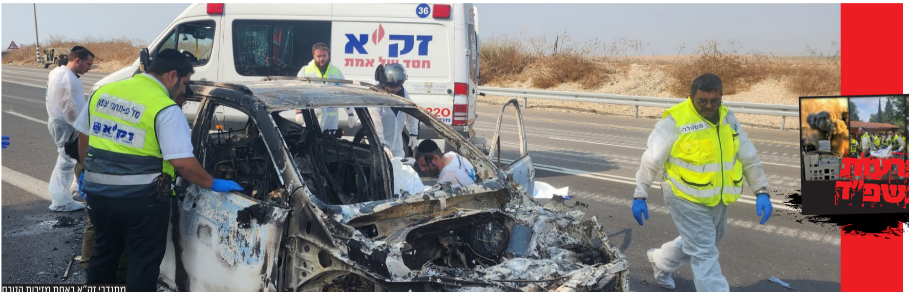
מתנדבי זק"א באחת מזירות הטבח