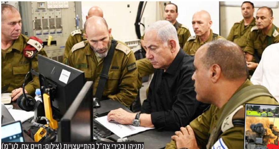
נתניהו ובכירי צה"ל בהתייעצות

החשש מהפצצת צה"ל בעזה שתפגע בחטופים ובשבויים, הפגישה הטעונה של ראש הממשלה נתניהו עם משפחות הנועדרים, העמדה הלא אחידה של נציגי המשפחות, והראיון שהעניק נשיא המדינה ל-CNN בו הציג את "המדריך ללוחם - גרסת הג'יהאד" שנתפס בנגדי המחבלים