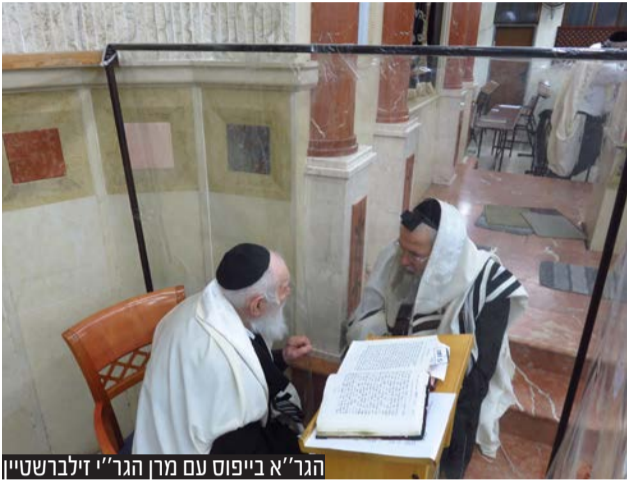
הגר"א בייפוס עם מן הגר"י זילברשטיין

לאחר פניות רבות בעקבות המלחמה, ולאחר היועצות ממושכת אצל הפוסק מן הגר"י זילברשטיין, פיתחו בארגון את האפשרויות להתראות בטחוניות והזעקת כוחות החירום בשבתות ובחגים באמצעות מסכי המידע המוצבים בבתי הכנסת • במקביל פניות רבות נענות ע"י מורי הוראה במוקד הטלפוני לשאלות בנושא התנהלות בשבת בצל המלחמה