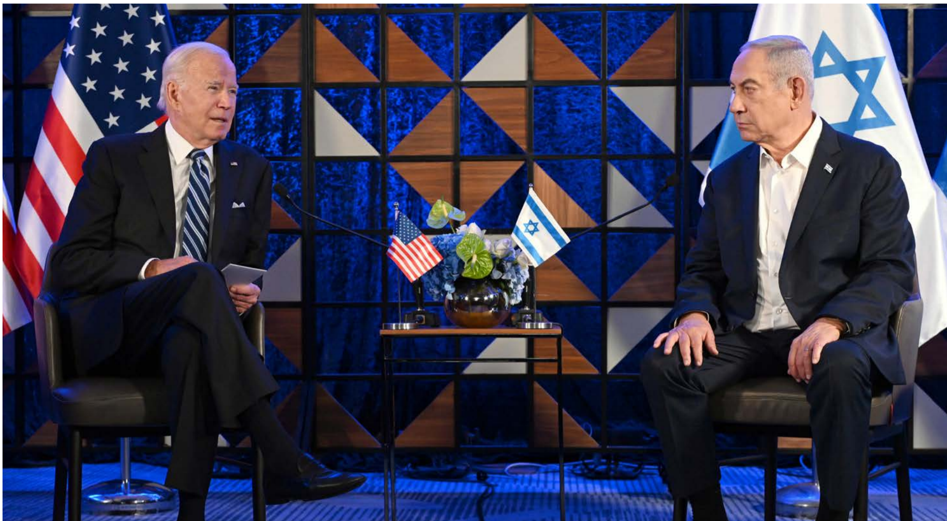
הדילמה האמריקנית. נשיא ארה"ב ג'ו ביידן וראש הממשלה בנימין נתניהו