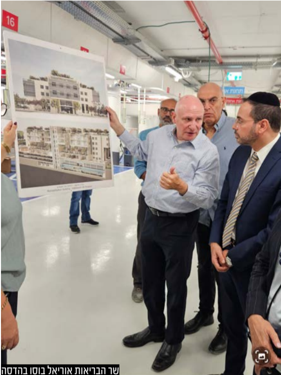
שר הבריאות אוריאל בוסו בהדסה

שר הבריאות, אוריאל בוסו בהדסה הר הצופים: "בשבוע אחד נבנו שני מתחמי ענק תת-קרקעיים בבתי החולים של הדסה"