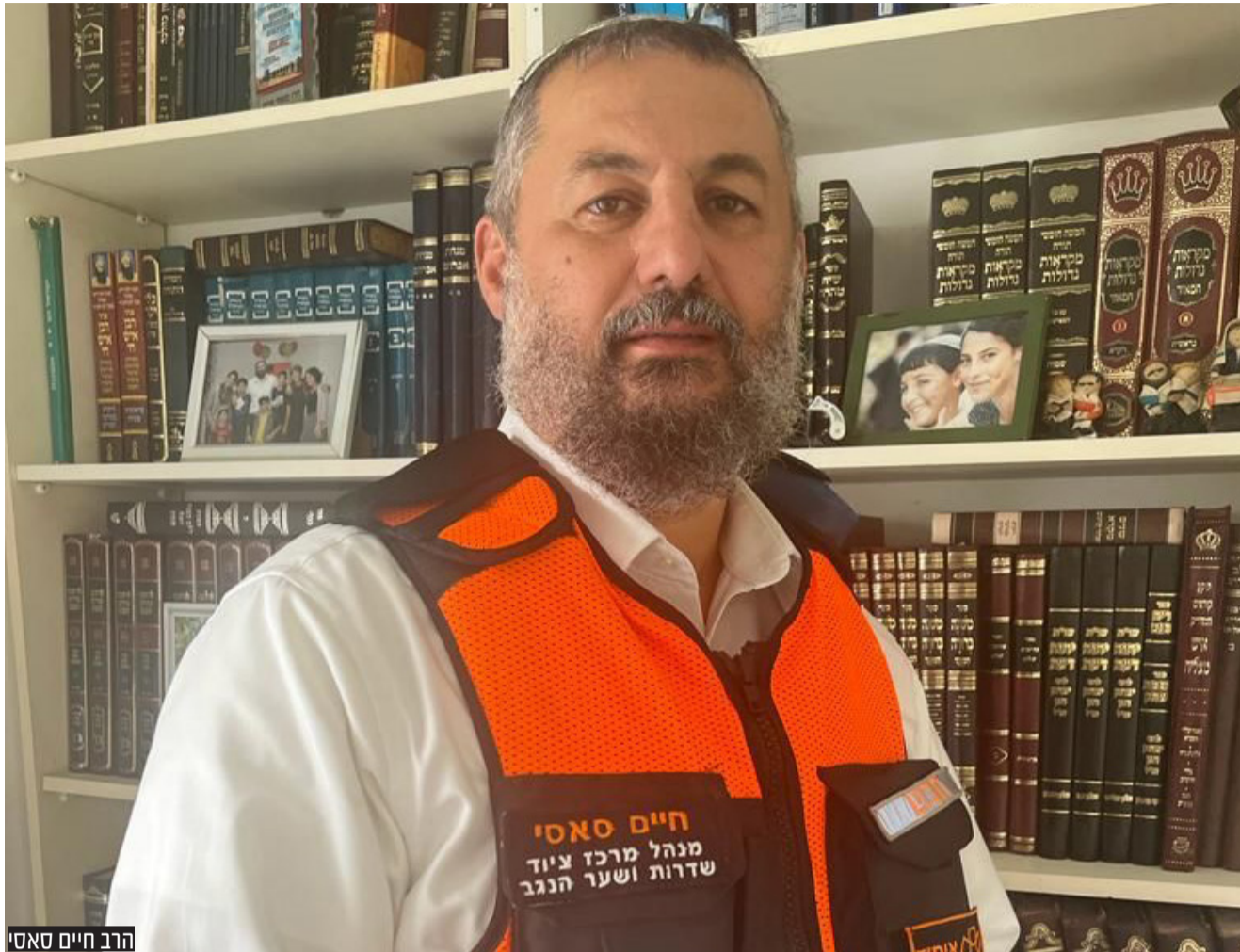
הרב חיים סאסי