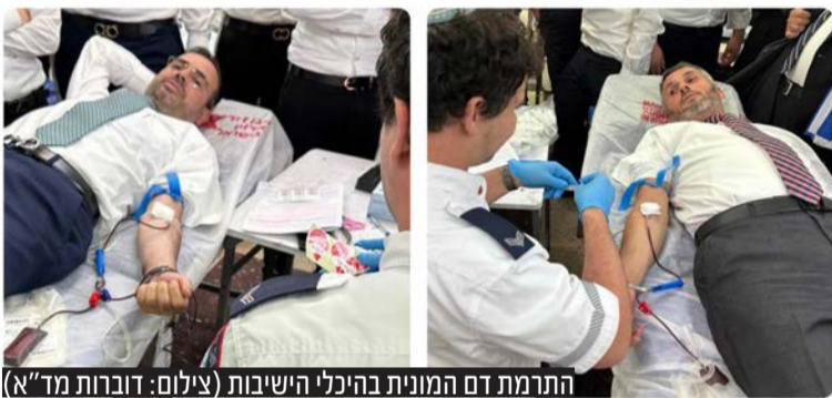
התרמת דם המוניות בהיכלי הישיבות

דם ומרכיביו והצלחת חייהם". השר הרב חיים ביטון: "קשר הדם שלנו כעם יהודי בא לידי ביטוי בהירתמות ובעזרה ההדדית בעתות מצוקה, כמו מיזמים שונים בחברה הישראלית שאנו רואים מאז האסון הנורא, כאשר כל צד דואג לשני. בימים קשים אלו חובה על כל אחד מאתנו להטות שכב". שר הבריאות הרב אוריאל בוסו: "מרגש לראות את מבצע שירותי הדם של מד"א שמקים מוקדים של התרמות דם בכל רחבי הארץ ומעניק לציבור את ההזדמנות לתת ולהיות שותף במאמץ הלאומי. מאז פרוץ המלחמה אנו נחשפים יום יום למיזמי התנדבות ותרומה לקהילה של העם המיוחד שלנו. תרומת דם מהווה חלק בלתי נפרד מעוצמתה של מערכת הבריאות ומסייעת לצוותים הרפואיים להציל חיים".