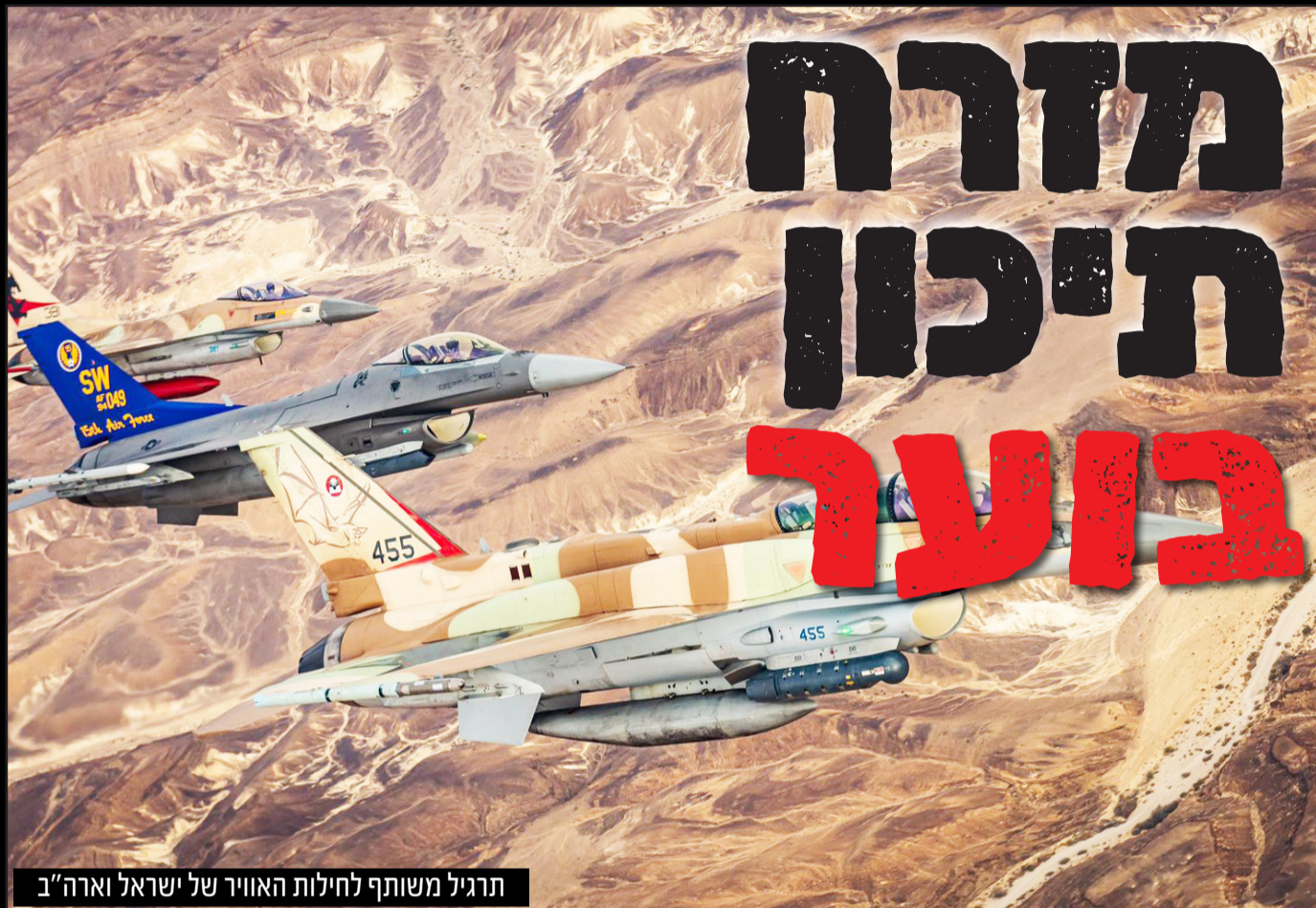
תרגיל משותף לחילות האוויר של ישראל וארה"ב

מתקפת חמאס בשמחת תורה הייתה רק יריית הפתיחה במלחמה הכוללת שהכריזה איראן על ישראל באמצעות ארגוני הפרוקסי הממומנים על ידה • בלבנון, בסוריה, בתימן, ביהודה ושומרון וכמובן באיראן ממתינים להרחבת המערכה שבחלקה זוכה לגיבוי של סין ורוסיה • המזרח התיכון - תמונת מצב | עמ' 12-13