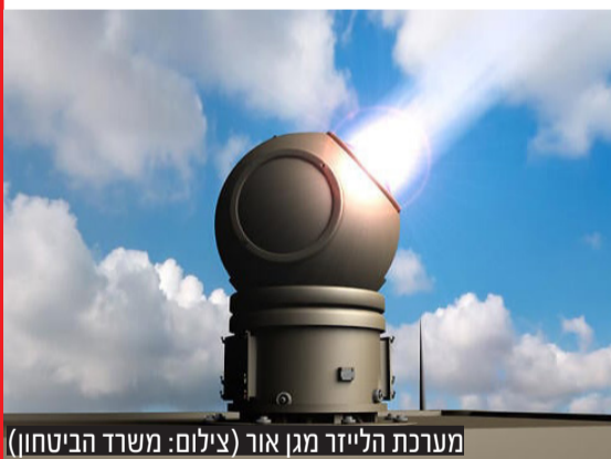
מערכת הלייזר מגן אור

לשימוש מבצעי לטווח הארוך, אך פריצת דרך הושגה כאשר המערכת תכנס כבר בשלב הלחימה הנוכחית לבדיקה מבצעית לפצמ"רים קצרי טווח, רחפנים ועוד. הניסוי המבצעי יכול על פצמ"רים שבמילא ינחתו בשטח פתוח ולא יירוטו על ידי כיפת ברזל ובכל תוכל המערכת לבדוק את יעילות הטכנולוגיה החדשה. עלותו של טיל ירוט של כיפת ברזל עומדת על כחמישים אלף דולר, ועלותו של קרן לייזר, מסתכם בכמה עשרות שקלים בודדים. במידה ותירשם הצלחה למערכת - זו תהיה פריצת דרך משמעותית בכל הקשור להגנה מפני ירי רקטי.