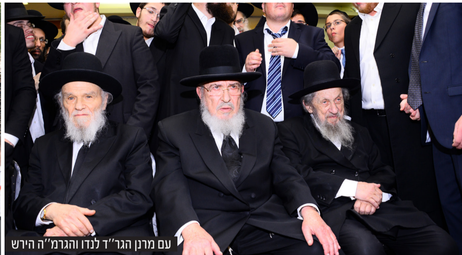
עם מרן הגר"ד לנדו והגרמ"ה הירש

לטובת ישיבת 'עטרת ישראל' נערך בביתו של מרן הגאון רבי עובדיה יוסף זצ"ל.