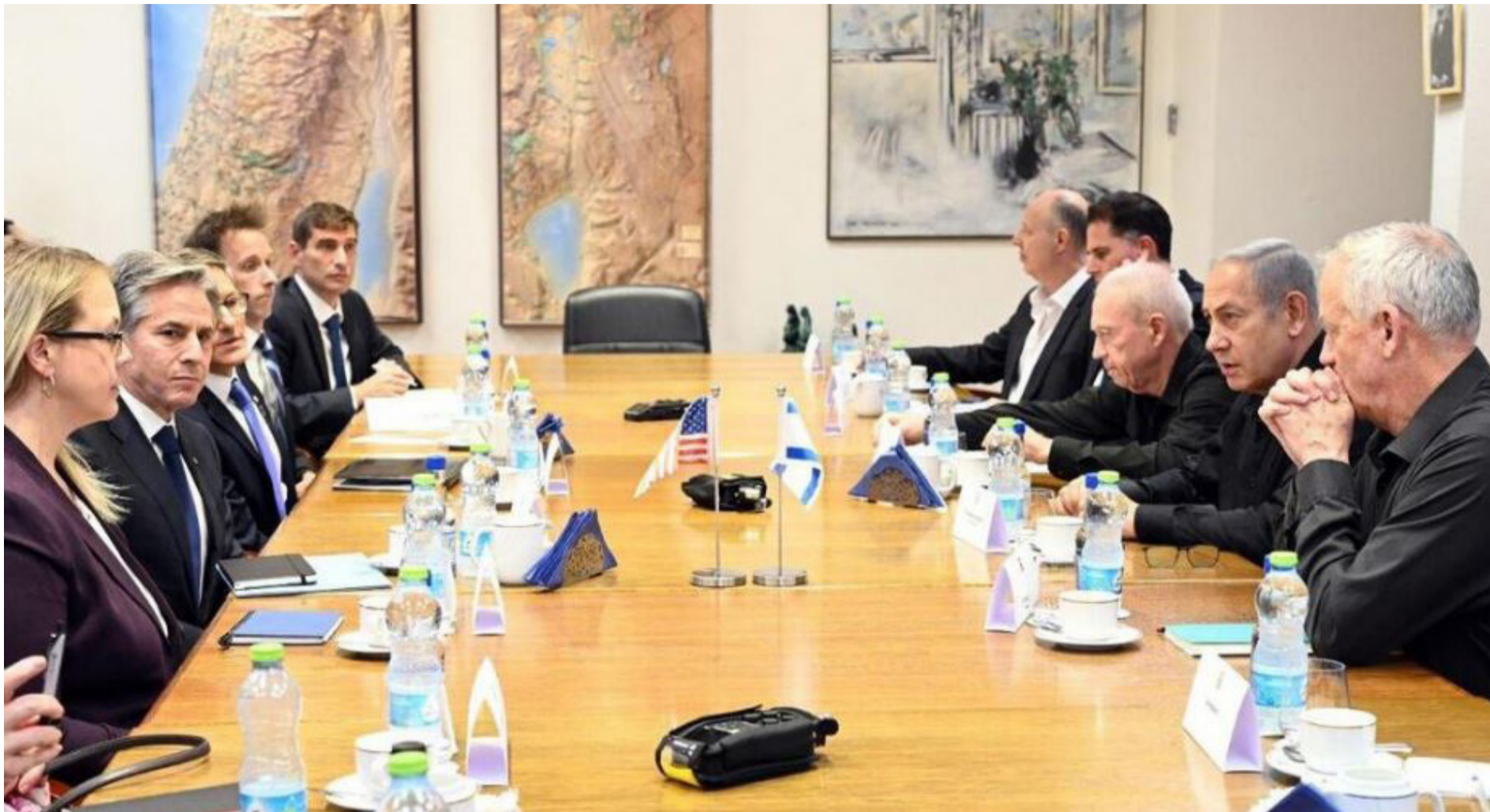
למרות העימותים על הנרטיב, קבינט המלחמה בפעולה

חמאס אינו טיפש, אם ישראל תסכים לשחרר אלפים מאנשיו הוא לא יסתפק בזה וידרוש צעדים נוספים, ובעיקר, ידאג לבצע את העסקה בשלבים איטיים, כאלו שיאפשרו לו להשתקם וגם להביא למסתור את מרבית המשוחררים, הרחק מידו הקטלנית של צה"ל. במצב דברים כזה, יהיה זה רק עניין של זמן חלילה עד שנשלם מחיר כבד על החלטה פזיזה