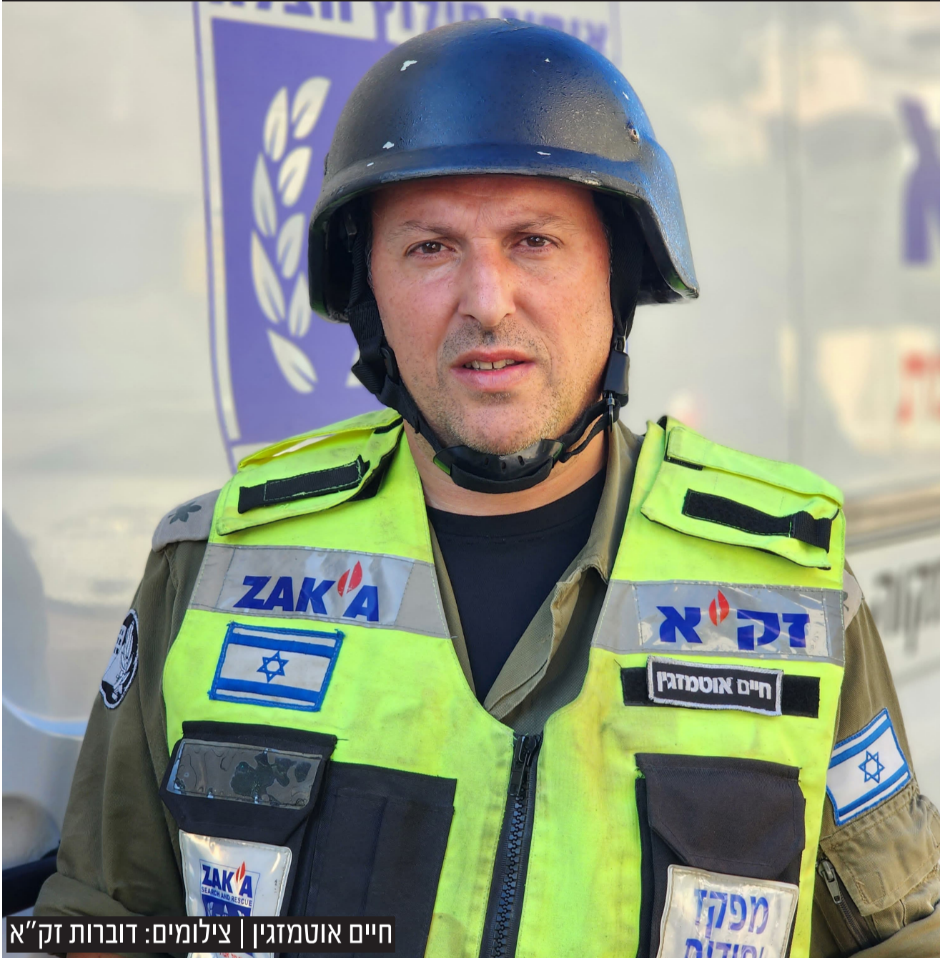
חיים אוטמזגין | צילומים: דוברות זק"א