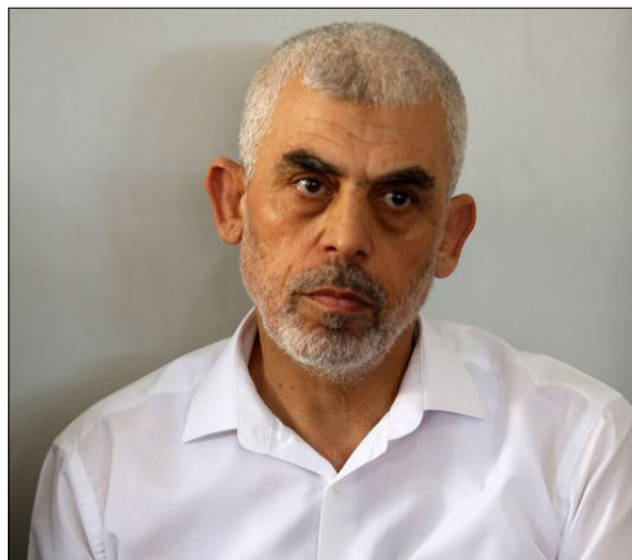
« ראש הנחש ומשוחרר עסקת שליט, יחיא סנוואר

מה שיקבע את עוצמת הדיכויים של הועדה ביחס לדרג המדיני, מלבד העובדות עצמן, כמובן, הוא הלחץ הציבורי לסמן אשמים והנרטיב שיתקבע בתודעה הציבורית עד להקמתה. אולי לכן מיהר נתניהו בתחילת השבוע, אחרי מסיבת העיתונאים הראשונה שערך מאז פרוץ המלחמה, לציין הכחשה גורפת לפרסום תקשורת ולפיו הוא קיבל התראה מוקדמת מגופי המודיעין. נתניהו, איש המילה הכתובה, לא הסתפק בהכחשה 'טכנית' של הפרסום, וטרח לכתוב ברחל בתך הקטנה את שמותיהם של אלו שלא העבירו לו את המידע, קרי, ראש אמ"ן וראש השב"כ. במילים אחרות, הקרב על צריבת התודעה יצא לדרך