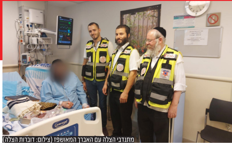
מתנדבי הצלה עם האברך המאושפז

סגירת מעגל מרגשת בין מתנדבי הצלה עם מי שקיבל את חייו במתנה אודות למאמצי החייאה ממושכים • "אתם הייתם מלאכי ההצלה שהשיבו אותי לחיים" הודה בדמעות האברך הניצול • מנכ"ל הצלה הרב יעקב יוזעף: "כל אירוע כזה נותן לנו את הכוחות להמשיך הלאה במלאכת הצלת חיים"