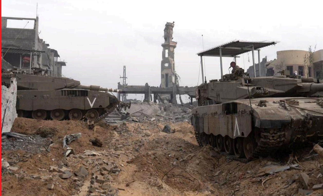
כוחות צה"ל ברצועת עזה