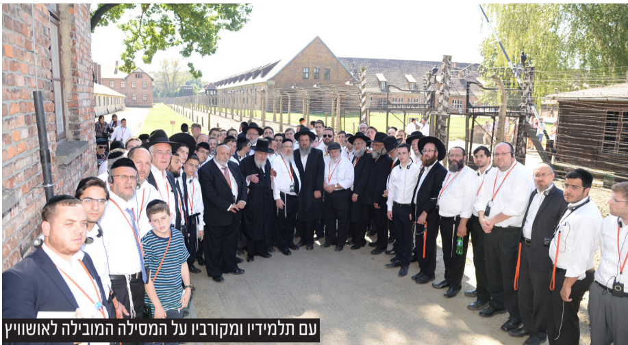
עם תלמידיו ומקורביו על המסילה המובילה לאושוויץ