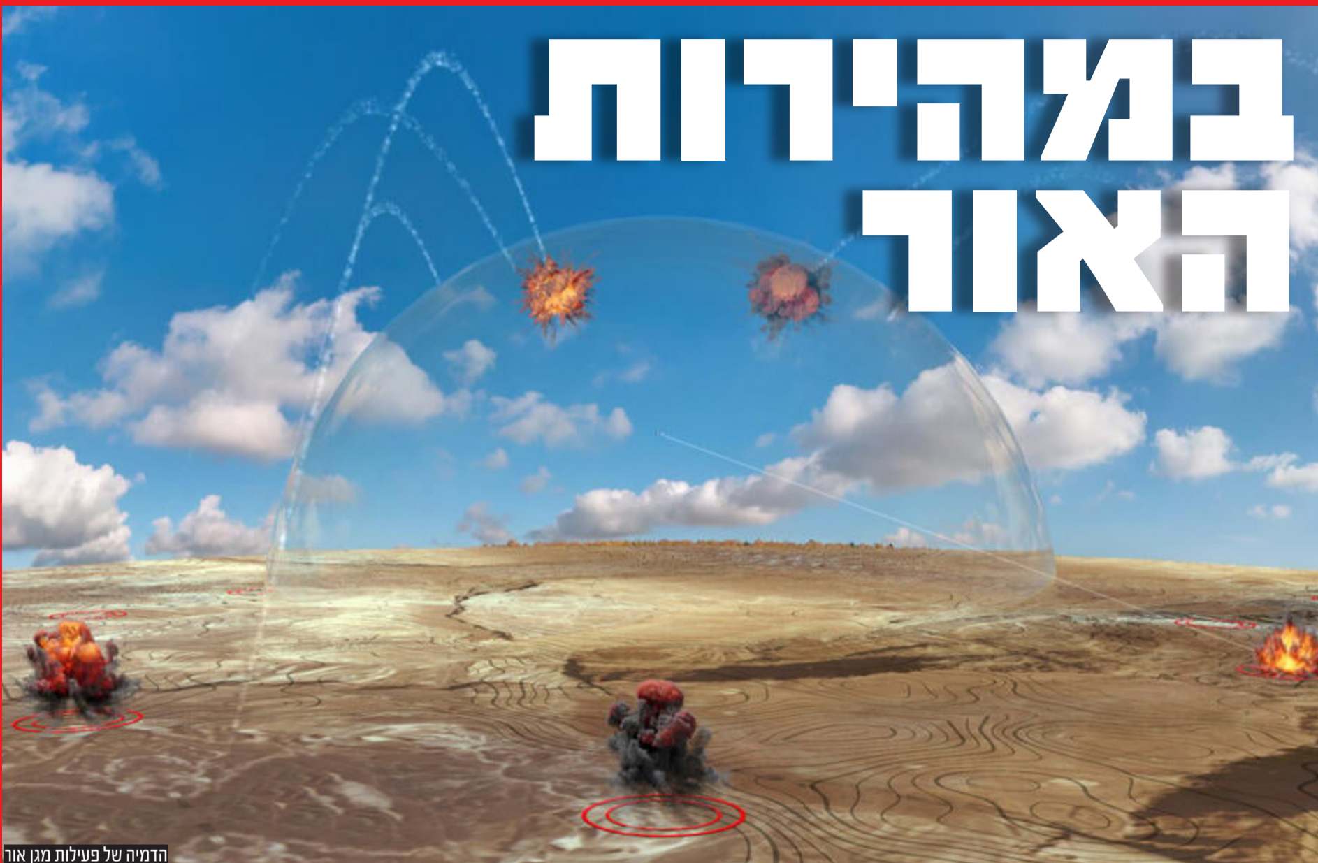
הדמיה של פעילות מגן אור