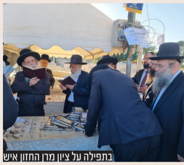
בתפילה על ציון מון החזו"א

ביום שני י"ד חשוון חל יומא דהילולא של מון החזו"א זיע"א. כידוע היה מנהגו של מון שר התורה הגר"ח זצוק"ל אחיינו ותלמידו של מון החזו"א זלה"ה למסור שיעור לאחר תפילת שחרית במעונו הקדוש שברחוב רשב"ם 23 ולאחר מכן היה עולה לבית החיים לציון הקדוש. גם השנה המשיך הנהוג במעון הקדוש שברחוב רשב"ם, ומיד לאחר תפילת ותקין המתקיימת תדיר בבית מון שר התורה זצוק"ל, מסר בנו ממשיך דרכו יבדלח"א מון הגרי"ש קניבסקי שליט"א שיעור בעניין כתיבת פסוקים מן התורה ונ"ד, וקריאה בהם, ובגדר איסור כתיבת פרשיות. לאחר השיעור פקד מון הגרי"ש שליט"א, את הציון בבית החיים 'שומרי שבת' - זכרון מאיר, יחד עם מתפללי המניין הקבוע. לאחמ"כ, במשך כל היום עלו רבים אל בית מון שליט"א לבקשת עצה וברכה.