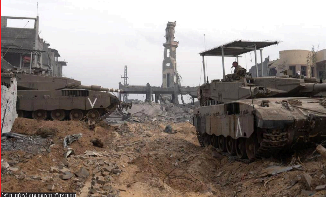
מחנות צה"ל ברצועת עזה