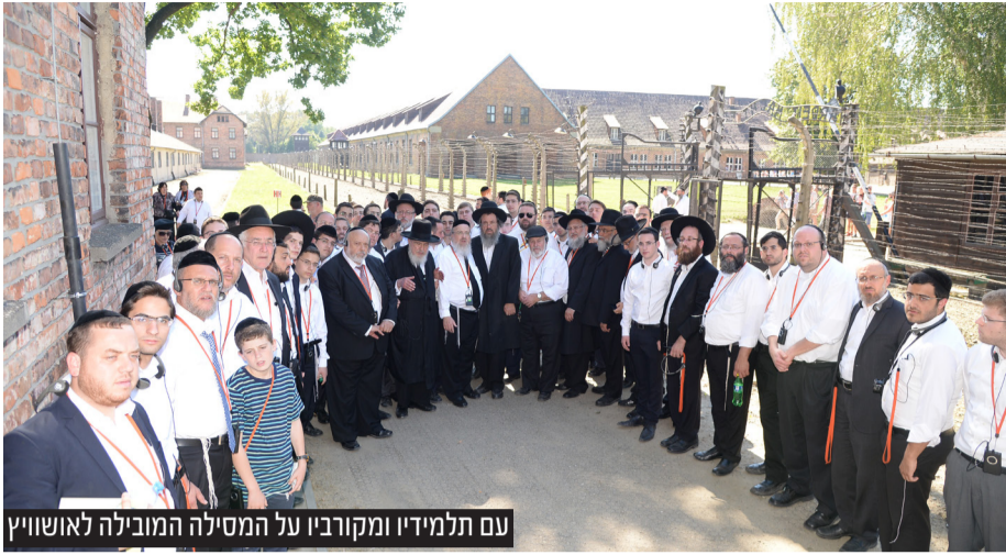
עם תלמידיו ומקורביו על המסילה המובילה לאושויץ