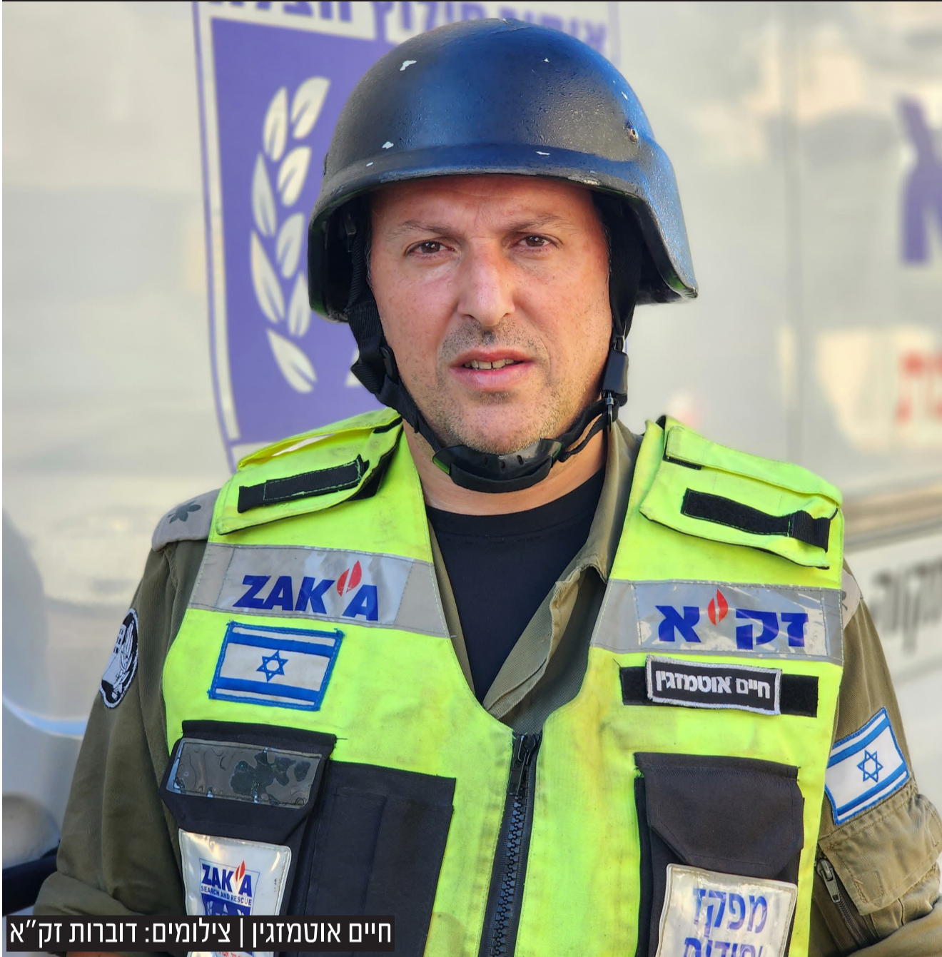
חיים אוטמזגין