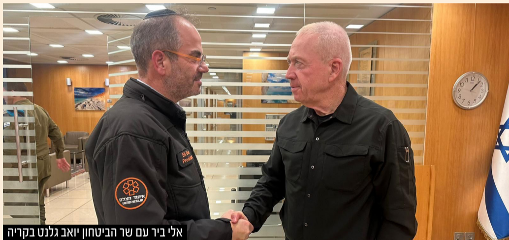
אלי ביר עם שר הביטחון יואב גלנט בקריה

נשיא ומייסד איחוד הצלה אלי ביר נפגש עם שר הביטחון יואב גלנט בלשכתו שבקריה בתל אביב ששיבח את פעילות המתנדבים: "הצלתם חיי אדם תחת אש המרצחים וזה לא מובן מאליו, אנחנו מעריכים את זה מאוד"