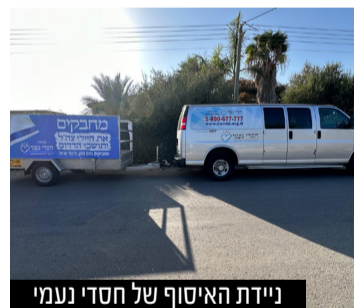
ניידת האיסוף של חסדי נעמי

משפחות המפונים מקבלות תמיכה על בסיס יומי • ניידת חדשה הופעלה כדי לתת מענה מוגבר