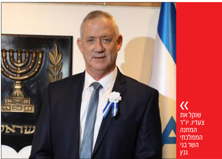
« שוקל את צעדיו. יו"ר המחנה הממלכתי השר בני גנץ

« הנחה הסבירה שבשלב זה, גנץ לא יפרוש מהממשלה, המבחן הבא והמוחשי יותר יתקיים בעוד כשבועיים, כאשר התקציב יגיע לאישור הכנסת. בנוהג המקובל, שר המצביע בכנסת נגד הממשלה, מתפטר מתפקידו. גנץ יצטרך לקבל עד אז את ההחלטה, ולא מן הנמנע שזו תושפע ממצב המלחמה: אם הקרבות העזים בעזה יתחדשו, נראה אותו תומך בתקציב בליט ברירה או נעלם מהזירה בקיזוז לעת מצוא. אם ההפוגה תימשך וישראל תיגרר להפסקת אש כפויה, הוא עשוי לנצל את ההזדמנות ולשבור את הכלים, בניסיון לבצע אקזיט ציבורי מהיר על גילוי האחריות הממלכתית