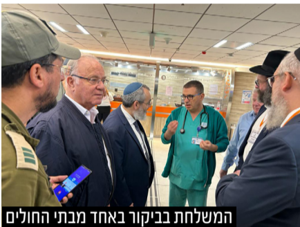
המשלחת בביקור באחד מבתי החולים

משלחת של רבנים מגרמניה ואוסטריה ובהם חברי הועדה המתמדת של 'ועידת רבני אירופה' סיימה בסוף השבוע ביקור הזדהות בישראל במהלכו סיירו ביישובי עוטף עזה, בשדרות ואופקים, ביקרו פצועים בבתי חולים ועמדו מקרוב אחר פעילות חסד של אמת במחנה שורה. הרבנים שוחחו עם מפונים בבתי מלון. קיימו מפגשים עם חיילים בבסיסי צה"ל ונפגשו עם משפחות החטופים - "אנחנו שבים לקהילותינו וחשים בעומק לבבנו והבנתנו שזו העת לאחדות, זו העת לחזק את תושבי ישראל, לתרום ולעשות הכל למען חיזוק החיים והאחדות"