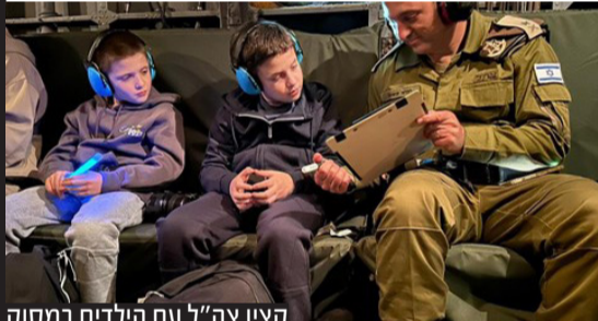
קצין צה"ל עם הילדים במסוק