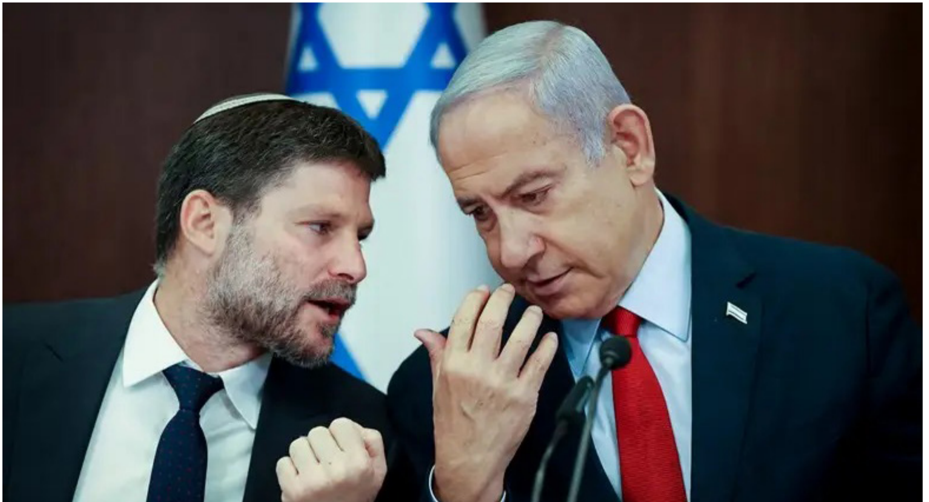
לא התרגשו מאימי המחנה הממלכתי. ראש הממשלה ושר האוצר

של השרה למשימות לאומיות אורית סטרוק. "עם עוד קצת מאמץ ורצון טוב היינו יכולים להגיע להבנות", מבכה אחד הנציגים החרדיים. "אבל ככה זה כשכולם מריחים את הסקרים ואת היום שאחרי", הוא מסכם.