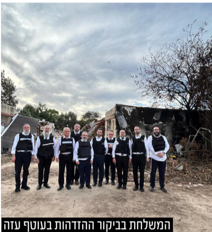
המשלחת בביקור ההזדהות בעוטף עזה

חזקים ואיתנים מול האנטישמיות הצומחת. תפילותינו להחלמת הפצועים, לשחרור החטופים להצלחת החיילים והשוטרים, ולזיכרון הנופלים והנרצחים.