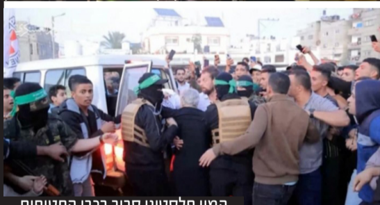
המון פלסטיני סביב רכבי החטופים