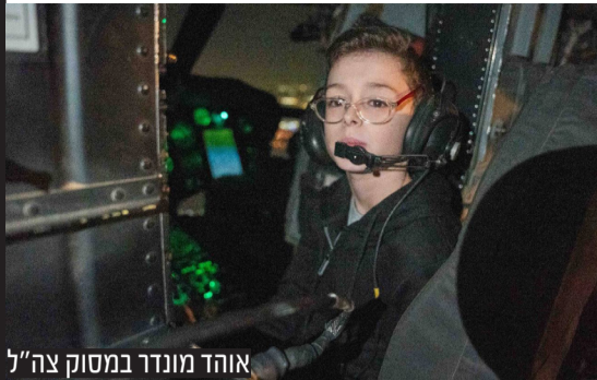
אוהד מונדר במסוק צה"ל

לסיכום, עסקאות חילופי שבויים, במיוחד אלו הכרוכות בשחרור מחבלים מרשעים, מעלות דילמה אתית ואסטרטגית משמעותית. יש לשקול את הפוטנציאל ליתרונות מידיים, כגון החזרתם הבטוחה של חיילים שבויים, אל מול ההשלכות האפשריות לטווח הארוך, לרבות הפוטנציאל לעודד חטיפות נוספות, הסיכון שמחבלים משוחררים יחזרו לפעילותם הצבאית והפוטנציאל לפגיעה במערכת המשפט. זוהי סוגיה מורכבת שאין לה פתרונות קלים, הדורשת שיקול דעת זהיר ומדויק.