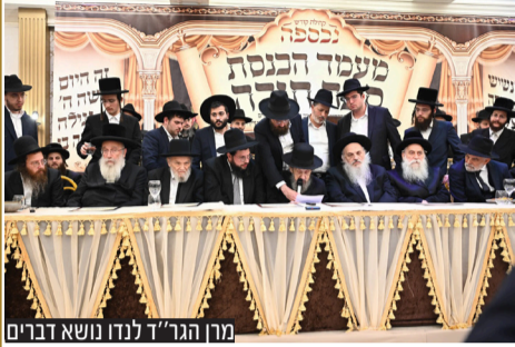
מרן הגר"ד לנדו נושא דברים