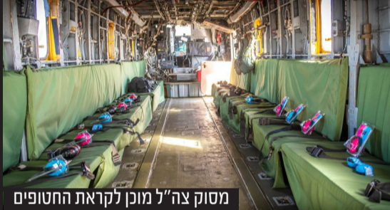
מסוק צה"ל מוכן לקראת החטופים