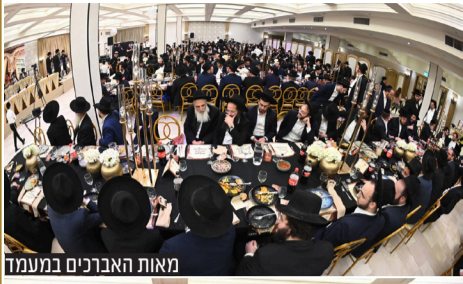
מאות האברכים במעמד