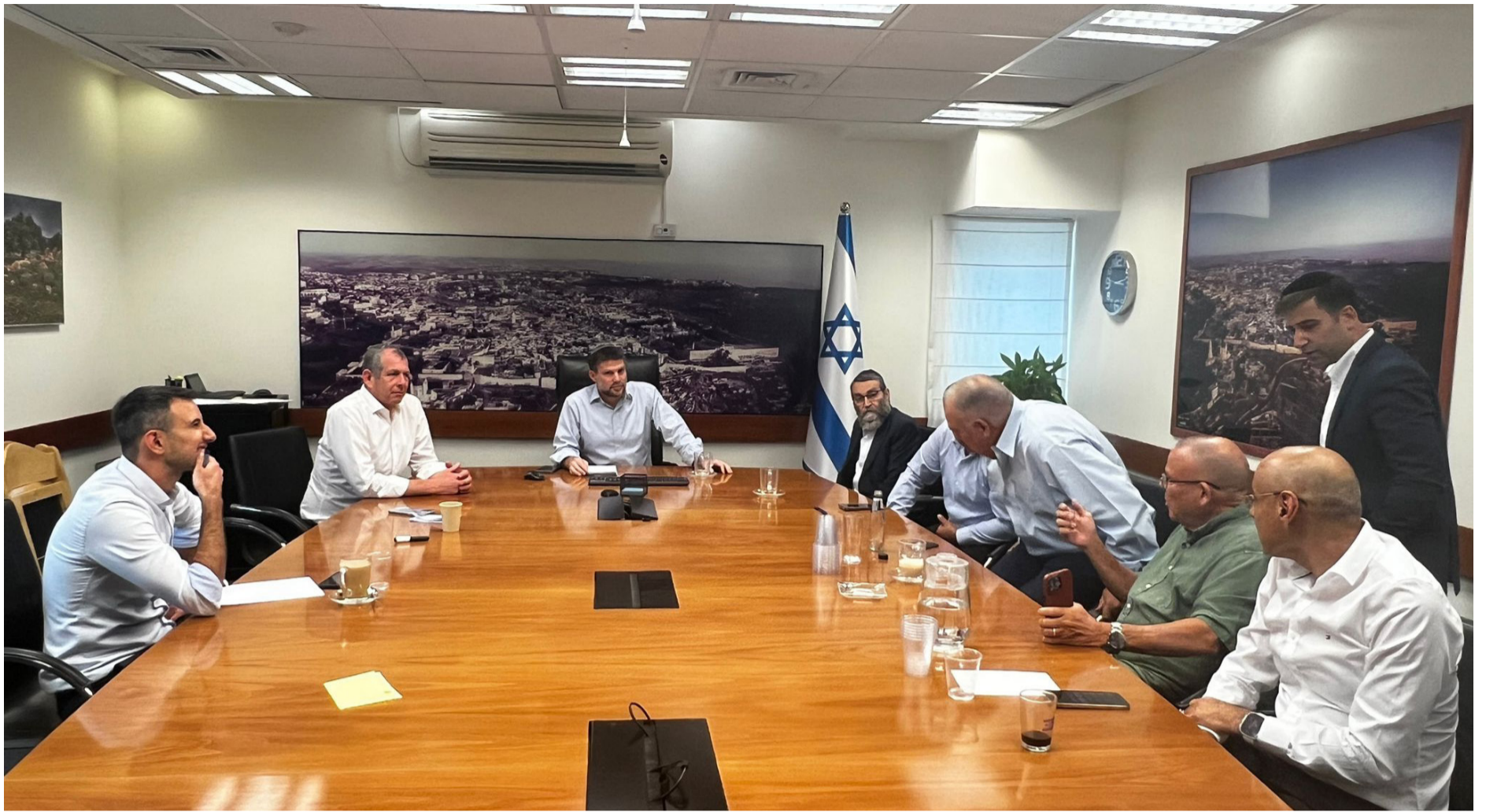
מחפשים פיתרון. ישיבה לילית במשרד האוצר, בהשתתפות השר, המנכ"ל, בכירי אגף תקציבים ויו"ר ועדת הכספים

הפרשנות הנכונה מבדילה וקובעת כי דווקא לגבי ילד ונכד של יהודי מודגש כי זכותם אינה מותנית בחייו של האב או הסב, אך הדברים אינם מתייחסים לבני הזוג, הרחוקים שלב נוסף.