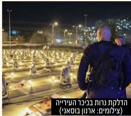
הדלקת נרות בכיכר העירייה

את המעילים במלונות המתארחים בעיר. עיריית ירושלים והיכל התרבות לאומניות מזמינים את תושבי הדרום והצפון השוהים בבירה להפוגת יצירה ושירה ברוח התקופה. האולפן נבנה ואוהר בהשקעה של 600,000 שקלים, והוא משרת את כל תושבי ירושלים והסביבה. היכל התרבות ירושלים מזמין את תושבי הדרום והצפון להפוגה באולפן החדש, להקלטות ולחזרות, וליצירת יצירות חדשות ושירה ברוח התקופה.