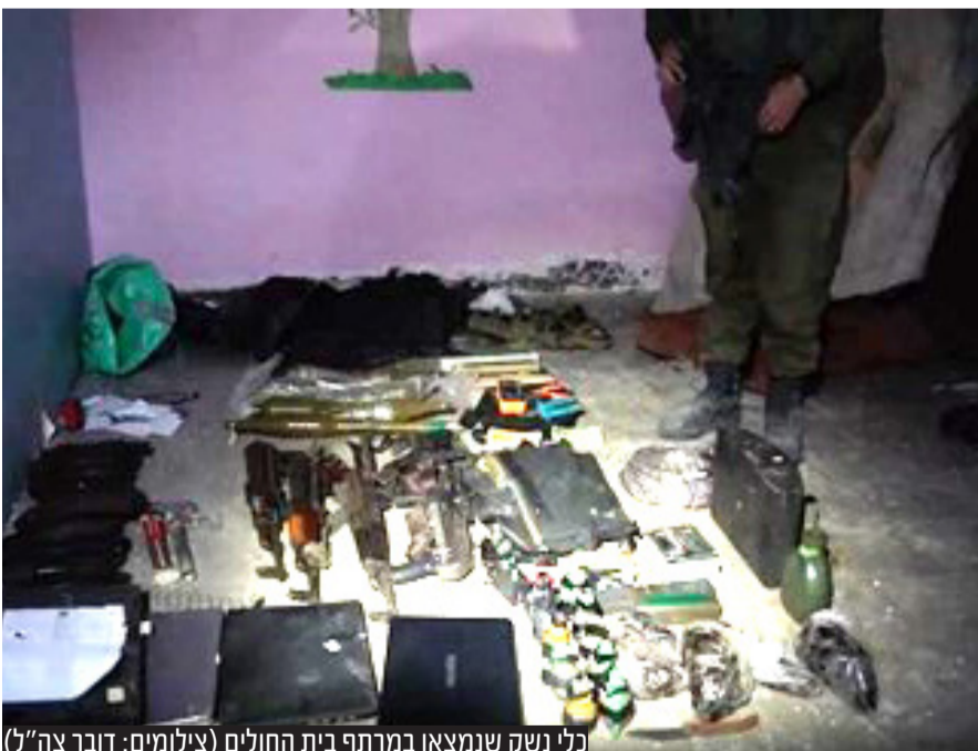
כלי נשק שנמצאו במרתף בית החולים

במקום התגלתה מנהרה בעומק 20 מטר. רובוט שנכנס לפיר גילה דלת, והחיילים נכנסו דרכה למנהרה. באחד החדרים נמצא