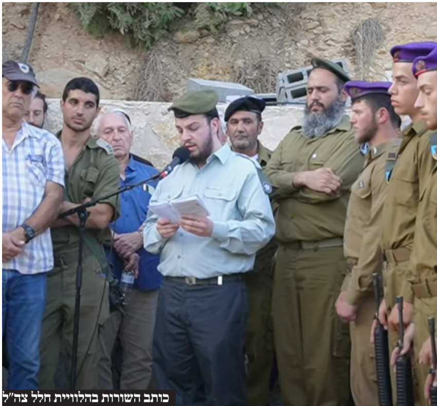
כותב השורות בהלוויית הלל צה"ל

סיפק השבוע 300 ליטר סולר לבית החולים שיפא ברצועת עזה, אך חמאס מנע ממנו לקבל את הדלק. במשימה שכרוכה הייתה בסיכון לחיי הלוחמים, כוח צבאי הגיע סמוך לבית החולים שמשמש כמפקדת הטרור המרכזית, והניח 300 ליטר שנועד כביכול למטרות רפואיות דחופות, אלא שברור לכל בר דעת כי חמאס לא יוותר בקלות על השלל הזה.