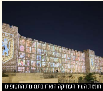
חומות העיר העתיקה הוארו בתמונות החטופים

בכדי להקל ולסייע למשפחות המיוחדות בעיר בתקופת המלחמה, עיריית ירושלים ואגף חברה חילקו כ-2,000 ערכות הפוגה לילדי ומשפחות צמיד ברחבי העיר ירושלים למשפחות ולהוסטלים. היוזמה המרגשת יצאה לדרך בהובלת מחלקת צמיד ובשיתוף הקרן לירושלים.