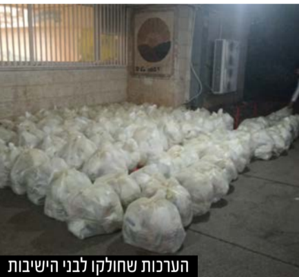
הערכות שחולקו לבני הישיבות

ערכות חיזוק ל-3,000 תלמידי הישיבות וסידור מקומות לימוד זמניים לישיבות ובחורי הישיבות שנאלצו לעזוב את מקום לימודם • סגן ומ"מ ראש עיריית ירושלים הרב צביקה כהן: "לומדי התורה הם ההגנה הרוחנית של כלל ישראל"