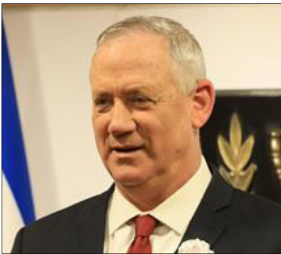
נפל למלכות. יו"ר המחנה הממלכתי השר בני גנץ

כמו שמסביר לנו גורם ביהדות התורה, "שוחחתי עם בכיר באוצר, שאלתי אותו מתוקף איזה חוק הם יכולים לעכב כסף כזה? הוא השיב לי בשאלה: מכוח איזה חוק המדינה יכולה להרוס עם D9 פיצרייה בחווארה? (אותה פיצרייה שזלזלה בכבודה של אחת החטופות ונהרסה בפקודת אלוף פיקוד מרכז. א.ג.) או בתמצית, במלחמה אין חוקים"