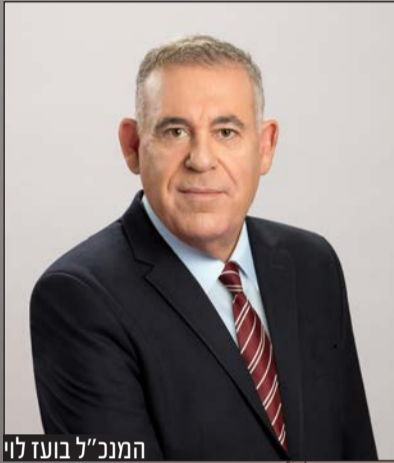
המנכ"ל בועד לוי