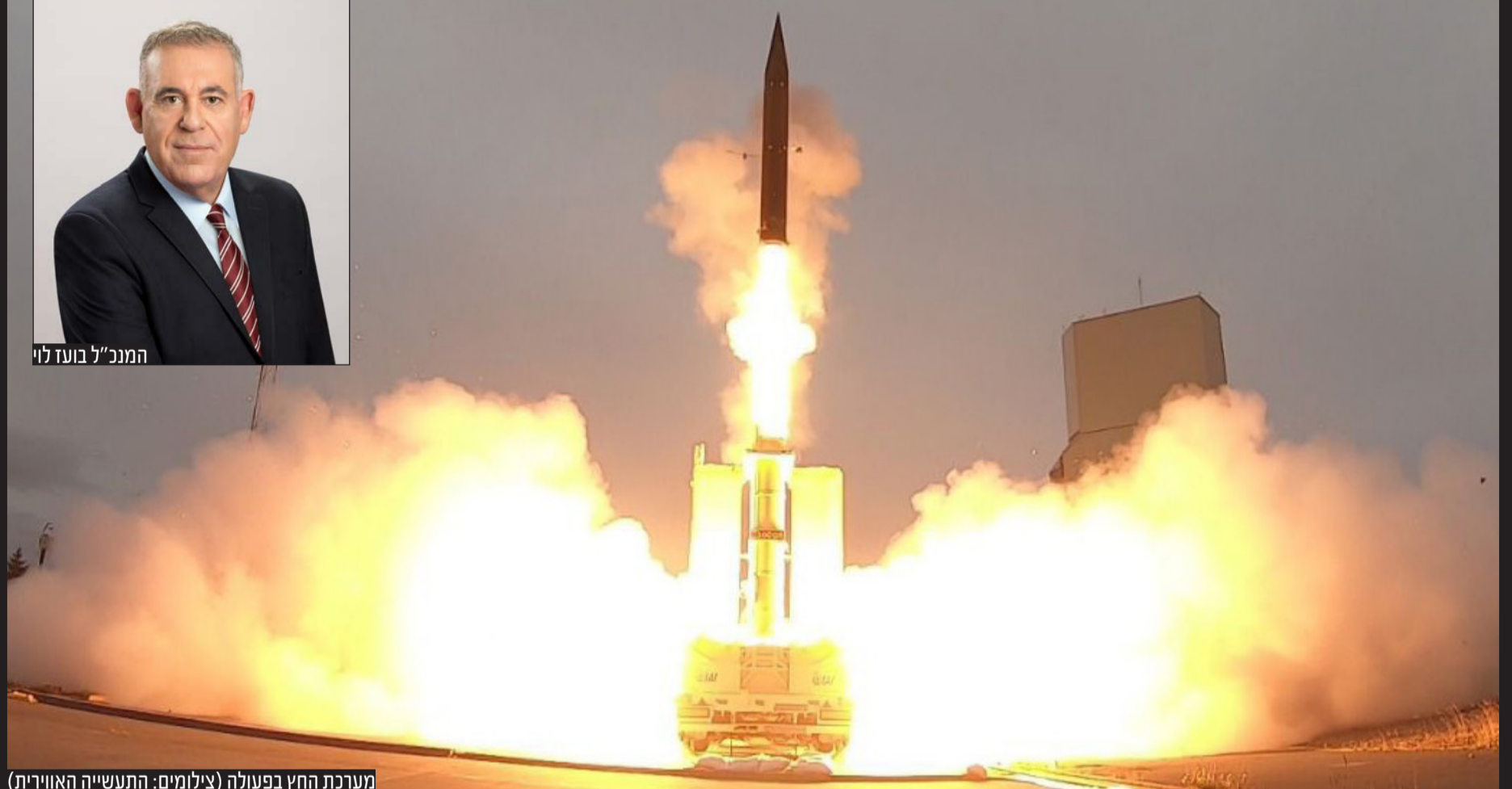
מערכת החץ בפעולה