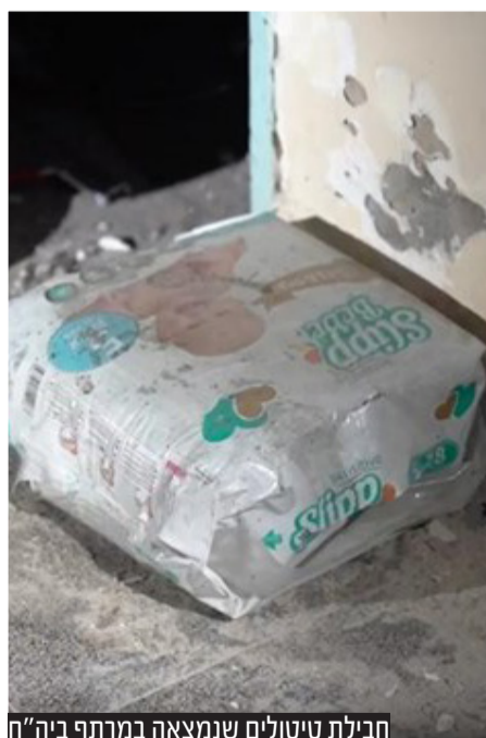
חבילת טיטולים שנמצאה במרתף ביה"ח

בהודעתו אמר דובר צה"ל כי "כמות חומרי הנפץ שנמצאה בבית חולים מהווה סיכון לכל מי שמתאשפז שם. מצאנו שם אופנוע, אנחנו מאמינים שהחטופים הובאו לשם רכובים עליו. אנחנו מאמינים כי חטופים הוחזקו במנהרה, מצאנו כיסא ועליו