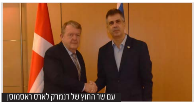
עם שר החוץ של דנמרק לארס ראסמוסן