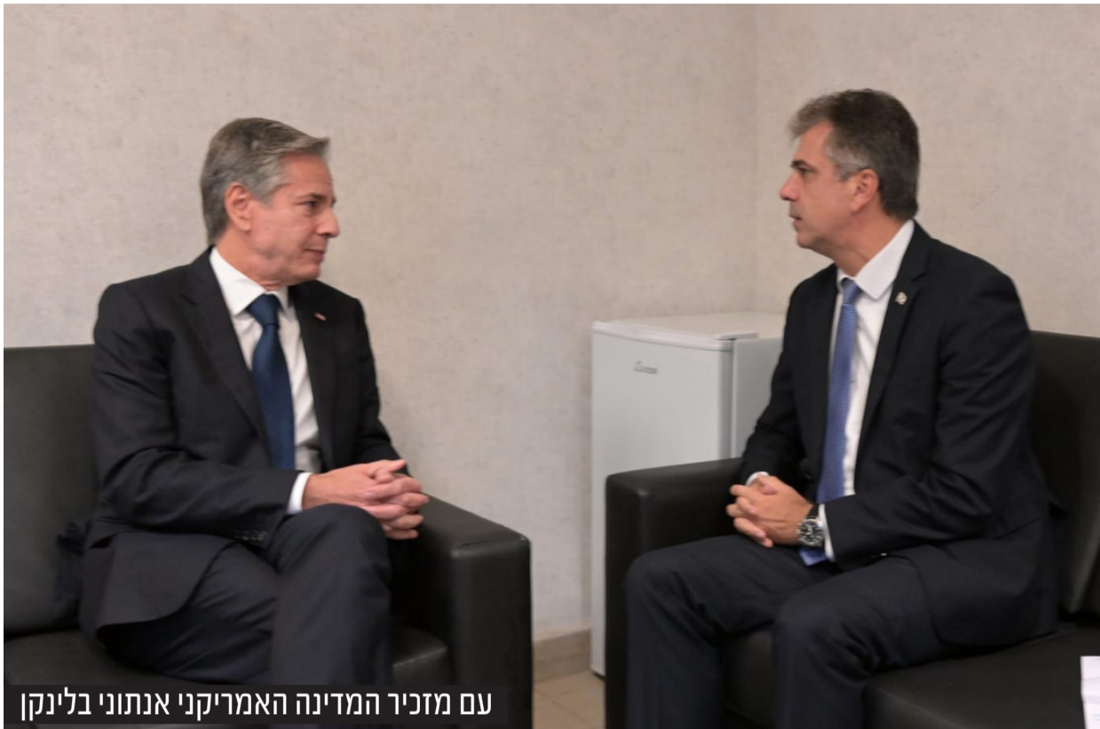
עם מזכיר המדינה האמריקני אנתוני בלינקן