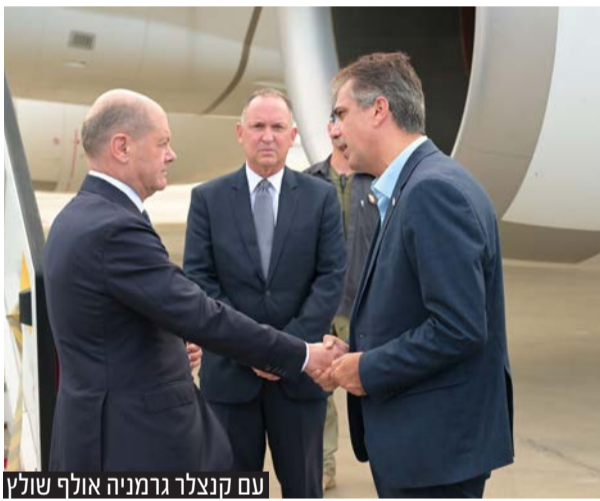
עם קנצלר גרמניה אולף שולץ