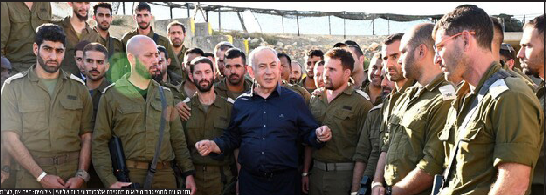
נתניהו עם לוחמי גדוד מילואים מחטיבת אלכסדרוני ביום שלישי