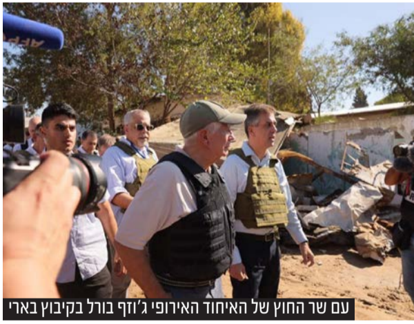
עם שר החוץ של האיחוד האירופי ג'וזף בורל בקיבוץ בארי