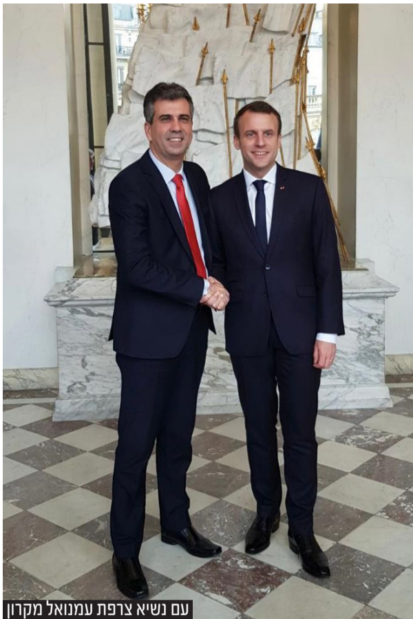
עם נשיא צרפת עמנואל מקרון