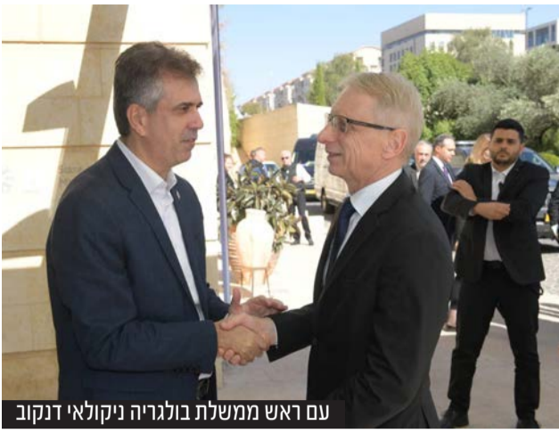
עם ראש ממשלת בולגריה ניקולאי דנקוב