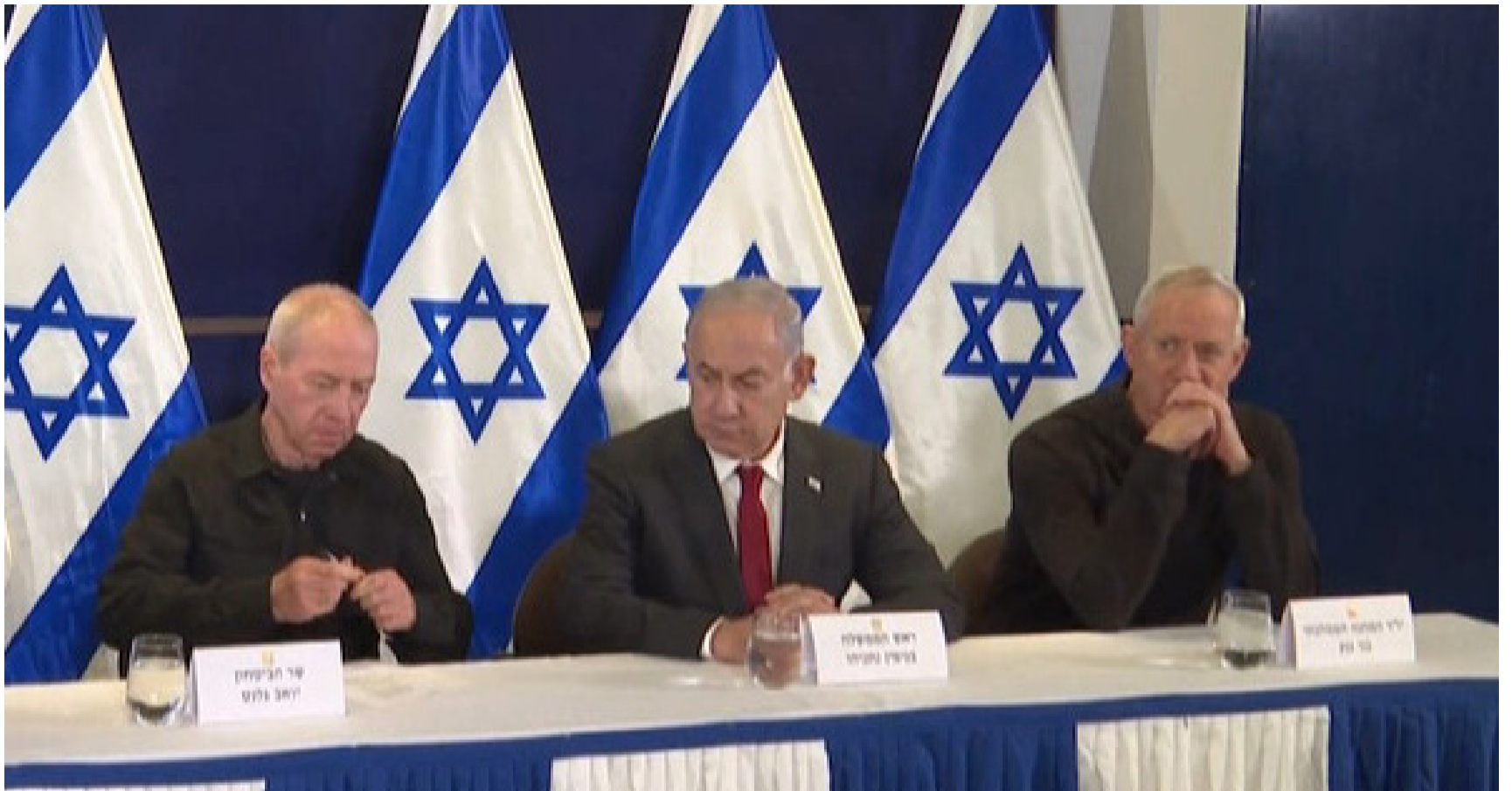
שיתוף פעולה מלא וזמני. נתניהו, גלנט וגנץ במסיבת העיתונאים

עקיף הקובע כי אם ישראל תוותר בעסקה הראשונה על חלק מהחטופים, היא כבר לא תצליח לייצר עסקה נוספת בהמשך. מנגד, יטענו גנץ ושות' כי אדרבה, עסקה מוצלחת אחת תוכל להיות מבוא לעסקאות נוספות בהמשך.