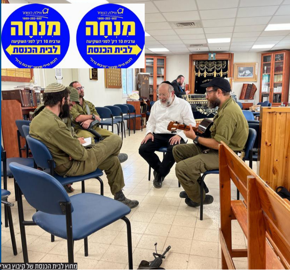
מחוז לבית הכנסת של קיבוץ בארי

הגבאית שניצלה בנס מהמחבלים משחזרת את הרגעים הדומטיים • סיפורם של בתי הכנסת ביישובי העוטף שמהווים מעין 'תחנת דלק' לתושבים • ועשו לי מקדש