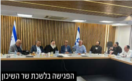
הפגישה בלשכת שר השיכון