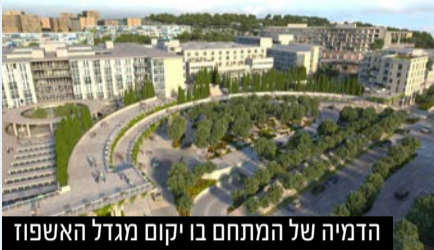
הדמיה של המתחם בו יקום מגדל האשפוז