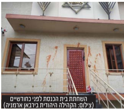
השחתת בית הכנסת לפני כחודשיים