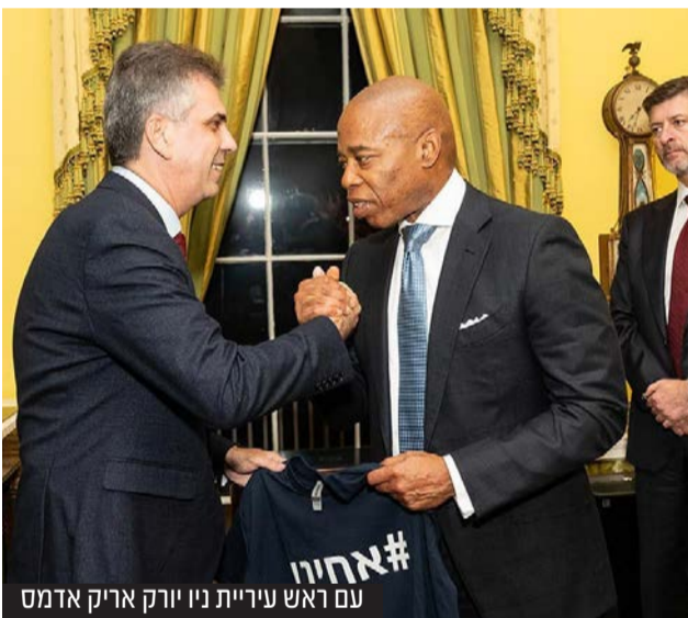
עם ראש עיריית ניו יורק אריק אדמס