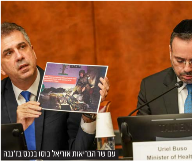
עם שר הבריאות אוריאל בוסו בכנס בד'נבה