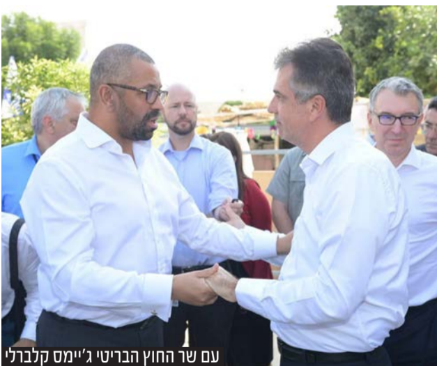
עם שר החוץ הבריטי ג'יימס קלברלי