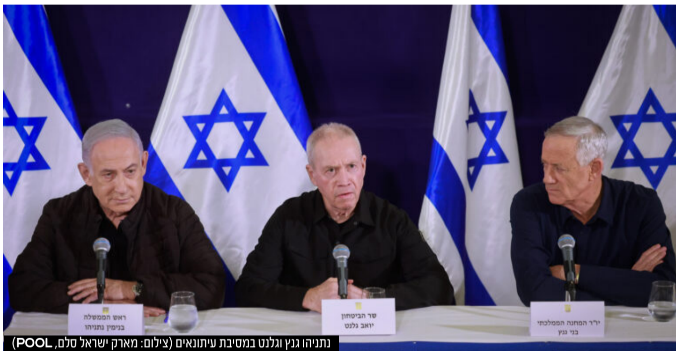
נתניהו, גנץ וגלנט במסיבת עיתונאים

לדברי ראש הממשלה: "אתם זוכרים שאמרו לנו שלא נפרוץ לעזה? פרצנו. אמרו לנו שלא נגיע לפאתי העיר עזה - הגענו. אמרו לנו שלא נכנס לשיפא - נכנסנו. וברוח הזאת אנחנו אומרים דבר פשוט - אין מקום בעזה שלא נגיע אליו. אין מסתור, אין מחסה, אין מקלט למרצחי החמאס" • השר בני גנץ: "סינוואר חשב שיפרק את החברה הישראלית - וכשהוא רואה את מה שקורה, הוא מבין שהוא לא רק מפסיד בקרבות - הוא והחמאס יפסידו במלחמה"