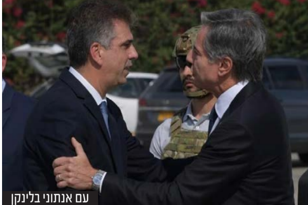
עם אנתוני בלינקן

ישראל להגן על עצמה אחרי הטבח בשביעי לאוקטובר, כשאמר, "מדינת ישראל הוכיחה שהיא גובה את המחיר ממי שפגע בה". הערות אלה הן עדות לנחישותה של ישראל אל מול הקשיים, ומדגימות חזית אחידה מול האתגרים שמעמידה המלחמה על ממשלת ישראל ותושביה.