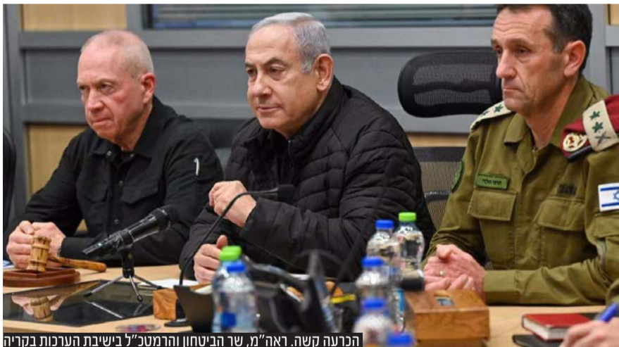
הכרעה קשה. ראה"מ, שר הביטחון והרמטכ"ל בישיבת הערכת בקריה

ע"פ מתווה העסקה שסוכם בתיווך קטאר ובתמיכה אמריקאית: חמאס ישחרר במשך ארבעה ימים 50 חטופים ישראלים חיים • מרבית החטופים שצפויים להשתחרר: נשים, ילדים ומבוגרים • התמורה: שחרור של 150 מחבלים בעיקר אסירות וצעירים "ללא דם על הידיים", הפסקת אש למשך ארבעה ימים והפסקת פעילות לאיסוף מידע למשך שש שעות בכל יום מימי ההפוגה