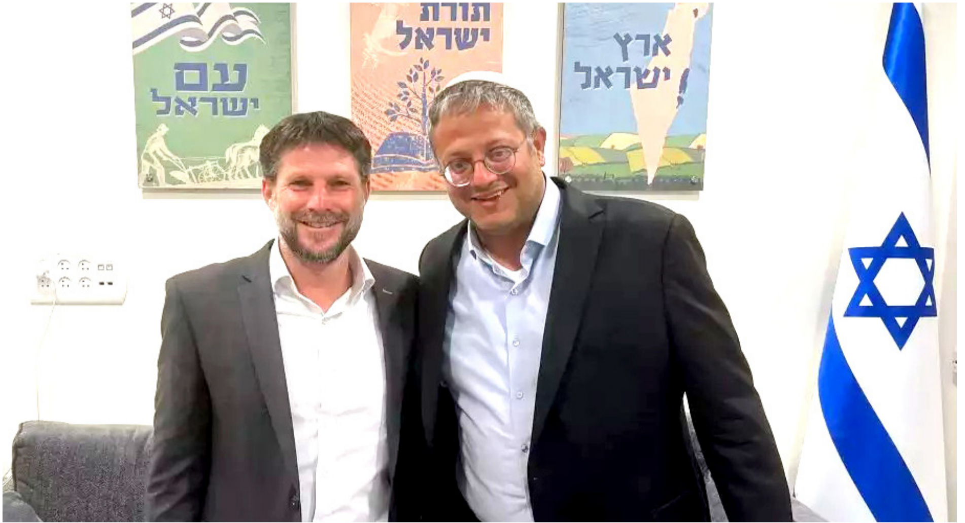
ימין שמאגף את הימין. שרי האוצר והביטחון הלאומי