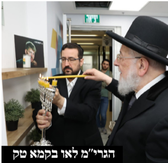
הגרי"מ לאו בקמא טק

הרב הראשי הגרי"מ לאו הדליק נרות חנוכה באירוע פתיחה של כיתת לימודים ב'קמא טק' שמנציחה את זכרו של ירון-אורי שי הי"ד, וקרא להגברת מעשים של אחדות בעם ישראל | "כך נזכה ברחמי שמים ובימים של שלום ושלווה"