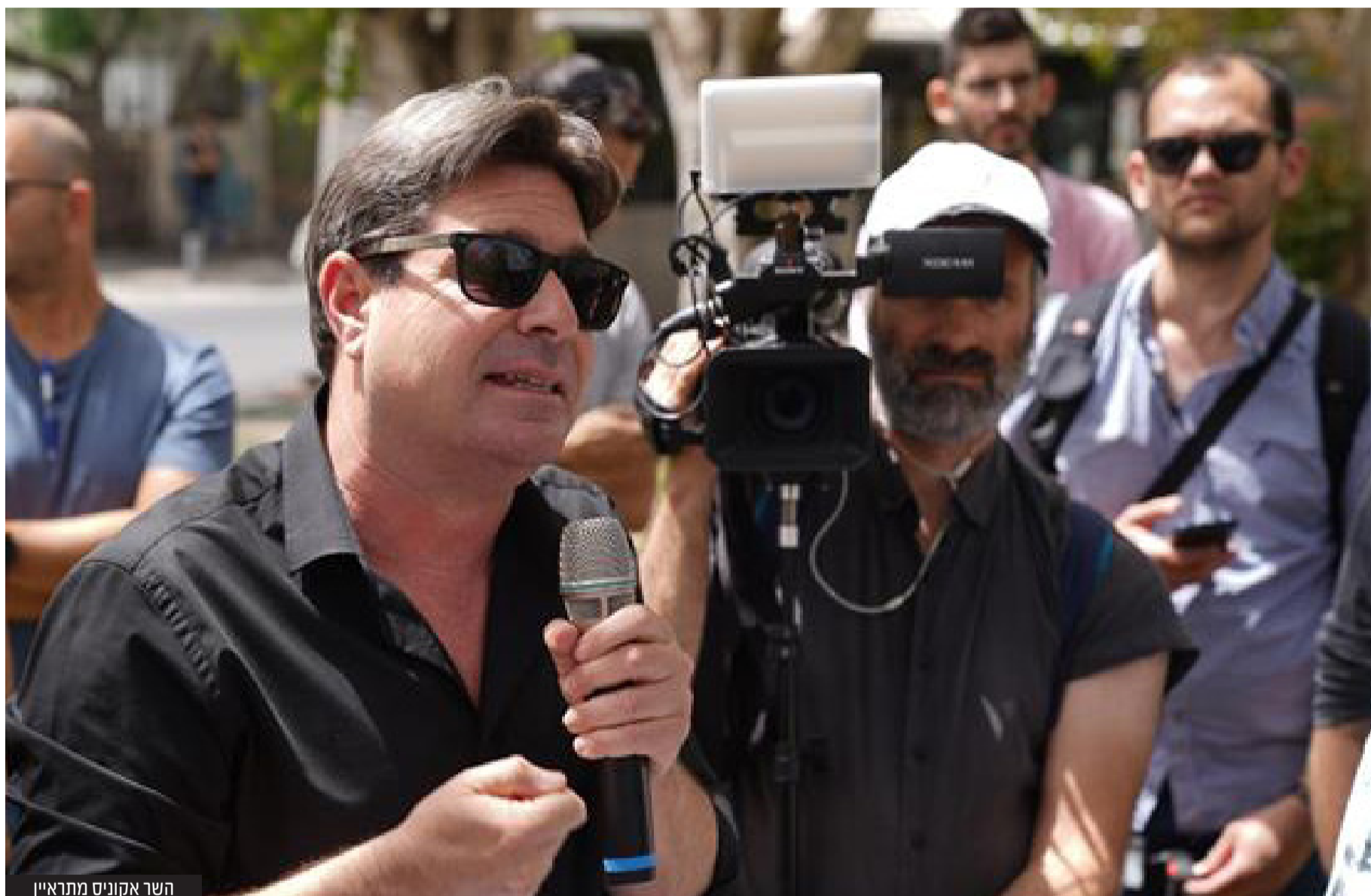
השר אקוניס מתראיין

"הקונספציות הישנות קרסו. תפיסות עולם של עשרות שנים התנפצו אל סלע המציאות", אומר שר המדע אופיר אקוניס בראיון • "אחרי המלחמה תקום ועדת חקירה ממלכתית, זה צורך חיוני. דעתי היא שהמנדט שלה צריך להיות בדיקה מקיפה. שתתחיל בהתנתקות ותימשך עד פריצת הגבולות בשש וחצי בבוקר בשבת השחורה" • "כשיחזרו תושבי העוטף לישובים המתחדשים לא יהיה עוד איום של כוח צבאי על הגדרות"