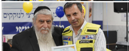
ערב הוקרה שקיים חסדי נעמי למתנדבי זק"א