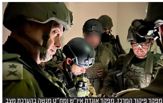
מפקד פיקוד המרכז, מפקד אוגדת איו"ש ומח"ט מנשה בהערכת מצב

גורמים המעוררים בנעשה באיו"ש מספרים כי הצבא והשב"כ מודעים להודעות הסתה כאלה ואחרות, בהן