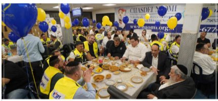
ערב הוקרה שקיים חסדי נעמי למתנדבי זק"א

ערב הוקרה והצדעה ייחודי נערך ע"י 'חסדי נעמי' למתנדבי זק"א