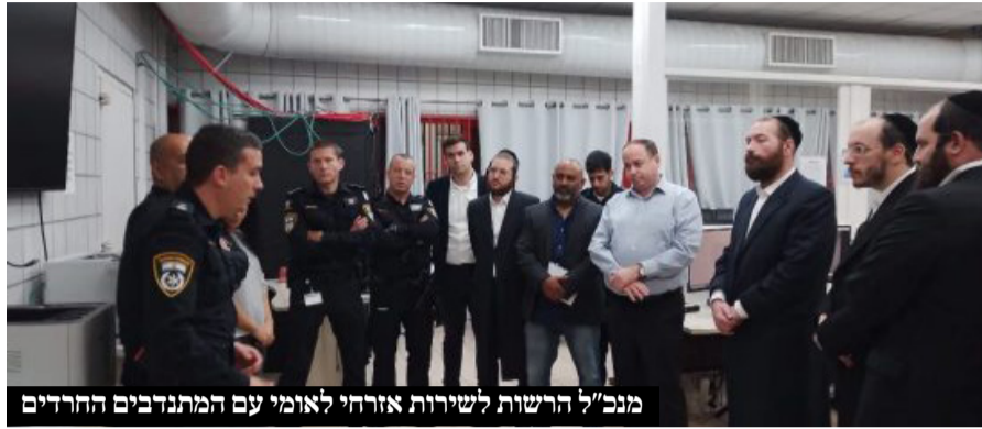
מנכ"ל הרשות לשירות אזרחי לאומי עם המתנדבים החרדים

בימים אלו גם הסתיימה הרשמה לתכנית "מעלות 5", תכנית הדגל של השירות האזרחי בחברה החרדית, המעניקה את האפשרות להשתלב במסלולי הכשרה ושירות ביטחוניים בתפקידים טכנולוגיים ברמה גבוהה במיוחד, שמבטיחה הכשרה וניסיון מעשי בגופים הכי נחשבים בישראל ומהווים נכס אדיר באיתור פרנסה מכובדת בהמשך החיים.