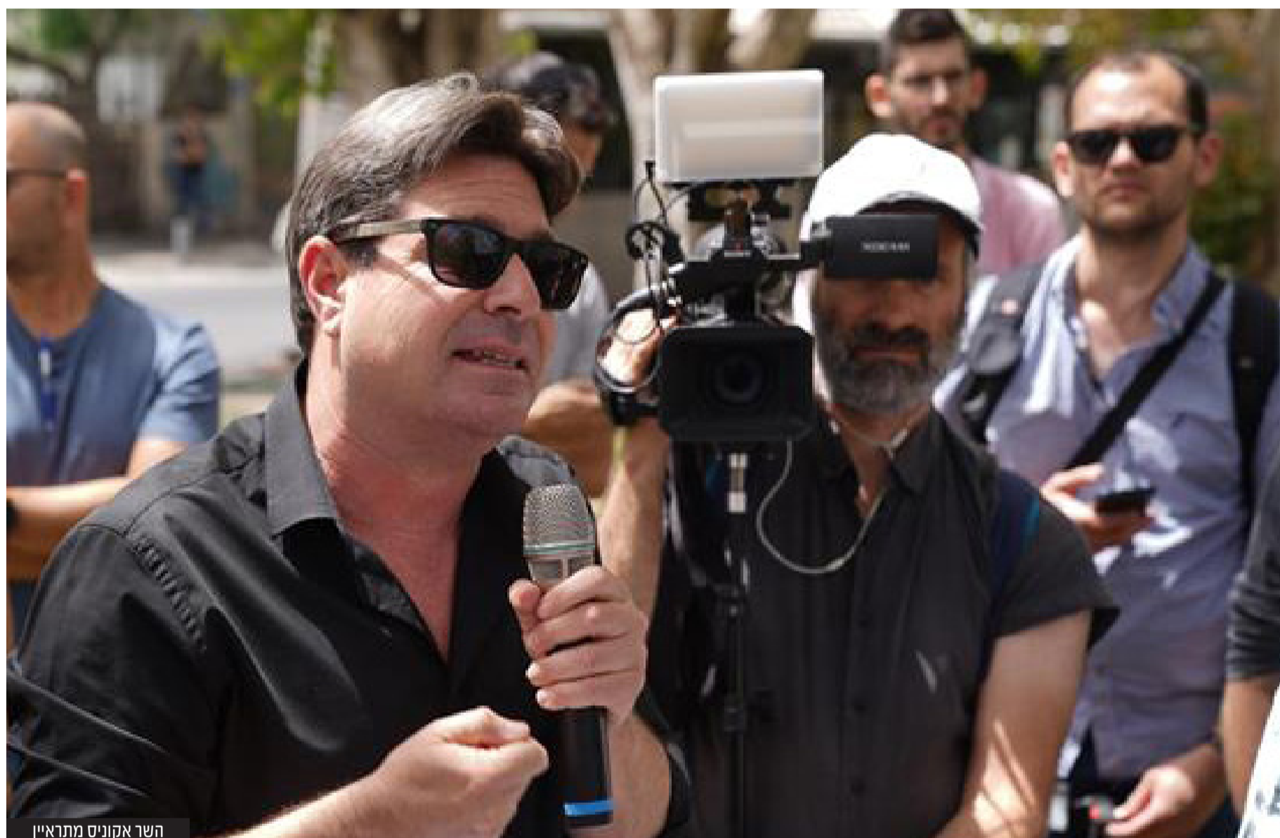
השר אקוניס מתראיין

"הקונספציות הישנות קרסו. תפיסות עולם של עשרות שנים התנפצו אל סלע המציאות", אומר שר המדע אופיר אקוניס בראיון • "אחרי המלחמה תקום ועדת חקירה ממלכתית, זה צורך חיוני. דעתי היא שהמנדט שלה צריך להיות בדיקה מקיפה. שתתחיל בהתנתקות ותימשך עד פריצת הגבולות בשש וחצי בבוקר בשבת השחורה" • "כשיחזרו תושבי העוטף לישובים המתחדשים לא יהיה עוד איום של כוח צבאי על הגדרות"