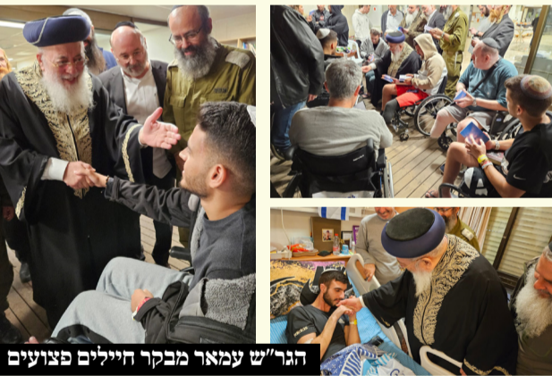
הגר"ש עמאר מבקר חיילים פצועים

מפעים ומרגש: הראשון לציון הגר"ש עמאר ביקר את הפצועים ושר איתם יחד, והתשובה המחכימה שהשיב לחייל הפצוע שביקש לצאת מבית החולים להלוויית אביו