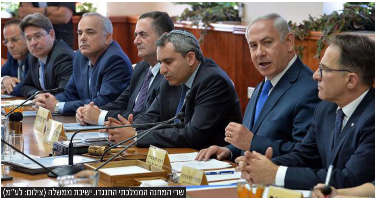
שרי המחנה הממלכתי התנגדו. ישיבת ממשלה

"אני מאמינה בלב שלם ולא מתכוונת להתבייש בזה", הוסיפה ח"כ דיסטל. "כשתלמידי חכם לומד תורה ומתפלל הוא שומר על החייל בצה"ל! רגל פה ורגל שם - רגל לחימה ורגל רוחנית, למה זה חייב לבוא זה על חשבון זה?! למה לא יכולה להיות תפיסה אחרת? גם תורה מגינה עלינו, לא רק עוצם ידי. זה מה שרוב העם בישראל מאמין בו רק מתבייש לומר מרוב פחד".