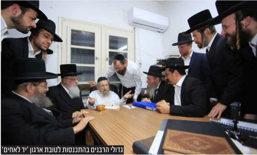
גדולי הרבנים בהתכנסות לטובת ארגון 'יד לאחים'

בעקבות זרם הבקשות ההולך וגובר מאז החלה מלחמת 'חרבות ברזל', לחילוץ מלב הכפרים הערביים - התקיים כינוס חירום במעונו של מרן ראש הישיבה הגר"ד לנדו שליט"א, לחיזוק הפעילים בפעולותיהם לפדיון שבויים, בהשתתפות גדולי הרבנים וראשי הישיבות