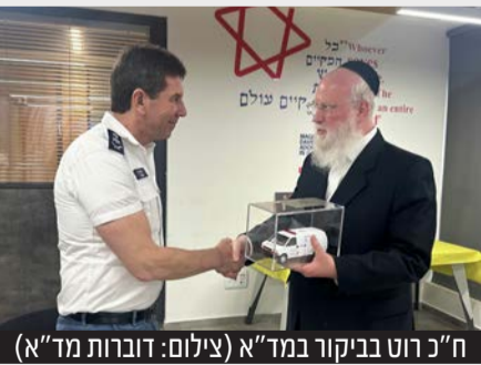
ח"כ רוט בביקורו במד"א

אדום פעלו החל מהשעות הראשונות למלחמה בשטח ובמוקדים וממשיכים לפעול בכל הזירות בהן הם נדרשים. הצוותים פועלים בנחישות, תחת אש ותוך סיכון חייהם על מנת להציל חיים, הצגנו בפני חבר הכנסת רוט את פעילותם של הצוותים בשטח ואת סיפורי הגבורה שלהם".