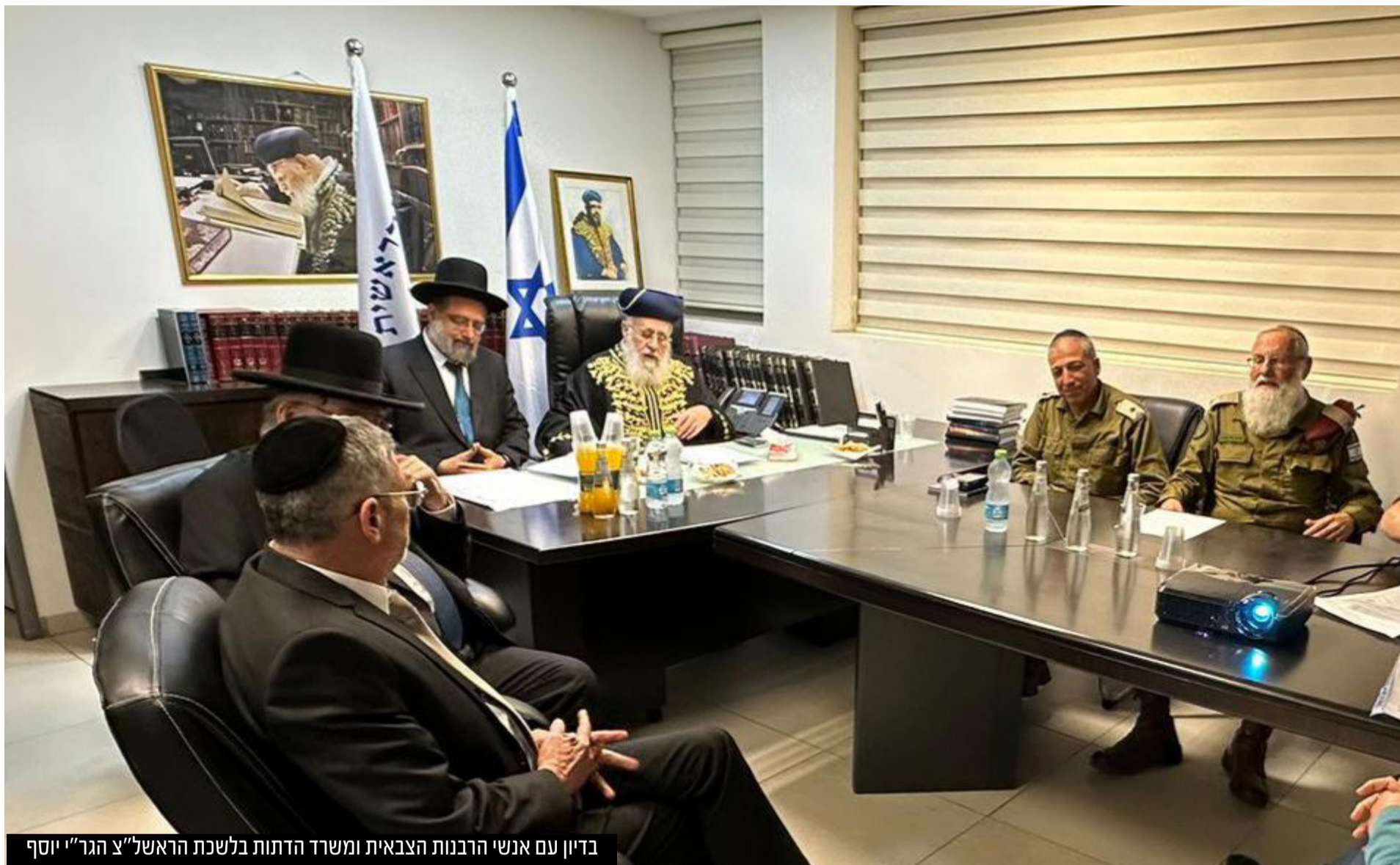
בדיון עם אנשי הרבנות הצבאית ומשרד הדתות בלשכת הראשון לציון הגר"י יוסף

נדמה שלא רק קריסת הקונספציה מחברת בין מלחמת יום הכיפורים ב-1973 לטבח שמחת תורה - גם הסוגיות ההלכתיות שהונחו על שולחנם של פוסקי ההלכה זהות: חמישים שנה לאחר שאביו מרן הגר"ע יוסף זצ"ל הקים בית דין מיוחד לעגונות של חללי מלחמת יום הכיפורים, מצא עצמו בנו הראשון לציון הגר"י יוסף שליט"א מתמודד עם הסוגיא הרגישה וכבדת המשקל כדי להתמודד עם סוגיית עגינותן של חללי המלחמה הנוכחית • שר הדתות מיכאל מלכיאלי שהשתתף בדיונים הדרמטיים והמורכבים מספר בראיון מיוחד על הנעשה מאחורי הקלעים