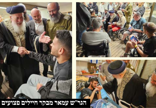
הגר"ש עמאר מבקר חיילים פצועים

מפעים ומרגש: הראשון לציון הגר"ש עמאר ביקר את הפצועים ושר איתם יחד, והתשובה המחכימה שהשיב לחייל הפצוע שביקש לצאת מבית החולים להלוויית אביו