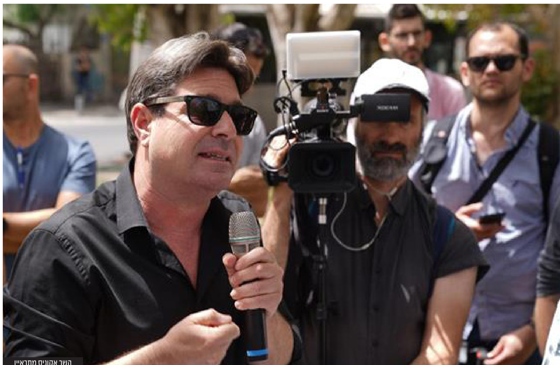
השר אקוניס מתראיין

"הקונספציות הישנות קרסו. תפיסות עולם של עשרות שנים התנפצו אל סלע המציאות", אומר שר המדע אופיר אקוניס בראיון • "אחרי המלחמה תקום ועדת חקירה ממלכתית, זה צורך חיוני. דעתי היא שהמנדט שלה צריך להיות בדיקה מקיפה. שתתחיל בהתנתקות ותימשך עד פריצת הגבולות בשש וחצי בבוקר בשבת השחורה" • "כשיחזרו תושבי העוטף לישובים המתחדשים לא יהיה עוד איום של כוח צבאי על הגדרות"