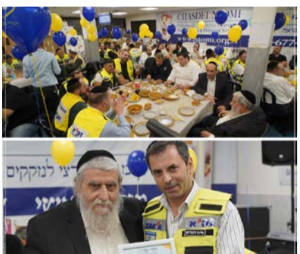
ערב הוקרה שקיים חסדי נעמי למתנדבי זק"א "אתם המודל לחיקוי - חסד של אמת כפשוטו".

ערב הוקרה והצדעה ייחודי נערך ע"י 'חסדי נעמי' למתנדבי זק"א