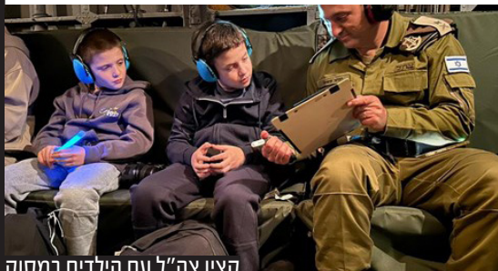
קצין צה"ל עם הילדים במסוק