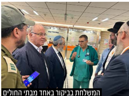
המשלחת בביקור באחד מבתי החולים

משלחת של רבנים מגרמניה ואוסטריה ובהם חברי הועדה המתמדת של 'ועידת רבני אירופה' סיימה בסוף השבוע ביקור הזדהות בישראל במהלכו סיירו ביישובי עוטף עזה, בשדרות ואופקים, ביקרו פצועים בבתי חולים ועמדו מקרוב אחר פעילות חסד של אמת במחנה שורה. הרבנים שוחחו עם מפונים בבתי מלון. קיימו מפגשים עם חיילים בבסיסי צה"ל ונפגשו עם משפחות החטופים - "אנחנו שבים לקהילותינו וחשים בעומק לבבנו והבנתנו שזו העת לאחדות, זו העת לחזק את תושבי ישראל, לתרום ולעשות הכל למען חיזוק החיים והאחדות"