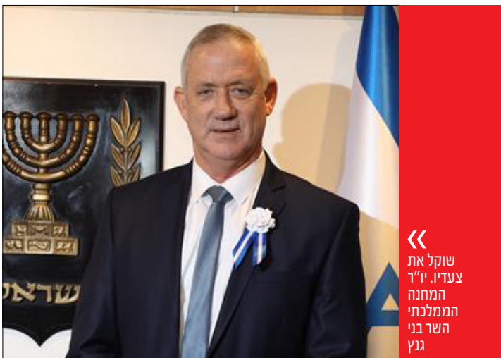
« שוקל את צעדיו. יו"ר המחנה הממלכתי השר בני גנץ

« הנחה הסבירה שבשלב זה, גנץ לא יפרוש מהממשלה, המבחן הבא והמוחשי יותר יתקיים בעוד כשבועיים, כאשר התקציב יגיע לאישור הכנסת. בנוהג המקובל, שר המצביע בכנסת נגד הממשלה, מתפטר מתפקידו. גנץ יצטרך לקבל עד אז את ההחלטה, ולא מן הנמנע שזו תושפע ממצב המלחמה: אם הקרבות העזים בעזה יתחדשו, נראה אותו תומך בתקציב בליט ברירה או נעלם מהזירה בקיזוז לעת מצוא. אם ההפוגה תימשך וישראל תיגרר להפסקת אש כפויה, הוא עשוי לנצל את ההזדמנות ולשבור את הכלים, בניסיון לבצע אקזיט ציבורי מהיר על גילוי האחריות הממלכתית