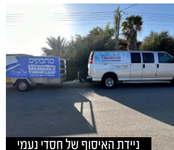
ניידת האיסוף של חסדי נעמי

משפחות המפונים מקבלות תמיכה על בסיס יומי • ניידת חדשה הופעלה כדי לתת מענה מוגבר