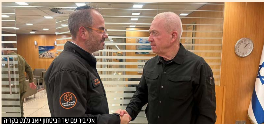
אלי ביר עם שר הביטחון יואב גלנט בקריה

נשיא ומייסד איחוד הצלה אלי ביר נפגש עם שר הביטחון יואב גלנט בלשכתו שבקריה בתל אביב ששיבח את פעילות המתנדבים: "הצלתם חיי אדם תחת אש המרצחים וזה לא מובן מאליו, אנחנו מעריכים את זה מאוד"