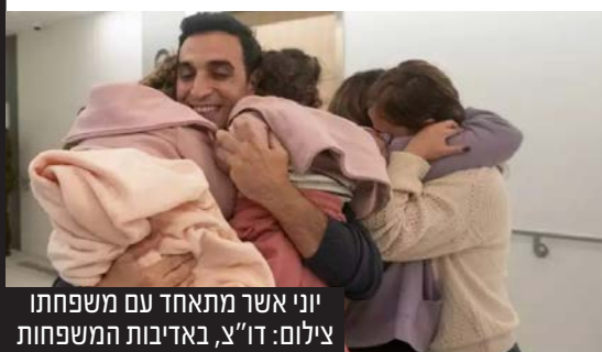
יוני אשר מתאחד עם משפחתו