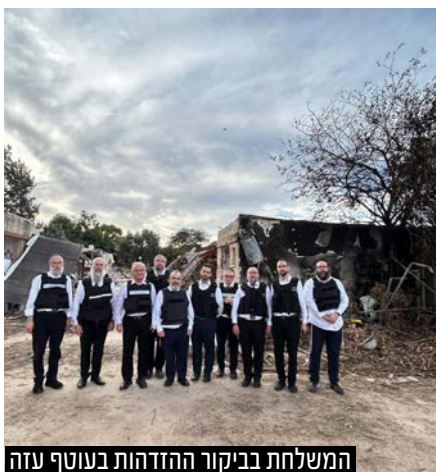
המשלחת בביקור ההזדהות בעוטף עזה