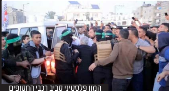
המון פלסטיני סביב רכבי החטופים