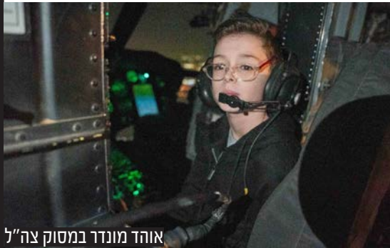
אוהד מונדר במסוק צה"ל

לסיכום, עסקאות חילופי שבויים, במיוחד אלו הכרוכות בשחרור מחבלים מרשעים, מעלות דילמה אתית ואסטרטגית משמעותית. יש לשקול את הפוטנציאל ליתרונות מידיים, כגון החזרתם הבטוחה של חיילים שבויים, אל מול ההשלכות האפשריות לטווח הארוך, לרבות הפוטנציאל לעודד חטיפות נוספות, הסיכון שמחבלים משוחררים יחזרו לפעילותם הצבאית והפוטנציאל לפגיעה במערכת המשפט. זוהי סוגיה מורכבת שאין לה פתרונות קלים, הדורשת שיקול דעת זהיר ומדויק.