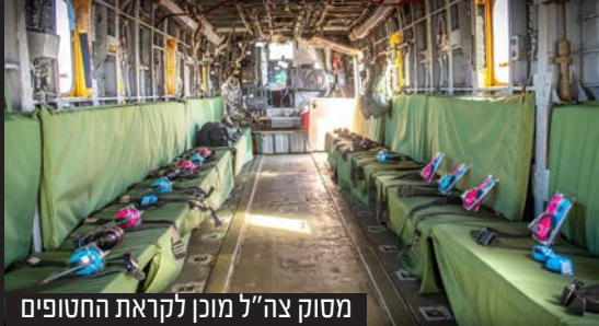
מסוק צה"ל מוכן לקראת החטופים