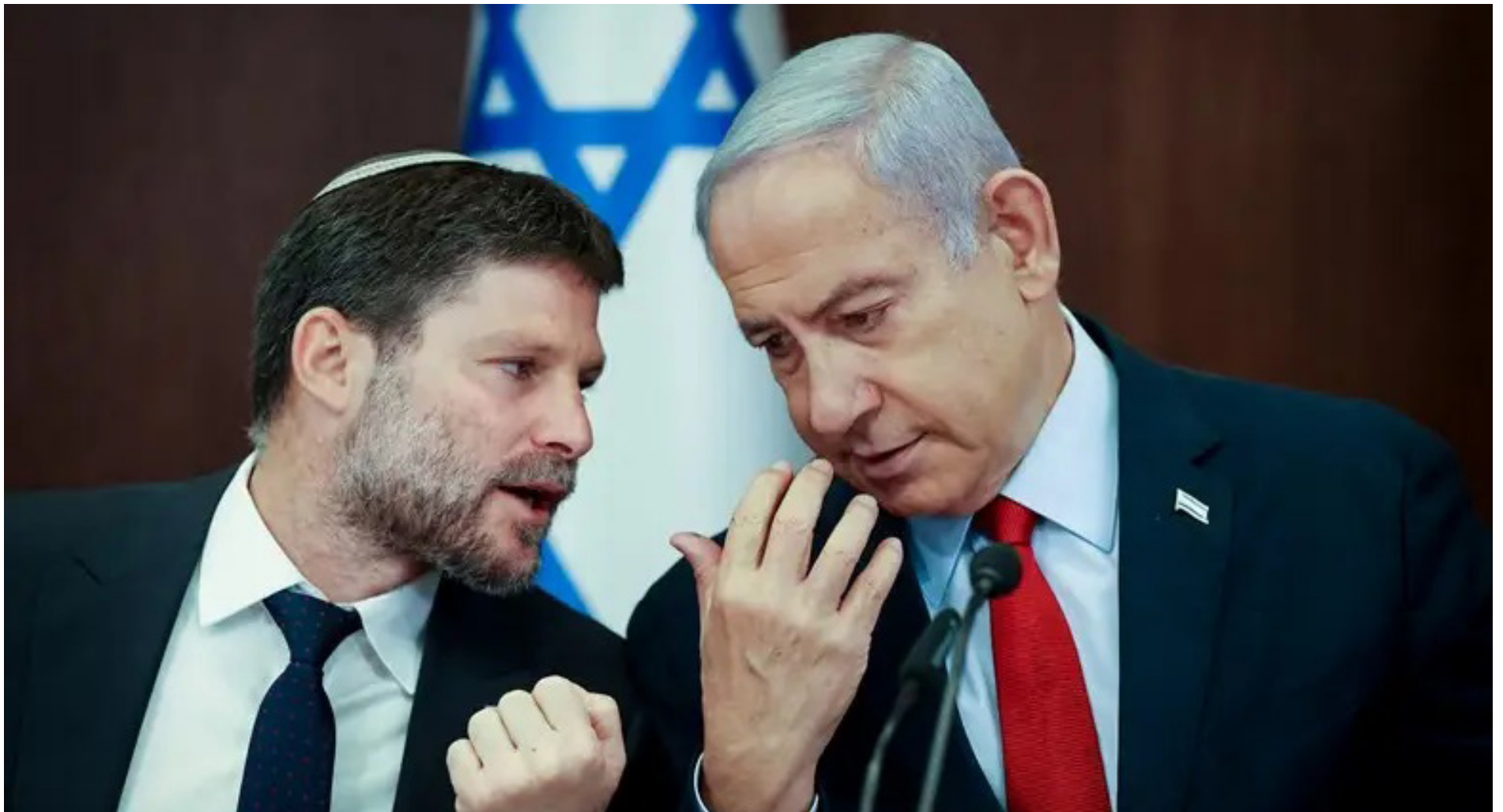
לא התרגשו מאימי המחנה הממלכתי. ראש הממשלה ושר האוצר

של השרה למשימות לאומיות אורית סטרוק. "עם עוד קצת מאמץ ורצון טוב היינו יכולים להגיע להבנות", מבכה אחד הנציגים החרדיים. "אבל ככה זה כשכולם מריחים את הסקרים ואת היום שאחרי", הוא מסכם.