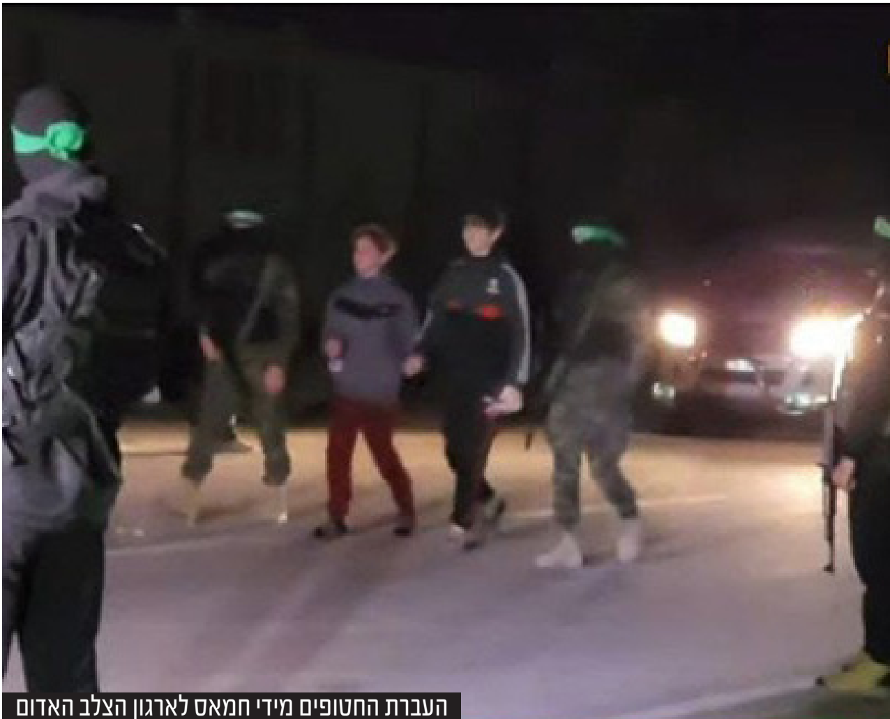
העברת החטופים מידי חמאס לארגון הצלב האדום