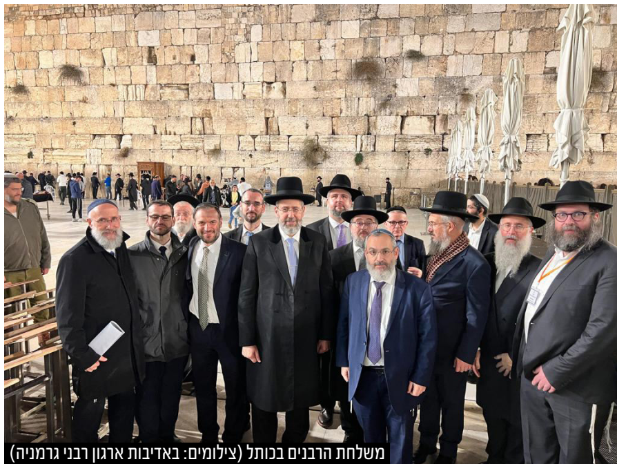
משלחת הרבנים בכותל