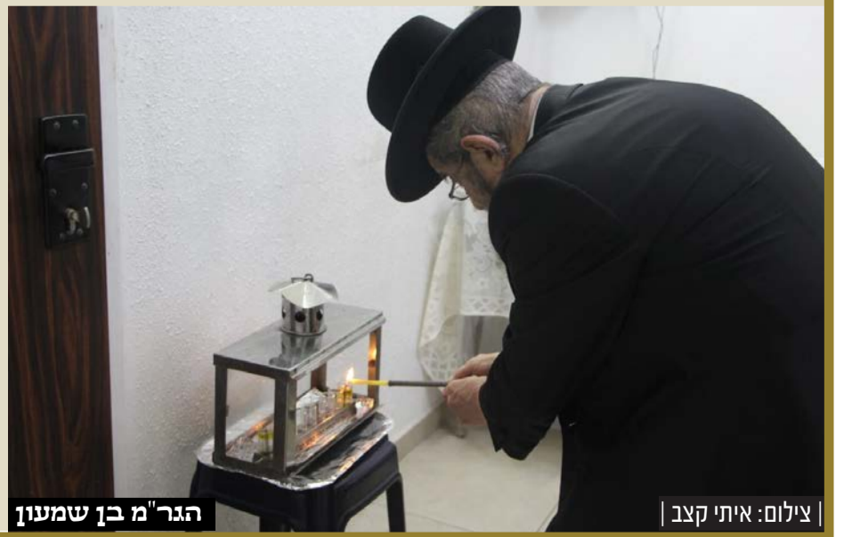
הגר"מ בן שמעון