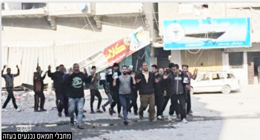
מחבלי חמאס נכנעים בעזה

מאות מחבלים נכנעו ונעצרו בלב עזה • האם תמונות הכניעה מעידות על פירוק החמאס? • הביקורת בעולם והתשובה של הצבא • ומה יהיה בעזה ביום שאחרי? • תמונת מצב | עמ' 11