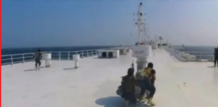
השתלטות החות'ים על ספינה ישראלית בלב ים