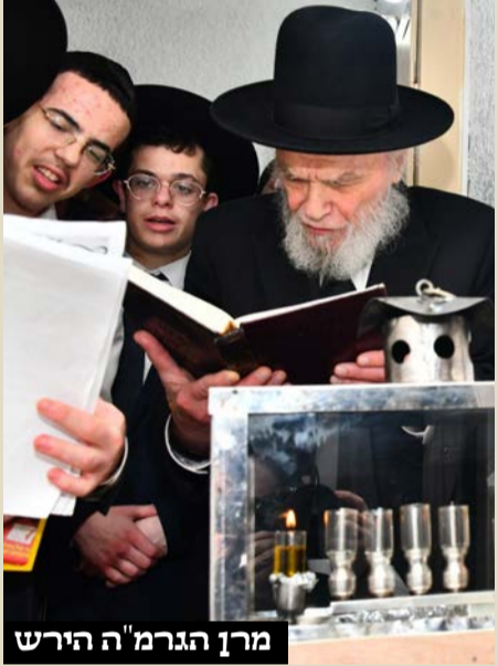
מרן הגרמ"ה הירש