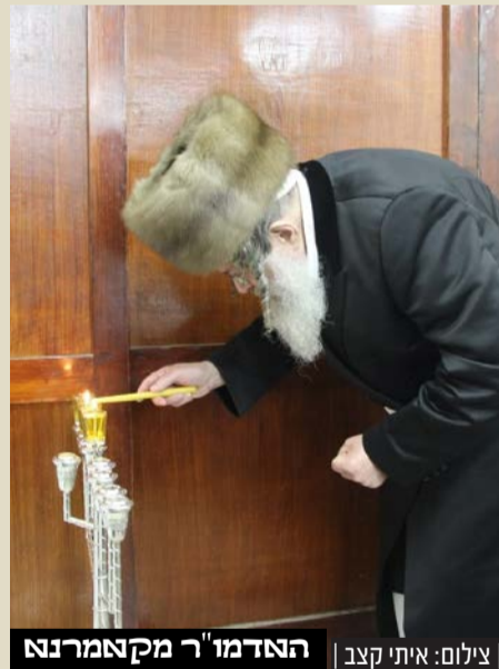
האדמו"ר מקאמרנא