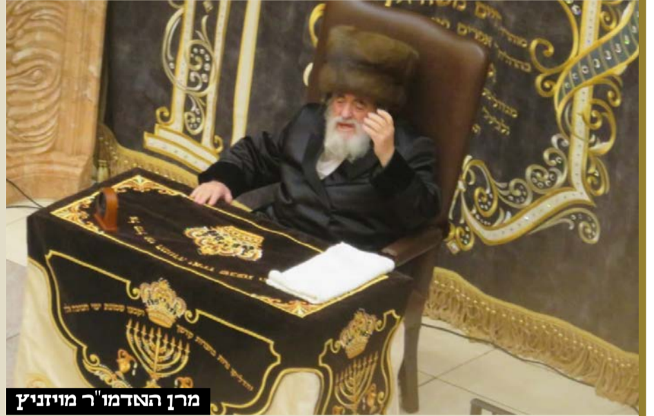
מרן האדמו"ר מויזניץ