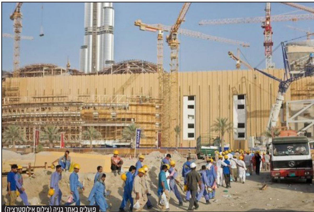
פועלים באתר בניה (צילום אילוסטרציה)