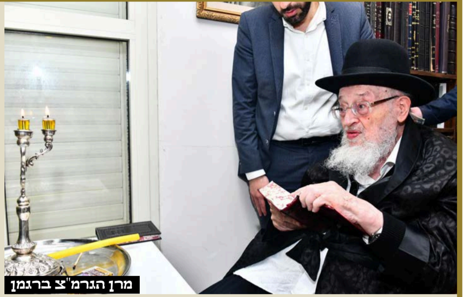
מרן הגרמ"צ ברגמן