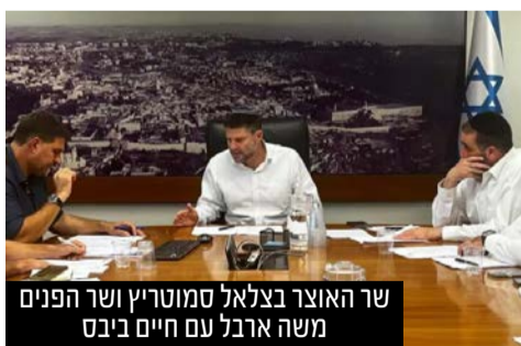
שר האוצר בצלאל סמוטריץ ושר הפנים משה ארבל עם חיים ביבס

שר הפנים משה ארבל מתעקש שהבחירות יתקיימו בסוף חודש ינואר • בראש המתנגדים: שר האוצר בצלאל סמוטריץ' •