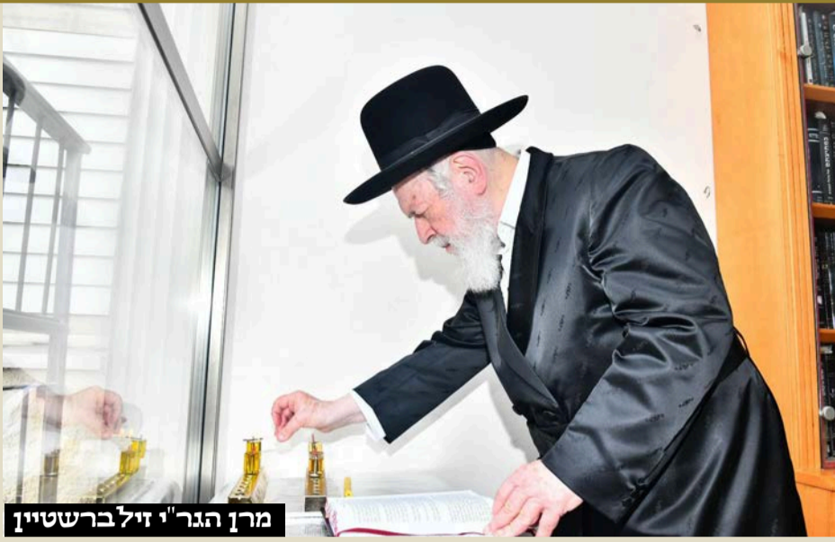
מרן הגר"י זילברשטיין