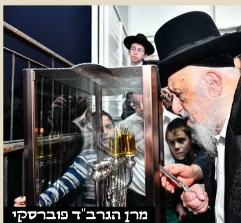
מרן הגרב"ד פוברסקי