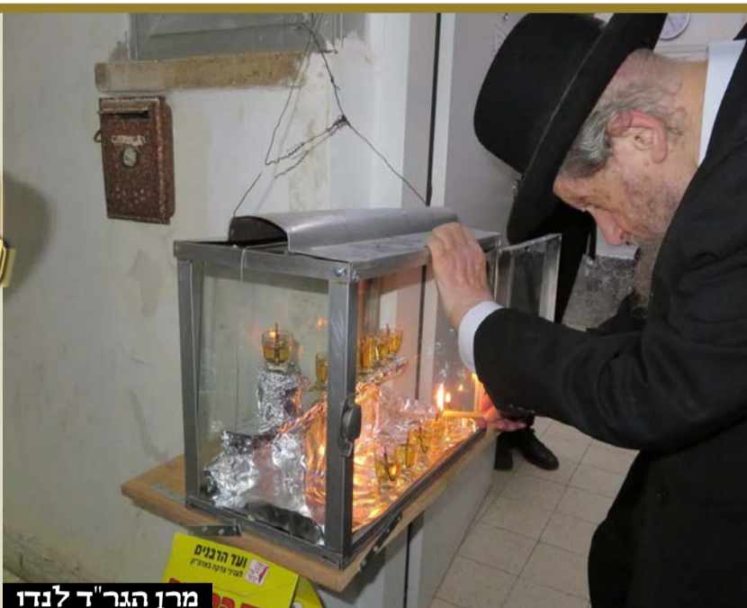
מרן הגר"ד לנדו