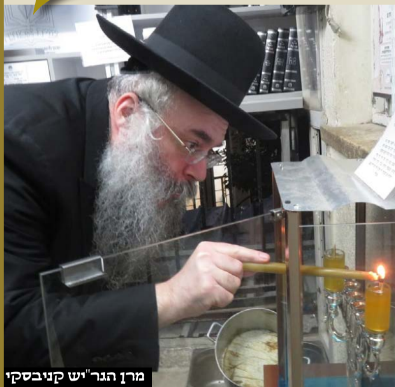
מרן הגר"ש קניבסקי