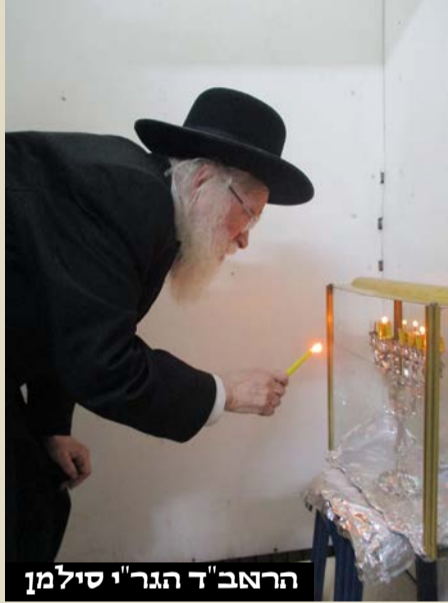
הראב"ד הגר"י סילמן