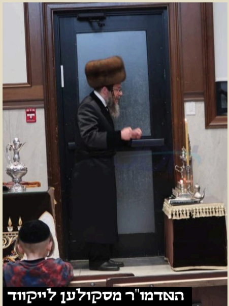
האדמו"ר מסקולען לייקווד