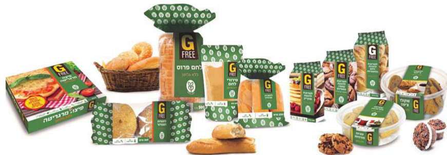
מזון ללא גלוטן (באדיבות ארגון זכויות הציליאק)