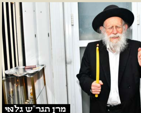
מרן הגר"ש גלאי