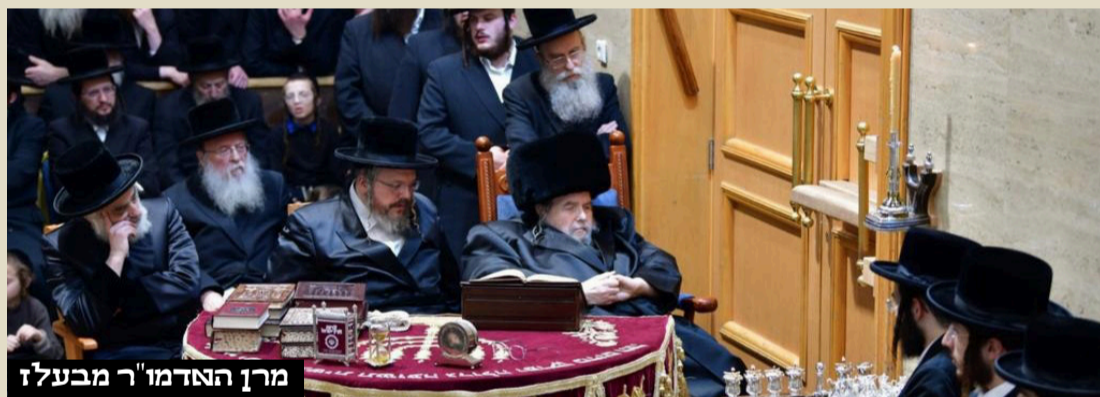
מרן האדמו"ר מבעלז