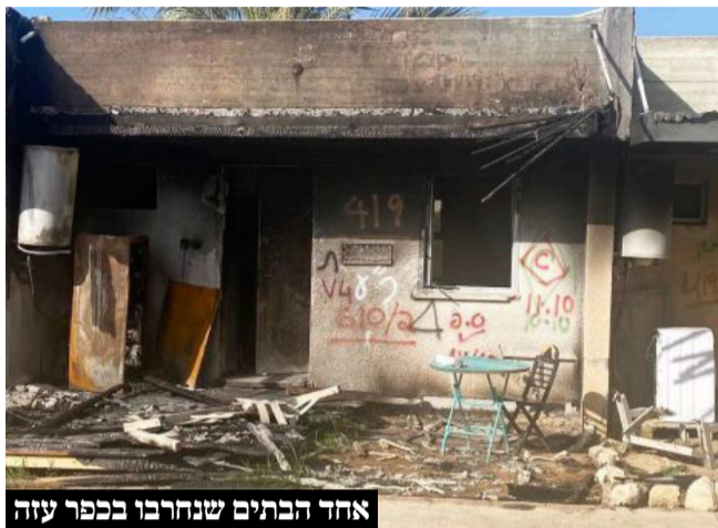
אחד הבתים שנחרבו בכפר עזה

בתיאור אולי, תושבת כפר עזה האמינה בכוונותיו • היא אף קיימה תערוכה עם 'צלם חובב' שתיעד עבורה את רחובות שכ' סאג' עיה בעזה בעוד היא מתעדת את רחובות כפר עזה • כשהיא נצורה בממ"ד התקשר אליה הצלם החובב כדי לברר כמה חיילים יש כעת ביישוב • רק אז הבינה שמדובר בפעיל חמאס או במשת"פ שביקש לאסוף פרטים על כפר עזה