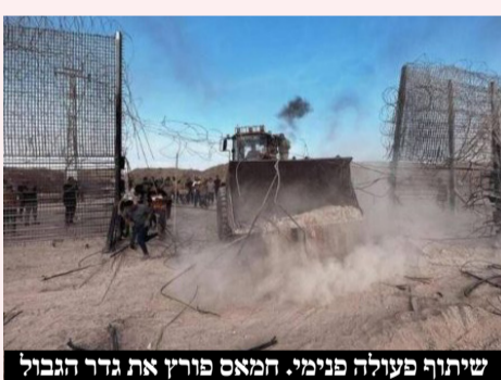
שיטוף פעולה פנימי. המאס פורץ את גדר הגבול

אדם נוסף, לאסוף אותם לביתו. ל א ח ר כשבועיים נוצר קשר עם אלעיד בבקשת 'שני פועלים מעזה ללא אישורי השהייה' שמעוניינים לעבוד אצלו. למרות שאלעיד חשד כי נכנסו בחסות המתקפה, הלין אותם בביתו ונמנע מלברר את נסיבות כניסתם לישראל. בבקשת המעצר עד תום ההליכים טענה הפרקליטות כי השלושה ביצעו עבירות נגד ביטחון המדינה, וכי הם