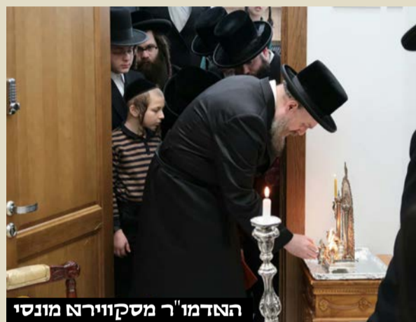
האדמו"ר מסקווירא מונסי