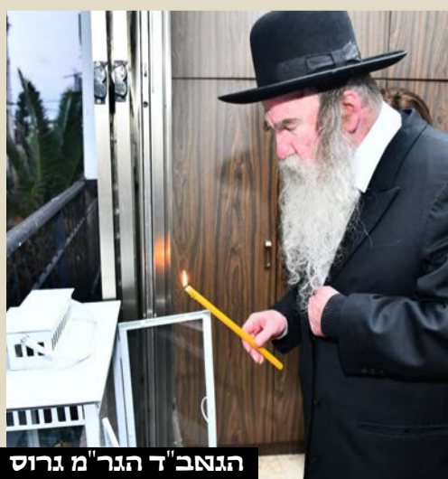
הגאב"ד הגר"מ גרוס