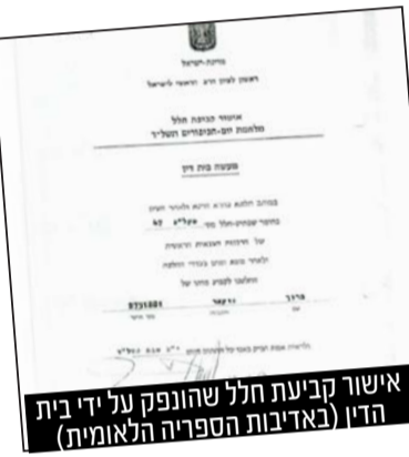
אישור קביעת חלל שהופק על ידי בית הדין