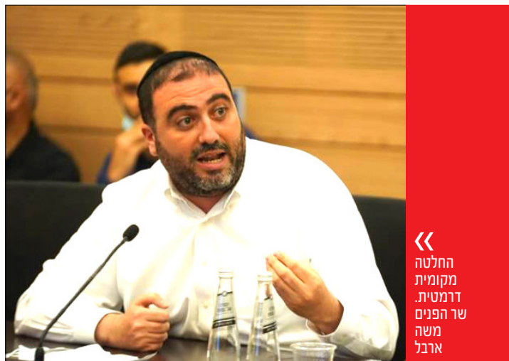
« החלטה מקומית דרמטית. שר הפנים משה ארבל

כיום, דרעי לא רק שותף לקבינט המצומצם, הוא נוכח גם בדיונים המקצועיים ביותר, כולל אלו שנערכים בהשתתפות ראש הממשלה ובכירי מערכת הביטחון בלבד. ככלל, במערכת הביטחון מספרים על ערוץ ישיר ויעיל במיוחד בין יו"ר ש"ס ובין ראש המוסד וראש השב"כ, ערוץ שסייע להעביר לא מעט מההחלטות הרגישות בתקופה האחרונה.