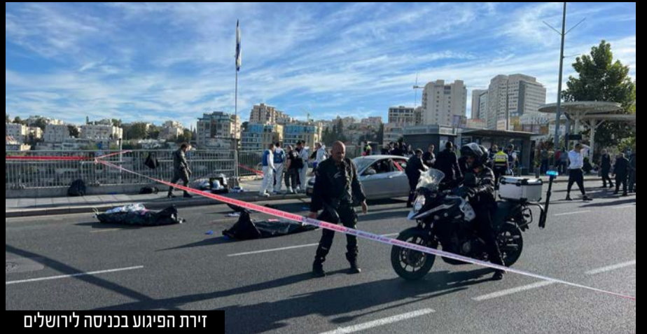
מתנדבי זק"א בזירת הפיגוע