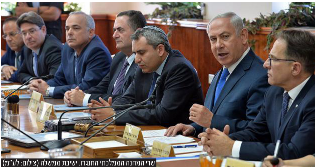
שרי המחנה הממלכתי התנגדו. ישיבת ממשלה

"כל תשתית המחשבה של המוסר בעולם המערבי, בנוי על היהדות, בזמן ששאר האנושות הייתה עסוקה בעבודה פגאנית ובחוסר אתיקה מוחלט בין גבר לאישה ובין המוחלשים בחברה, היהדות הביאה לעולם נס מחשבתי - לקרוא לזה בערות, לקרוא למה שמכונן אותנו בערות, זה מבחינתי עצוב ברמות שאין לי אפשרות לתאר במילים".