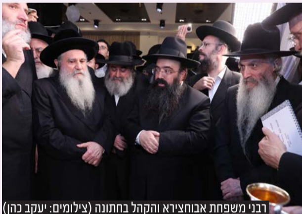
רבני משפחת אבוחצירא והקהל בחתונה