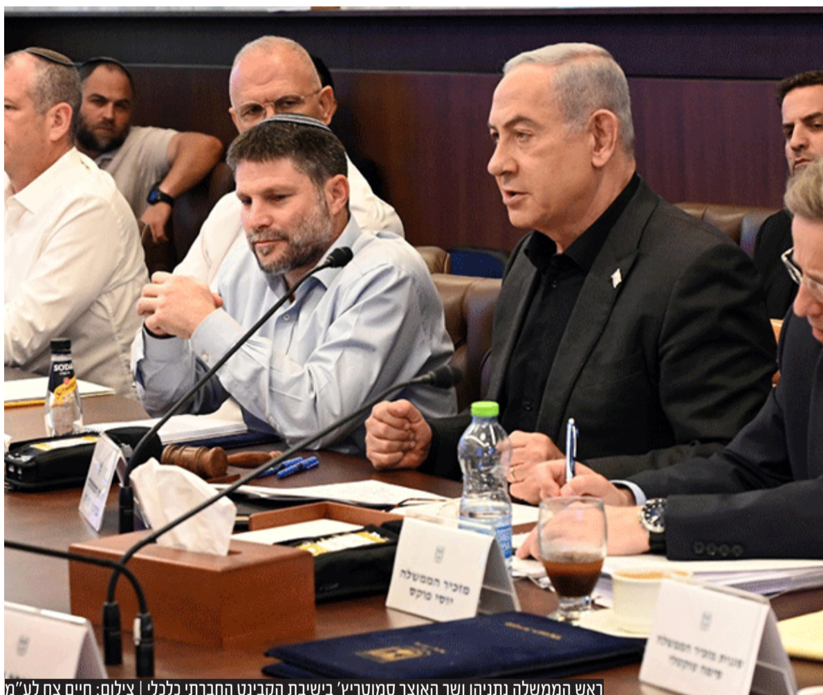
ראש הממשלה נתניהו ושר האוצר סמוטריץ' בישיבת הקבינט החרדי כלכלי

ברשומה שפירסם שר האוצר בצלאל סמוטריץ' הוא תוקף את מתנגדי התקציב ומגן על העלאת תוספת שכר למורים החרדים כפי שסוכם במסגרת 'אופק חדש': "מי שמבקש לקחת רק להם את התוספת ולהשאיר אותה לכל יתור המורים במדינת ישראל ולכל עובדי המגזר הציבורי שקיבלו תוספות שכר בהסכמים שחתמתי עם הארגונים שלהם, מבקש להפלות חרדים רק כי הם חרדים, וזה לא קשור בכהוא זה למלחמה"