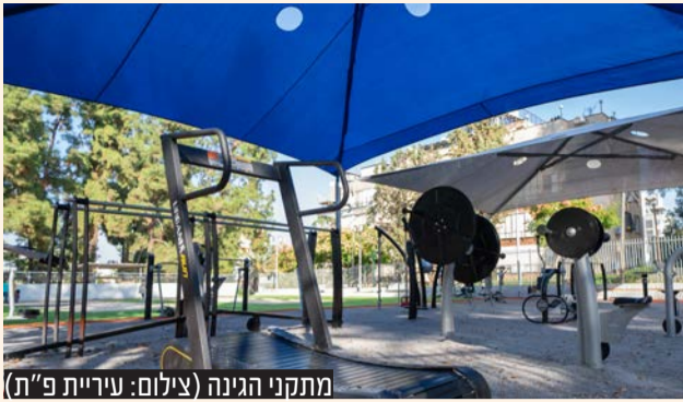
מתקני הגינה