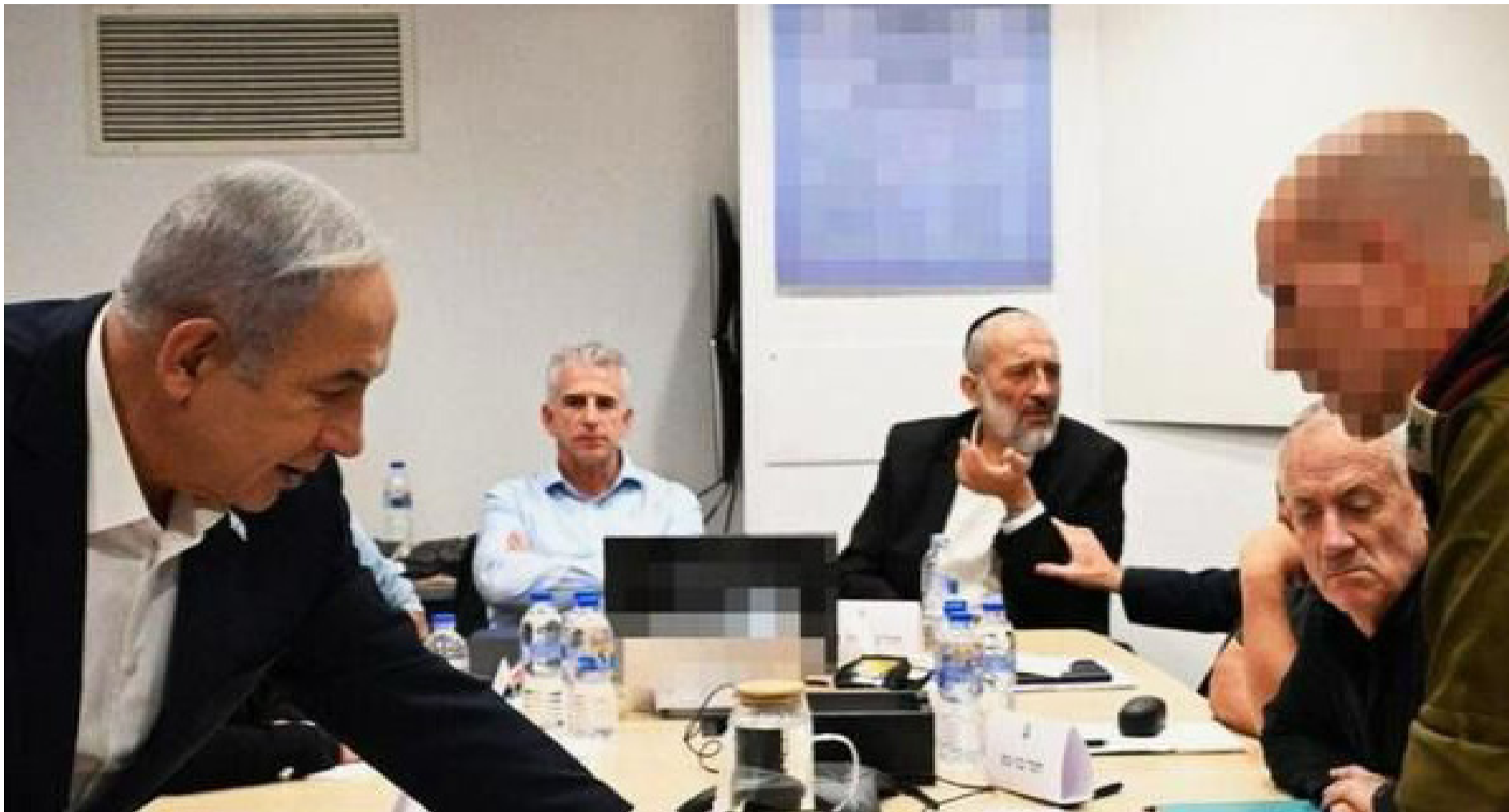
קאמבק מזהיר לליבת קבלת ההחלטות. דרעי בקבינט המלחמה

יוכל לעשות זאת בהצבעות בכנסת על התקציב ולא במסעות סרק לערים החרדיות. נתניהו, מנגד, השקיע השבוע שעות ארוכות בכיסוס הקואליציה, הן בקרב חברי הליכוד פנימה והן בקרב השותפות הקואליציוניות.