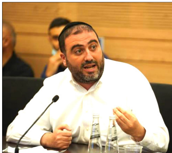
« החלטה מקומית דרמטית. שר הפנים משה ארבל

כיום, דרעי לא רק שותף לקבינט המצומצם, הוא נוכח גם בדיונים המקצועיים ביותר, כולל אלו שנערכים בהשתתפות ראש הממשלה ובכירי מערכת הביטחון בלבד. ככלל, במערכת הביטחון מספרים על ערוץ ישיר ויעיל במיוחד בין יו"ר ש"ס ובין ראש המוסד וראש השב"כ, ערוץ שסייע להעביר לא מעט מההחלטות הרגישות בתקופה האחרונה.