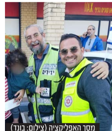
מסך האפליקציה

בארות יצחק: תינוקת ננעלה בשגגה ברכב, מתנדב ידידים חילץ אותה בשלום • "השתחררתי ממילואים, קיבלתי טלפון מהבן שיוצא לראשונה מעזה, ואז טלפון לצאת ולחלץ"