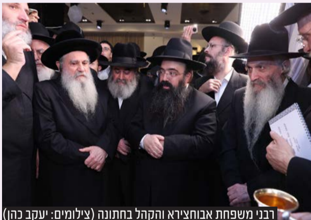
רבני משפחת אבוחצירא והקהל בחתונה