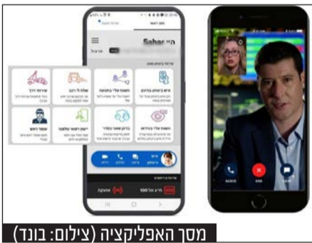
מסך האפליקציה

הפיילוט שהגיע לסימום בימים האחרונים נחל תשעים וחמישה אחוזי הצלחה בקרב המשתתפים • 88% הצהירו כי השירות העצים את תחושת בטחונם האישי