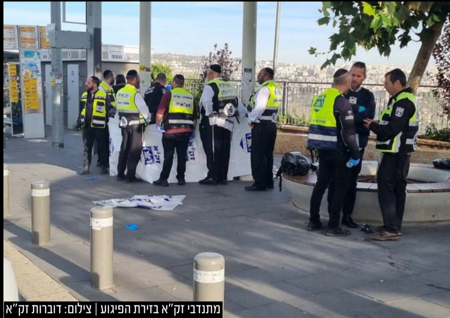
מתנדבי זק"א בזירת הפיגוע