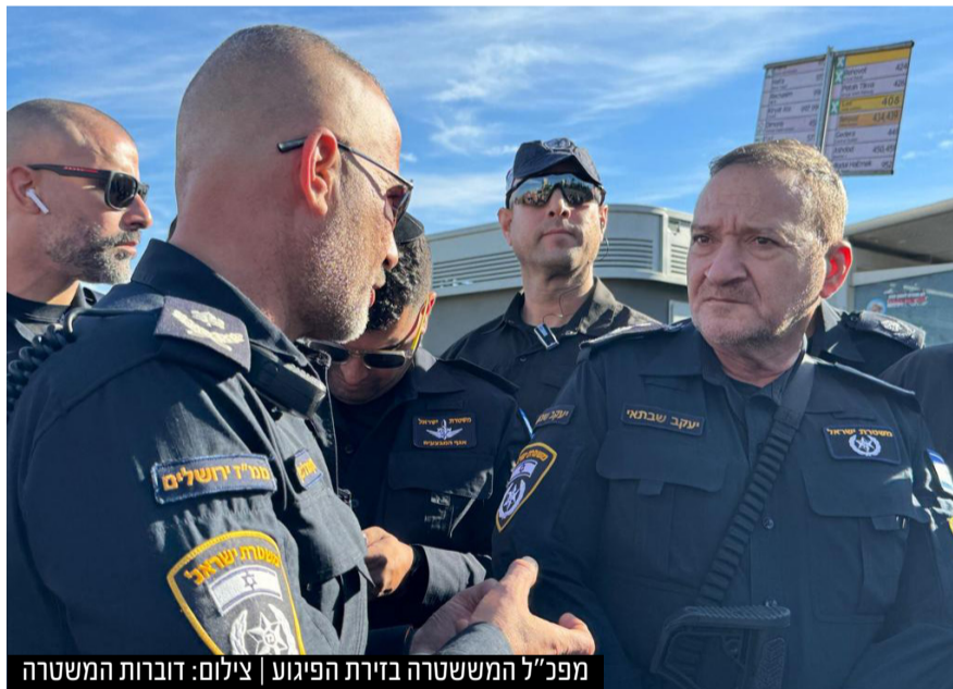
מפכ"ל המשטרה בזירת הפיגוע | צילום: דוברות המשטרה

ולנו לא נותר אלא לזעוק מעומק לב: קרב לנו קץ הישועה - במהרה.