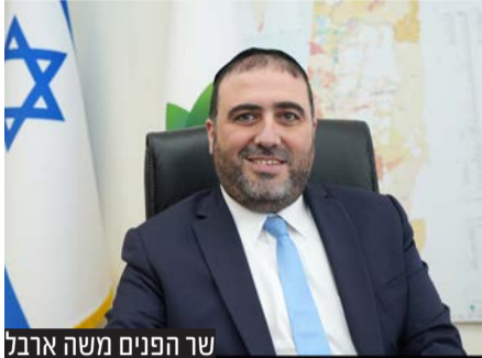
שר הפנים משה ארבל

שר הפנים משה ארבל הודיע: יש תאריך לבחירות לרשויות המקומיות | הכל על החזרה לריצה לרשויות המקומיות והמקומות בהם לא ייערכו בחירות לעת עתה