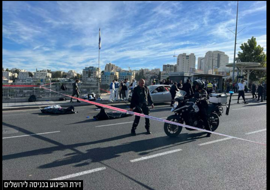
זירת הפיגוע בכניסה לירושלים