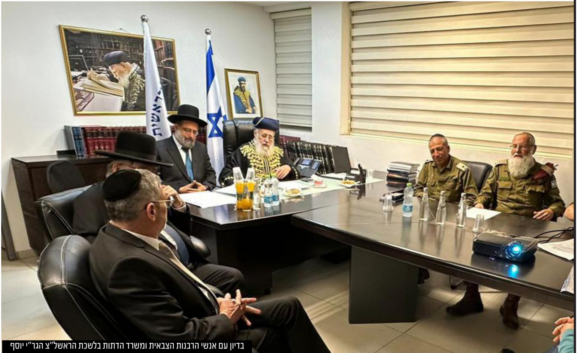
בדיון עם אנשי הרבנות הצבאית ומשרד הדתות בלשכת הראשון לציון הגר"י יוסף

נדמה שלא רק קריסת הקונספציה מחברת בין מלחמת יום הכיפורים ב-1973 לטבח שמחת תורה - גם הסוגיות ההלכתיות שהונחו על שולחנם של פוסקי ההלכה זהות: חמישים שנה לאחר שאביו מרן הגר"ע יוסף זצ"ל הקים בית דין מיוחד לעגונות של חללי מלחמת יום הכיפורים, מצא עצמו בנו הראשון לציון הגר"י יוסף שליט"א מתמודד עם הסוגיא הרגישה וכבדת המשקל כדי להתמודד עם סוגיית עגינותן של חללי המלחמה הנוכחית • שר הדתות מיכאל מלכיאלי שהשתתף בדיונים הדרמטיים והמורכבים מספר בראיון מיוחד על הנעשה מאחורי הקלעים