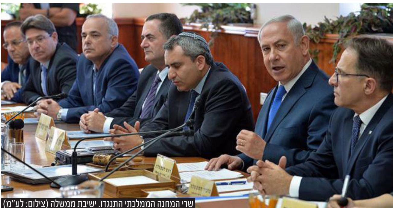
שרי המחנה הממלכתי התנגדו. ישיבת ממשלה