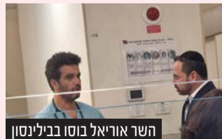
השר אוריאל בוסו בבילינסון

לביקור פתע בבית החולים בלינסון כדי לעמוד מקרוב על העומס בחדר המיון ועל עבודת הצוות הרפואי בימי החורף והשפעותיהם הרפואיות בנוסף לעומס שנוצר מהמלחמה. השר בוסו שוחח עם הרופאים והאחיות, שיבח אותם על מסירותם והם הדדו לו על הביקור וההתעניינות.