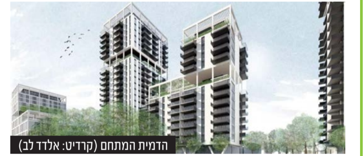
הדמית המתחם