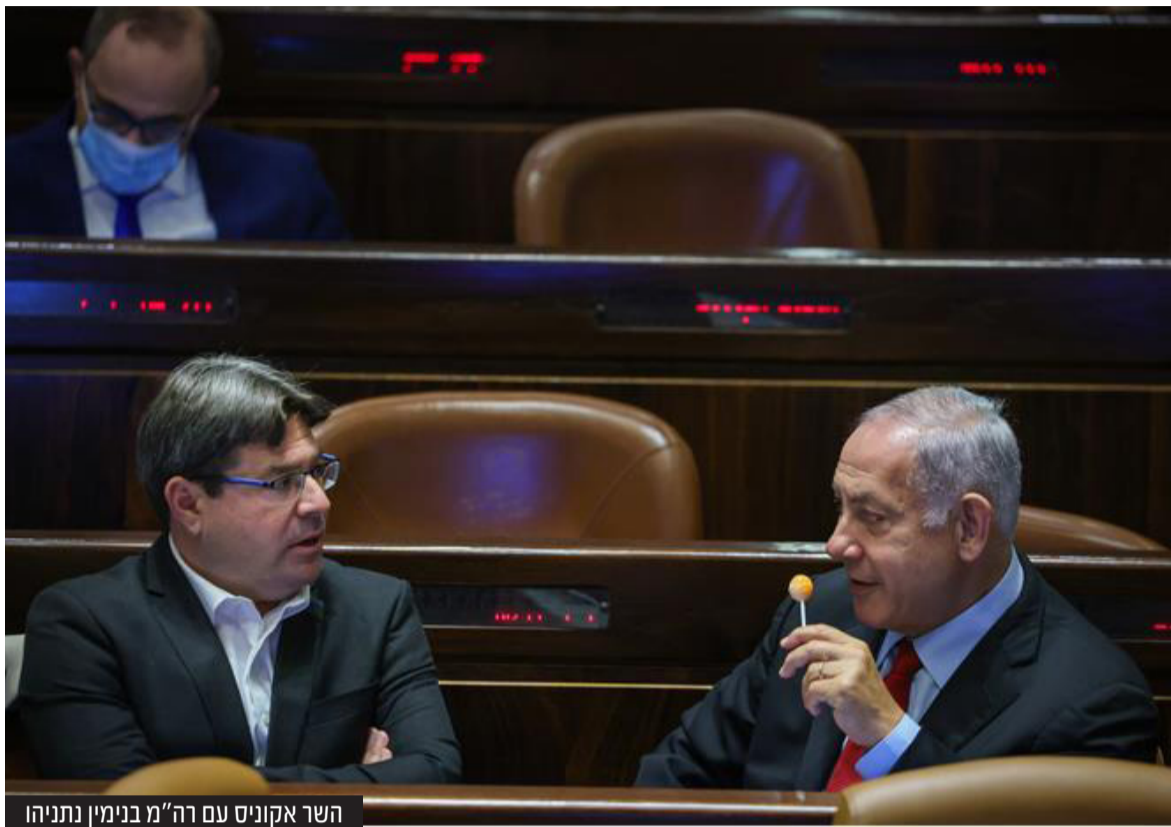
השר אקוניס עם רה"מ בנימין נתניהו

"במהלך המלחמה הודענו על 517 זוכים במלגות המילואים של המשרד ואני פועל להגדלת מספר המלגות בשנת 2024, על בסיס הרעיון עליו דיברתי בממשלה: מי שתורם יותר מקבל יותר. כפי שהתחייבתי בעת ביקורי התנחומים אצל המשפחות השכולות בפקיעין ובבית ג'אן הודעתי על השקת מלגה לאחינו בני העדה הדרוזית שלוחמים בצה"ל ומגנים יחד איתנו על הבית של כולנו. ברית אחים, ברית חיים".