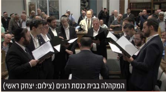
המקהלה בבית כנסת רננים

בכפם אבל בזכותם של קדושי השואה שלא היה מי שיגן עליהם ולא היה להם בית לשוב אליו הוקמה מדינת ישראל שיצאה למלחמת חורמה נגד הנאצים בעזה ובצ"ח ננצח גם אותם."