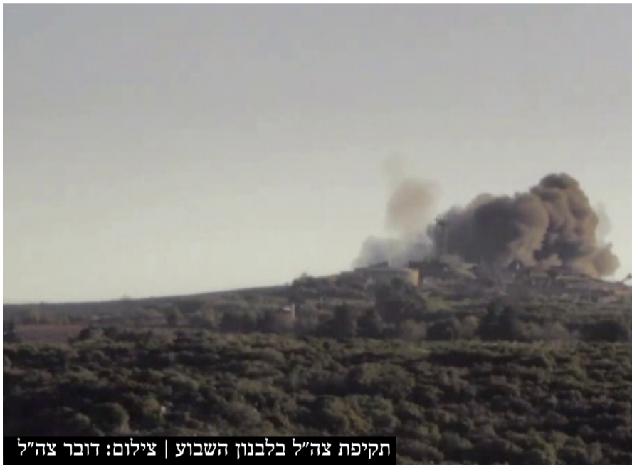
תקיפת צה"ל בלבנון השבוע

תושבי הצפון כמוכּוּן חוששים לחזור לבתיהם ונכון להיום רבים מהם שוהים בבתי מלון ברחבי הארץ כאשר הם אינם יודעים מה ילד יום.