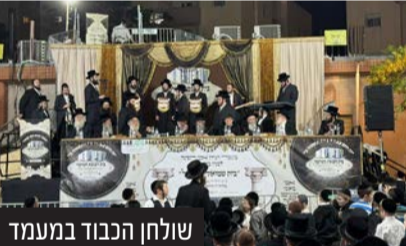
שולחן הכבוד במעמד