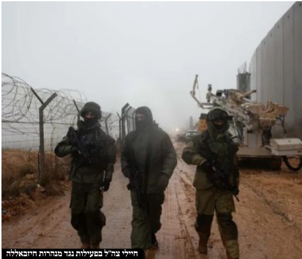
חיילי צה"ל בפעילות נגד מנהרות חיזבאללה

מחקר מקיף טוען כי לחיזבאללה רשת מנהרות בהן יכולות ליסוע גם משאיות • 'ארץ המנהרות' של חיזבאללה כוללות לא רק מנהרות לצורכי תקיפה, כי אם גם מנהרות פיקוד ותחבורה