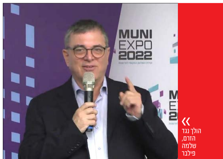
הולך נגד הזרם, שלמה פילבר

בשלב הזה, נראה שגם בן גביר וגם סמוטריץ' מבינים את המלכודת שעשויה לגרום את כולם בטעות לבחירות לא מתוכננות. שניהם גם מבינים שמנדט יותר או פחות לא יועילו להם מהאופוזיציה, ולפיכך הם נוהרים ומעקרים את דבריהם כמעט בתוך כדי דיבור. הראשון מסרב להציב דד ליין של ממש לאותו יעד של "הליכה עד הסוף" שהוא דורש וגם מתחמק מלהגדיר במדויק את הנדרש מבחינתו. השני בוחר מראש להתעסק בסוגיות של היום שאחרי, כאלו שבלאו הכי יעלו בתום שנת 2024