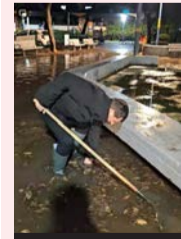
ראש העיר בשטח