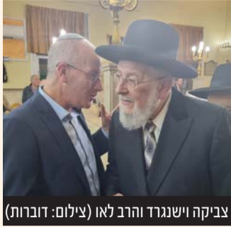
צביקה וישנגרד והרב לאו

לרגל יום הקדיש הכללי שחל בעשרה בטבת התקיימו אירועים בבתי הכנסת השונים ביוזמת האגף לתרבות יהודית בעיריית פ"ת