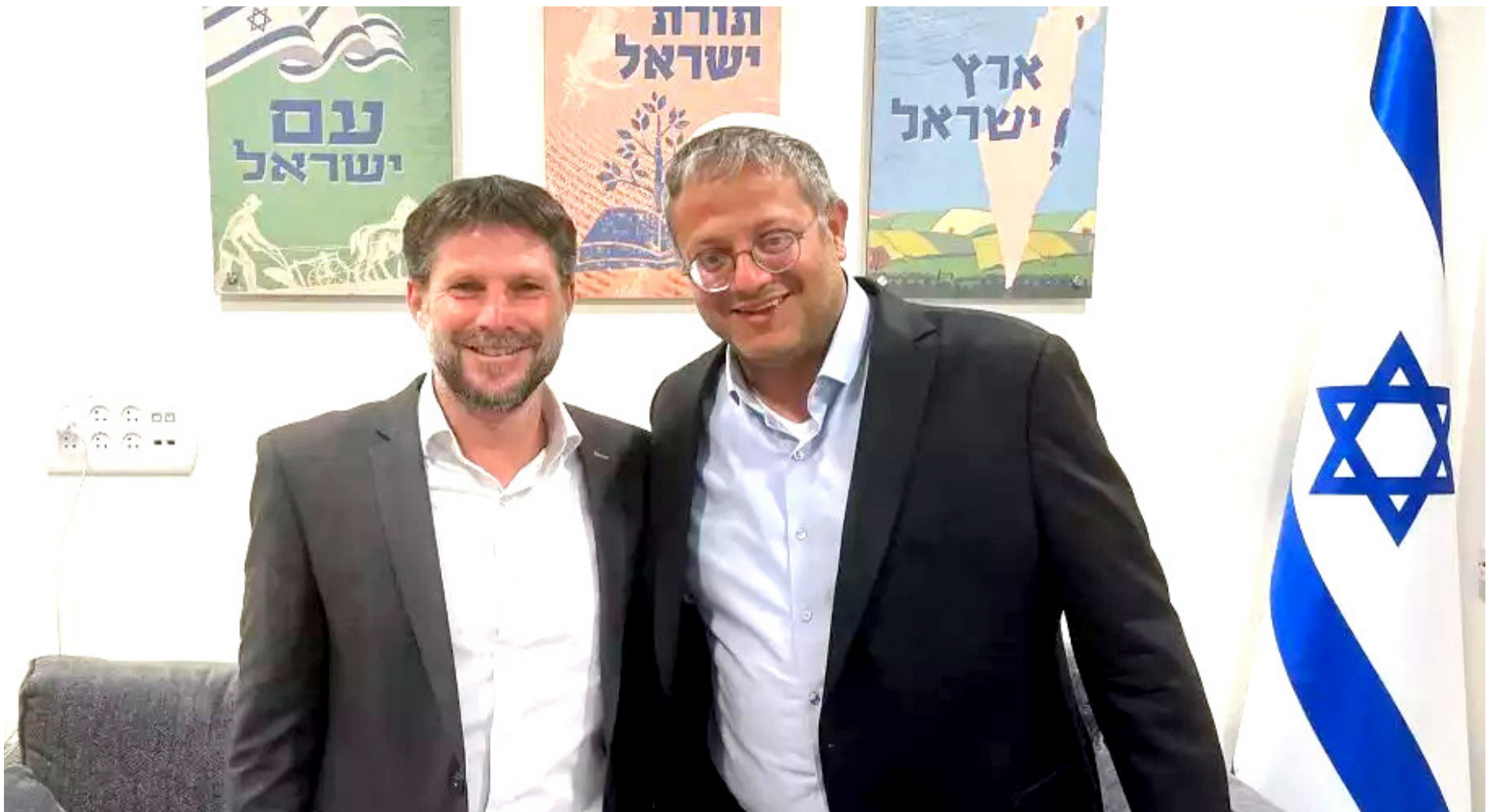
ימין שמאגף את הימין. שרי האוצר והביטחון הלאומי