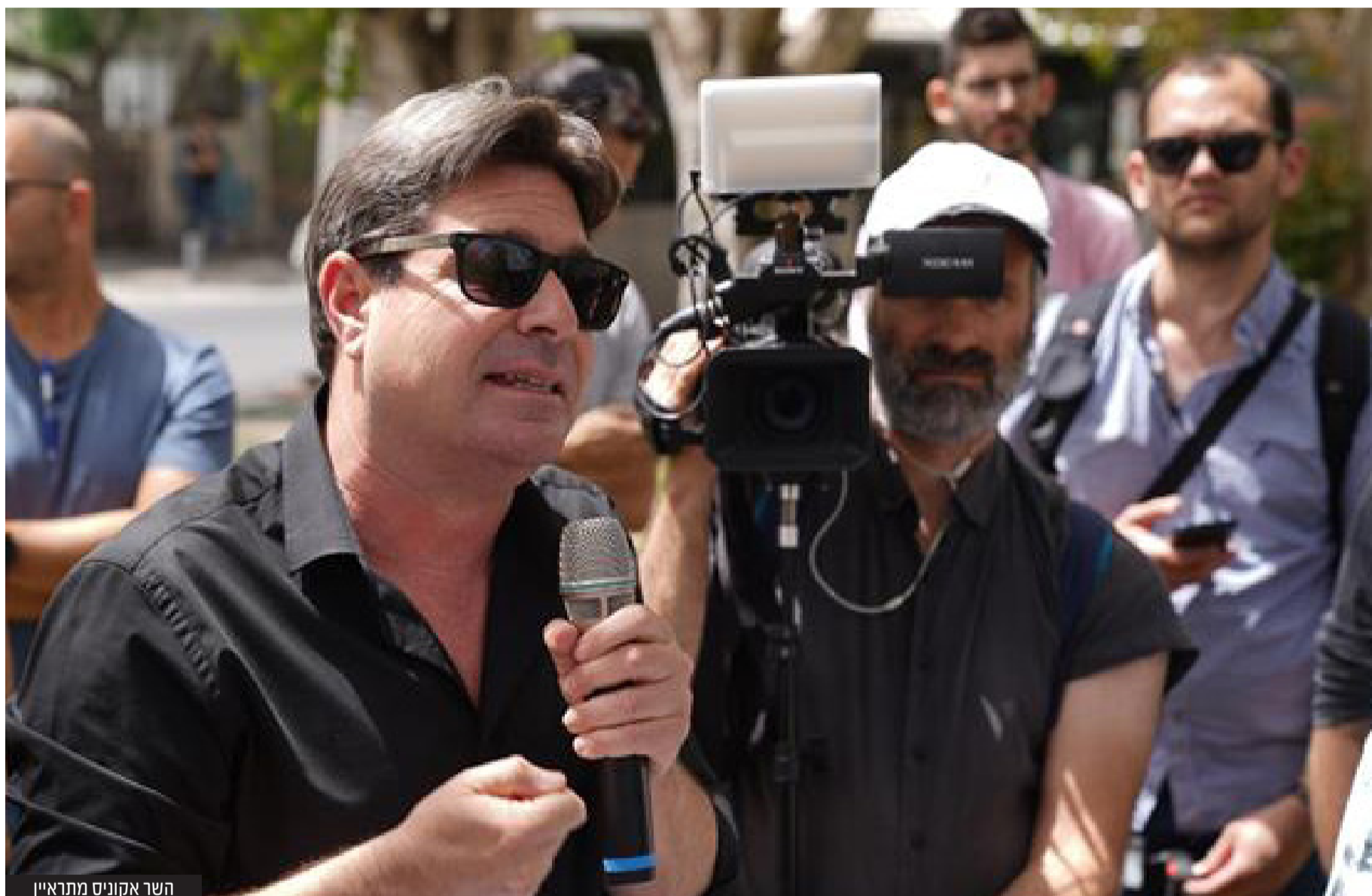
השר אקוניס מתראיין

"הקונספציות הישנות קרסו. תפיסות עולם של עשרות שנים התנפצו אל סלע המציאות", אומר שר המדע אופיר אקוניס בראיון • "אחרי המלחמה תקום ועדת חקירה ממלכתית, זה צורך חיוני. דעתי היא שהמנדט שלה צריך להיות בדיקה מקיפה. שתתחיל בהתנתקות ותימשך עד פריצת הגבולות בשש וחצי בבוקר בשבת השחורה" • "כשיחזרו תושבי העוטף לישובים המתחדשים לא יהיה עוד איום של כוח צבאי על הגדרות"