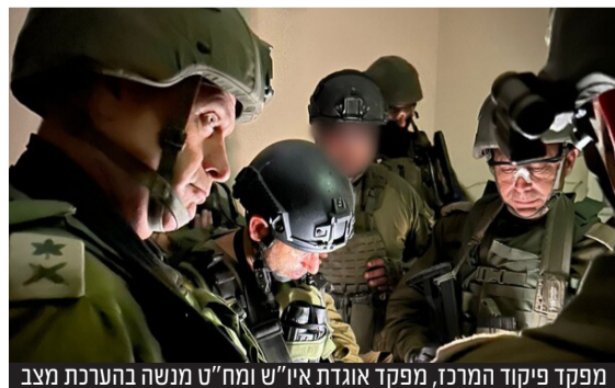
מפקד פיקוד המרכז, מפקד אוגדת איו"ש ומח"ט מנשה בהערכת מצב

גורמים המעוררים בנעשה באיו"ש מספרים כי הצבא והשב"כ מודעים להודעות הסתה כאלה ואחרות, בהן