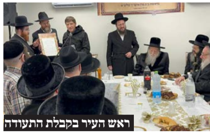
ראש העיר בקבלת התעודה