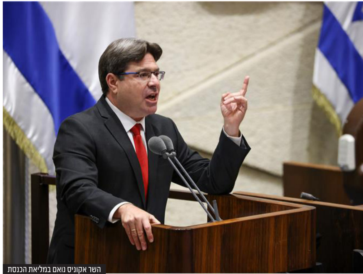
השר אקוניס נואם במליאת הכנסת

הבעת התנגדות לתת לרשות הפלסטינית לשלוט בעזה, מה האלטרנטיבה שלך?