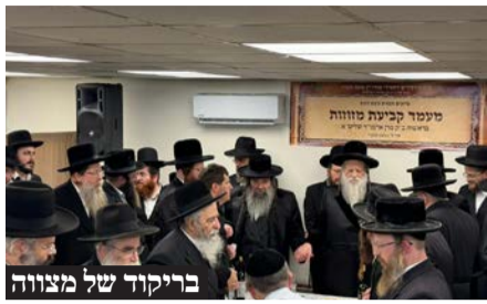
בריקור של מצווה

האדמו"ר העניק לראש העיר סידור מהודר ותעודת הוקרה