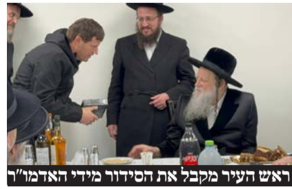
ראש העיר מקבל את הסידור מידי האדמו"ר