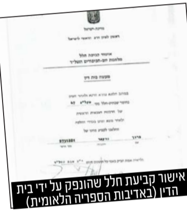
אישור קביעת חלל שהופק על ידי בית הדין

עד כה, ממידע שהגיע ל'קו עיתונות', מאמצים מרוכזים אלה הובילו להכרזה על חמישה חללים אזרחיים, בתוכם ההכרזה על אל"מ אסף חממי כחלל. חממי נפל על פי הממצאים כבר בשבת בה התבצע