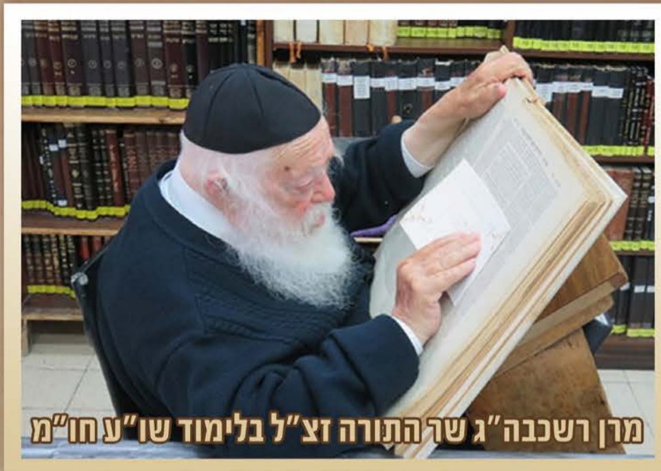
מרן רשכבה "גשר התורה זצ"ל בלימוד שו"ע חו"מ