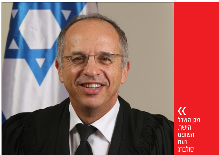
« מגן השכל הישר. השופט נעם סולברג

נקודת הזכות היחידה שניתן ללמד על חיות וחבריה בעניין הטיימינג של הפרסום, נובעת מהעובדה שלראשונה בהיסטוריה, הודלפה טיוטה מוקדמת של דעות השופטים. מישהו צריך להסביר לכבודם, שאם הם בוחרים לשחק בזירה הפוליטית, הם צריכים להתרגל גם להיבטים אחרים של הפוליטיקה, ובכלל זה הדלפות לעיתונות וסכינאות מחוכמת. יודעי דבר מספרים על חשדנות מופלגת בין לשכות השופטים ועל טיוטות שעוברות מיד ליד בסודיות או פשע, תלוי בנקודת המבט