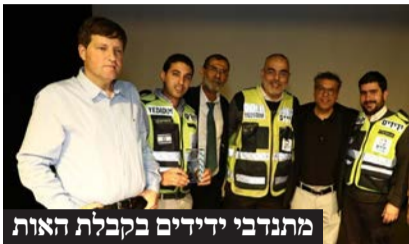
מתנדבי ידידים בקבלת האות