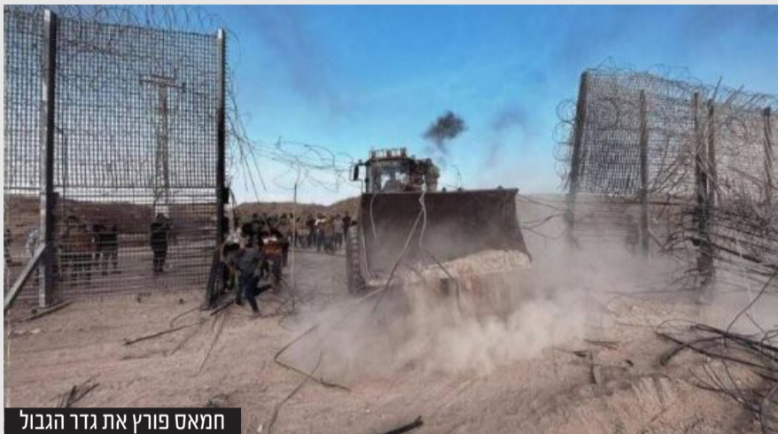
חמאס פורץ את גדר הגבול

על פי התחקיר, באופן אבסורדי למדי, טייסים שהונקו במסוקי קרב נעזרו בדיווחי