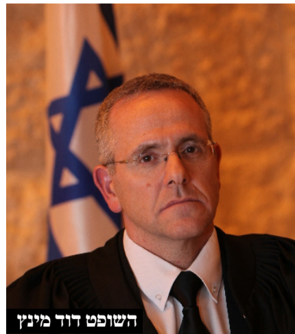
השופט דוד מיניץ