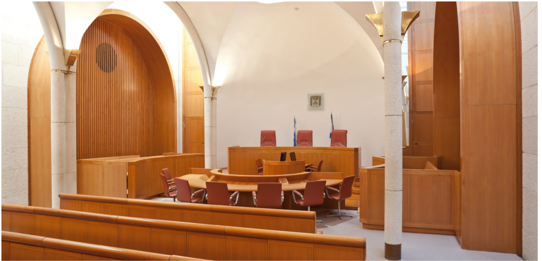
קץ הדמוקרטיה בישראל. מגדל השן של הפרלמנט החדש

ואלי כהן במשרדי האנרגיה והחופץ, ולדחות את מועד קיומן של הבחירות המקומיות בחודש נוסף, לתאריך י"ח באדר א', לפחות בינתיים. היה מי שטרח לציין כי בסוף השבוע מלאה שנה לכהונתה של הממשלה, היה גם מי שזכר ב'נבואתו' של יאיר לפיד, שהותיר במשרד ראש הממשלה פתק ובו הצהיר על כוונתו לשוב ב-2024. לפיד אולי לא ישוב לאקווריום, אבל בחירות בשנה הקרובה נראות כמו אירוע שעשוי להתגשם.