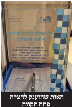
האות שהוענק להצלה פתח תקווה

התושבים. אנו נמשיך לתמוך בארגונים השונים ולסייע להם בפעילותם החשובה.