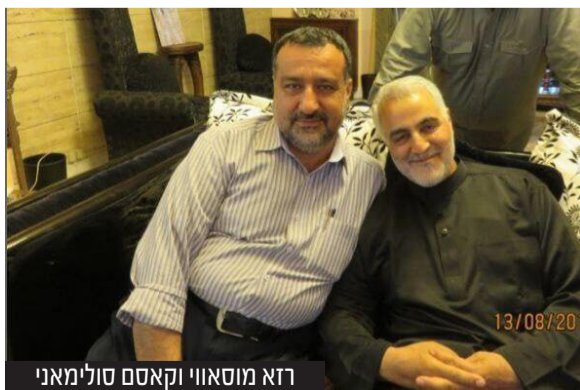
רזא מוסאווי וקאסם סולימאני