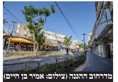
מדרחוב ההגנה