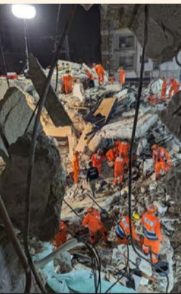
מתנדבי יחידת החילוץ בתרגיל

בתרגיל אותו הובילה חברת 'מגן' יחד עם יחידת החילוץ וההצלה בעיר, אותרו "דיירים שנפגעו", נפתח מתקן קליטה למפונים ועוד