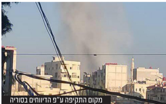
מקום התקיפה ע"פ הדיווחים בסוריה

בפתח הדיון אמר גלנט: "אנחנו נמצאים במלחמה רב זירתית, אנחנו מותקפים משבע גזרות שונות: עזה, לבנון, סוריה, איו"ש, עיראק, תימן ואיראן. הגבנו ופעלנו כבר בשש מתוך הגזרות האלה, ואני אומר כאן בצורה המפורשת ביותר - כל מי שפועל נגדנו הוא מטרה פוטנציאלית, אין חסינות לאף אחד". מעבר לדבריו, נראה כי לעולם לא נדע מי באמת תוקף מטרות טרור בחו"ל.