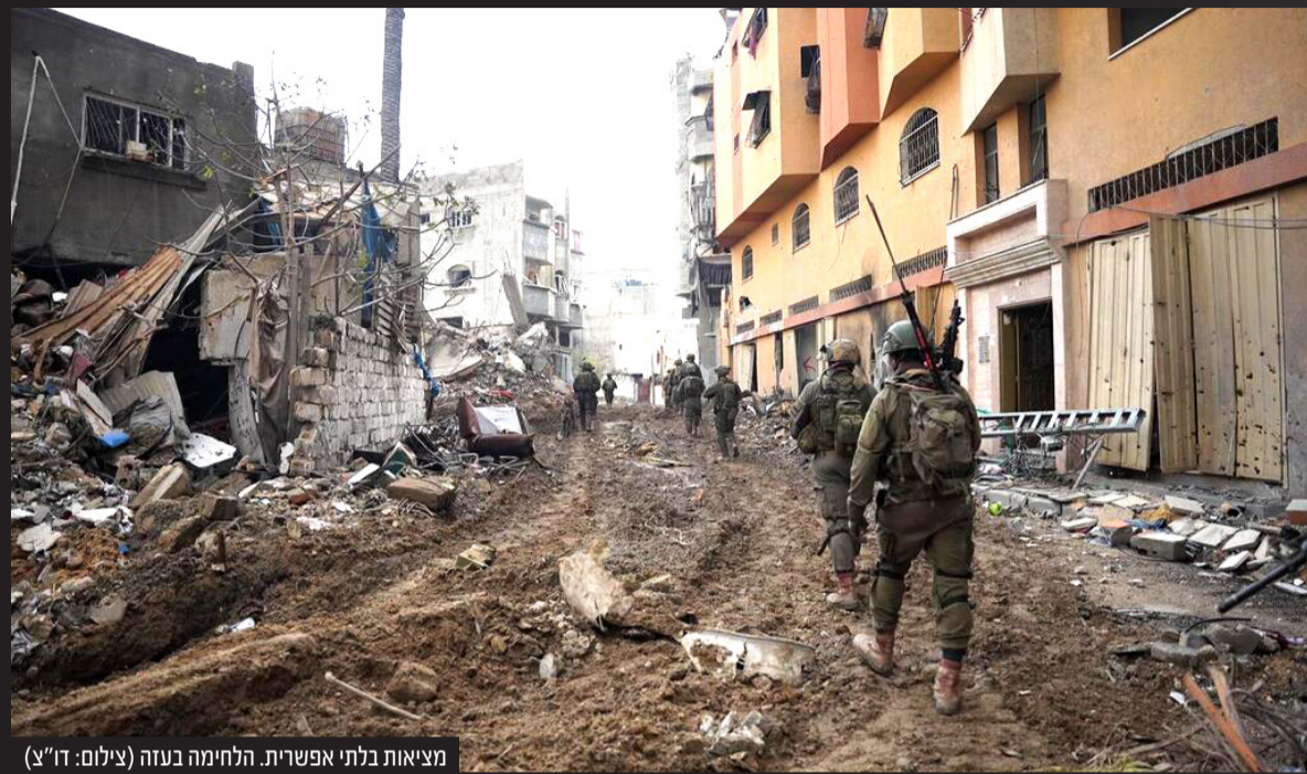
מציאות בלתי אפשרית. הלחימה בעזה

ממסקנות התחקיר על מותם של שלושת החטופים הישראליים עולה כי הכוחות ידעו שייתכן שיהיו חטופים במרחב אך "לא הייתה מודעות מספיק" • בד בבד ללקיחת האחריות המלאה, הסביר הרמטכ"ל כי הוא מבין לחלוטין את הלוחמים המחרפים את נפשם במרחב לחימה מסוכן ובמקביל חודדו הנהלים למניעת ירי על חטופים • מסקנות התחקיר המלא והמסר המאחד והמעצים של אם החטוף