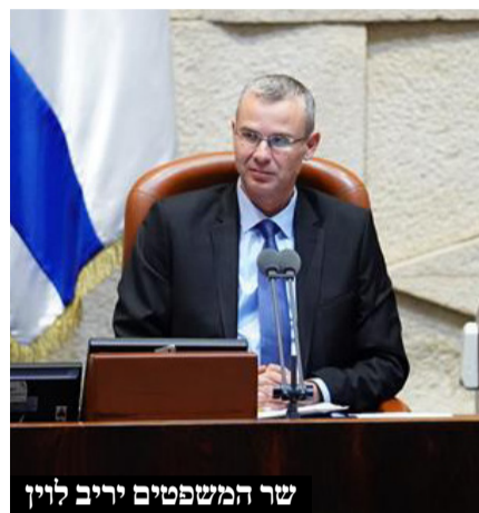
שר המשפטים יריב לוין

ולפסול גם חוקי יסוד. "אין אמירה ברורה יותר לכל מחרבי ומהרסי הדמוקרטיה. הדמוקרטיה הישראלית לא תותר. עילת הסבירות תהיה חלק ממנה. ישראל היא לא דיקטטורה".