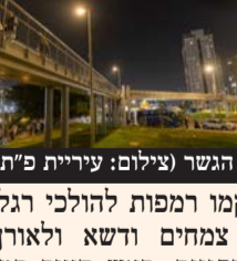
הגשר