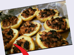
גראטן תפוחי אדמה בקראסט תפוצ'יפס קראנץ' / חלבי:

מערבבים היטב בקערה את חומרי הרוטב: חמאה, שמנת, שום, פפריקה ואבקת בצל. מסדרים מחצית מתפוחי האדמה על גבי התבנית ומפזרים מעל 2/3 מכמות הגבינה הצהובה. מסדרים מעל את שאר תפוחי האדמה ויוצקים את רוטב השמנת. מכסים היטב בנייד כסף ואופים. לאחר כשעה מוציאים את התבנית ומעלים את חום התנור ל-220 מעלות. מרסקים את התפוצ'יפס לחתיכות בינוניות, מפזרים מחצית מכמות הגבינה הנוותרת על גבי התפודים, מעליהם את שבבי התפוצ'יפס ומכסים בשארית הגבינה. מחזירים לתנור ללא כיסוי למשך 10 דקות עד שהגבינה מבעבעת. מגישים חם אל השולחן, הנהיג מגראטן משובח וקוצרים מחמאות.