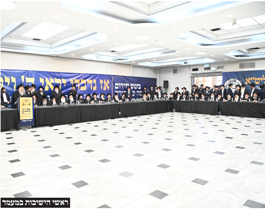
ראשי הישיבות במעמד