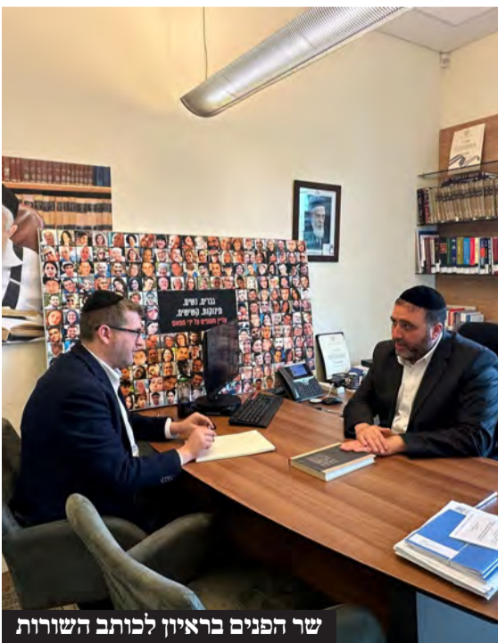
שר הפנים בראיון לכותב השורות

"אם נרצה התשובה היא כן. השאלה עוד לפני זה אם אנחנו נמצאים באירוע שמכיר לעומק את האתגרים ההסתגלותיים שיש ביחס לאוכלוסיות האלו. למה ברור לכולנו שכשיש אירוע של אוכלוסיות של מיעוטים אחרים שצריכים לפנות מאיזו אדמת מדינה, אז מנהלים איתם שיח ושומעים את המורכבות ומבינים, ובסוגיה הזו זה נתפס כתהליך טכני שמבקש הכתבה מלמעלה? ברור שפסיקת בג"ץ בצו הביניים הזה, המשמעות