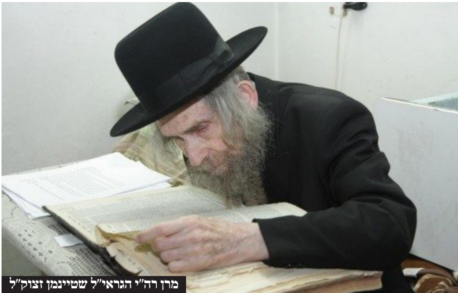
מרן רה"י הגראי"ל שטיינמן זצוק"ל