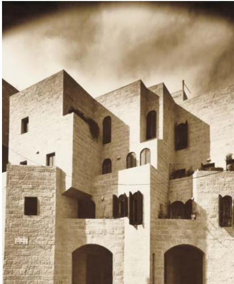
מבנה מגורים מעל לקארדו, המשלב שימור ובנייה חדשה, בתכנון אדריכל קלמן כץ

"אנו עמלים בתוקפה הזאת על הקמת המעלית שתוביל מהרובע ישירות לכותל. מדובר בפרויקט ענק שמושקע בו מיליונים רבים. המעלית תקצר את כל העלייה והמדרגות מהרובע לכותל". מילר מאחל לנו ולכל הקוראים חג פסח כשר ושמח ואנו פונים כל אחד לדרכו, מסתכלים סביבנו ברחבי העיר העתיקה וקולטים את המראות והאווירה, מהעבר להווה, בתפילה ובתקווה ל'חדש ימינו בקדם' במהרה.