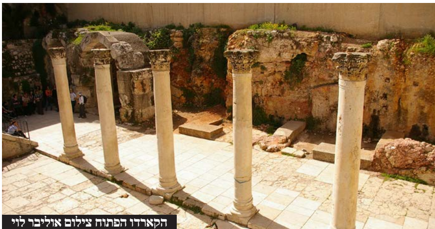
הקארדו הפתוח