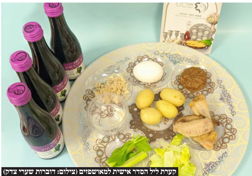
קערות ליל הסדר אישיות למאושפזים

מערך מוקפד של השגחה וכשרות מהדרין כל השנה ובמיוחד בפסח • כלל מוצרי המזון במטבח המרכזי בהכשר בד"צ העדה החרדית ללא קטניות ושרויה • המזון מוגש בכלים חד פעמיים • כלי הגשה חדשים לחלוטין • המטבח עובר הכשרה ע"י אברכים יר"ש • קערות ליל הסדר אישיות ומצות עבודת יד למאושפזים • ליל הסדר ייערך בכל המחלקות