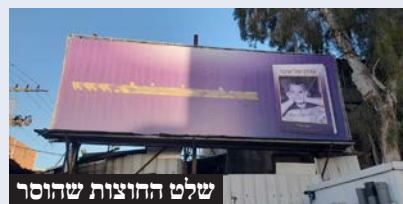
שלט החוצות שהוסר

תמימים. הוועדה היתה מרובה ואנשים אמרו שהם אינם מסוגלים להבין, איך מתרחש כזאת במדינה היהודית, אליה נקבצו צאצאיהם של יהודים מכל העולם, שמסרו נפשם על קדושת השם, מול השמד הנוצרי האלים והרצחני.