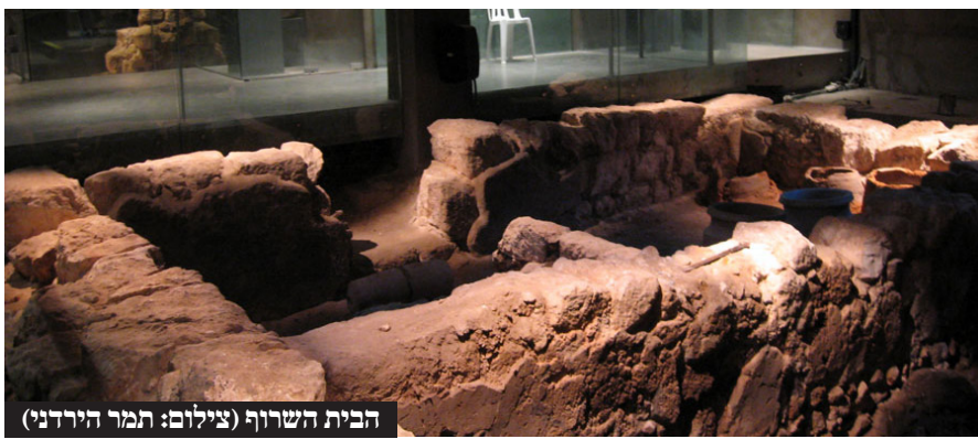
הבית השרוף