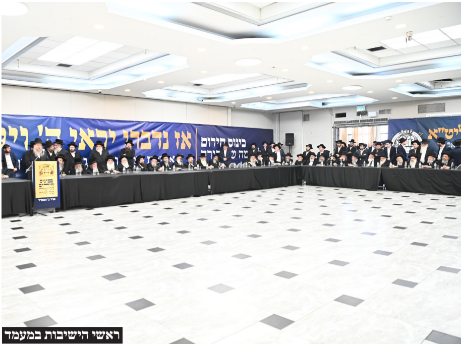
ראשי הישיבות במעמד