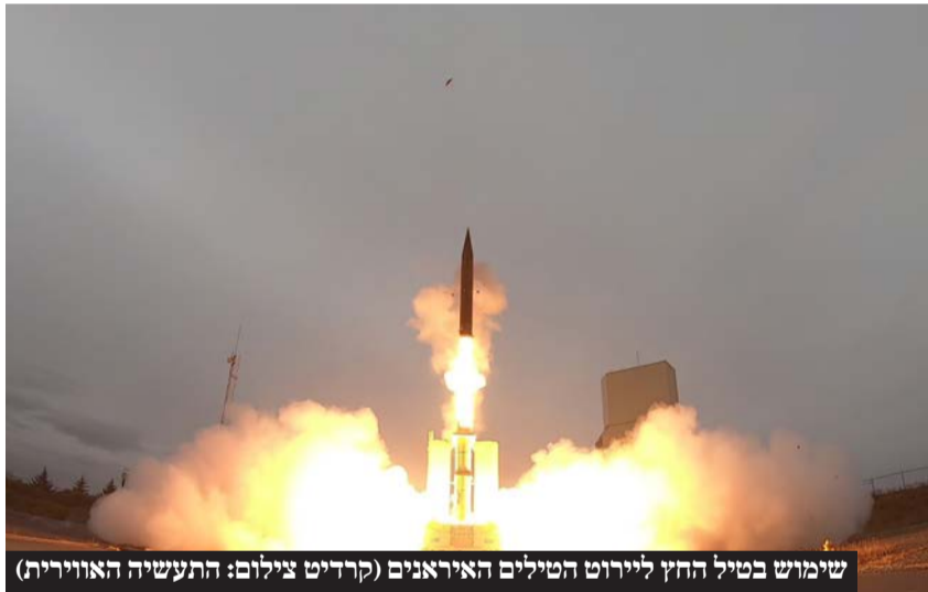
שימוש בטיל החץ ליירוט הטילים האיראנים