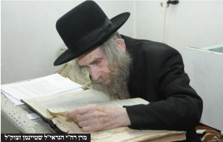
מרן רה"י הגראי"ל שטיינמן זצוק"ל