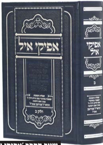
שער הספר 'אפיקי אייל'