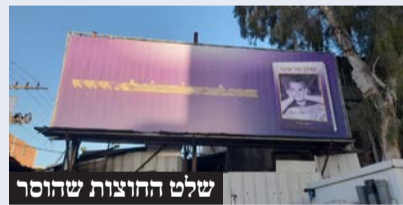
שלט החוצות שהוסר

תמימים. הוועדה היתה מרובה ואנשים אמרו שהם אינם מסוגלים להבין, איך מתרחש כזאת במדינה היהודית, אליה נקבצו צאצאיהם של יהודים מכל העולם, שמסרו נפשם על קדושת השם, מול השמד הנוצרי האלים והרצחני.