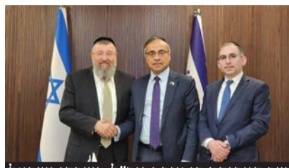
שר העבודה בן צור ומנכ"ל משרדו ישראל און עם שגריר הודו בישראל

במסגרת הפגישה דנו השניים על כ-10,000 עובדים חדשים שצפויים להגיע