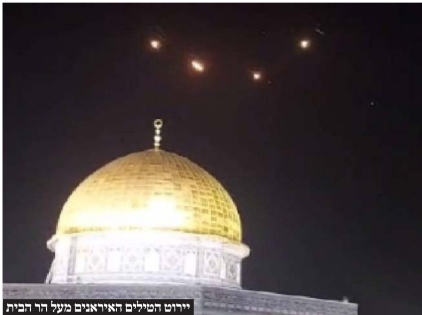
יירוט הטילים האיראנים מעל הר הבית