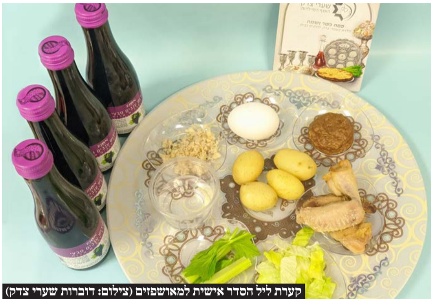
קערות ליל הסדר אישיות למאושפזים

מערך מוקפד של השגחה וכשרות מהדרין כל השנה ובמיוחד בפסח • כלל מוצרי המזון במטבח המרכזי בהכשר בד"צ העדה החרדית ללא קטניות ושרויה • המזון מוגש בכלים חד פעמיים • כלי הגשה חדשים לחלוטין • המטבח עובר הכשרה ע"י אברכים יר"ש • קערות ליל הסדר אישיות ומצות עבודת יד למאושפזים • ליל הסדר ייערך בכל המחלקות