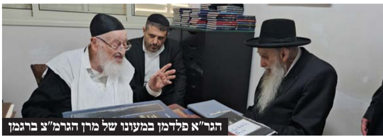
הגר"א פלדמן במעונו של מרן הגרמ"צ ברגמן

מרן ראש הישיבה הגרמ"צ ברגמן הציג בפני מרן הגר"א פלדמן את מכתבו מהשבוע שעבר. כשהגר"א פלדמן קורא את מכתבו של מרן שליט"א בקול במשך דקות ארוכות. שכשהוא אומר למרן שליט"א "אלו דבר אלוקים חיים". בתום הביקור אמר מרן הגר"א פלדמן למרן שליט"א, שהקב"ה יאריך ימיו ושנותיו ושיהיה לו כוחות להנהיג את כלל ישראל עד ביאת משיח. כמו כן נועד זקן חברי המועצת יחד עם מרן ראש הישיבה הגרמ"ה הירש במעונו שבגבעת סלבודקא.