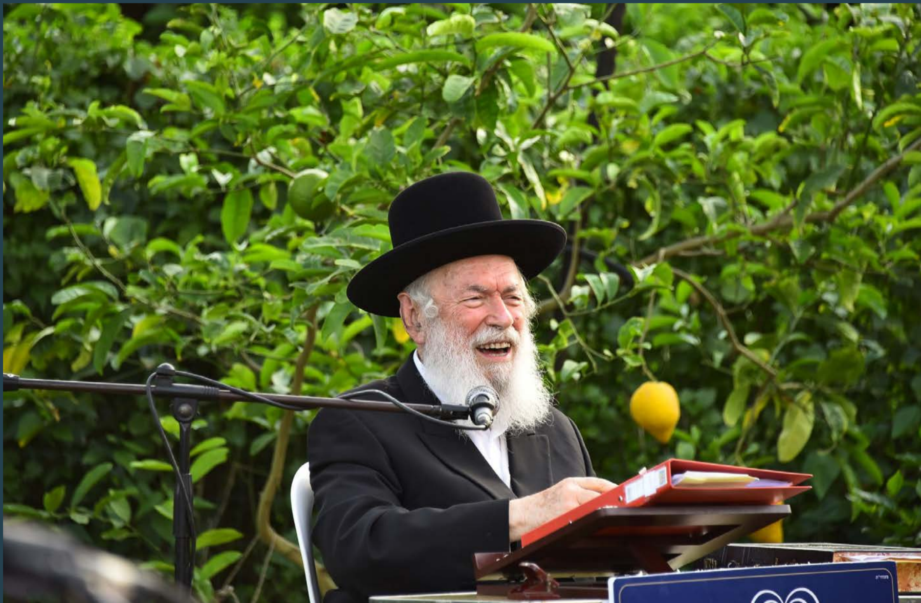
במציאות כל שליטה עליו.