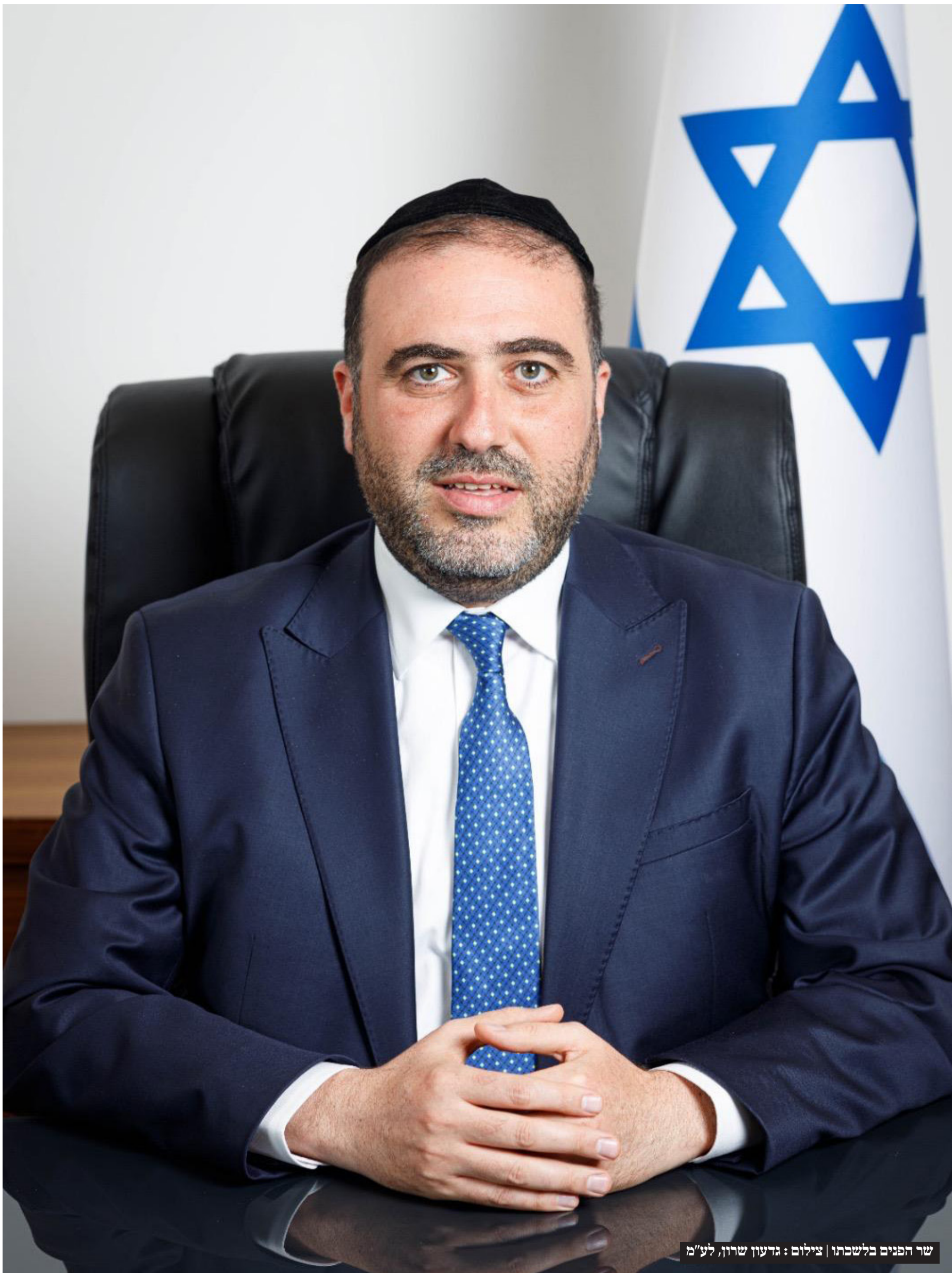
שר הפנים בלשכתו