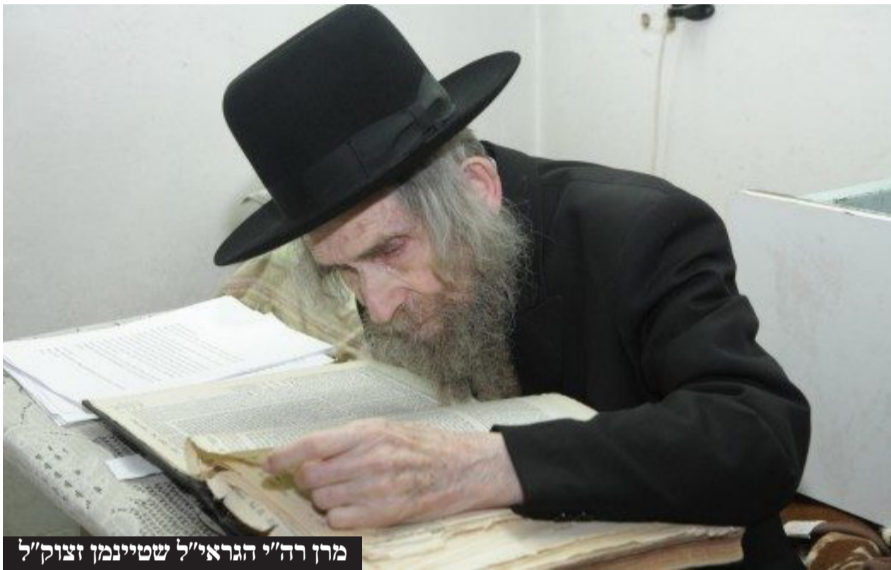
מרן רה"י הגראי"ל שטיינמן זצוק"ל