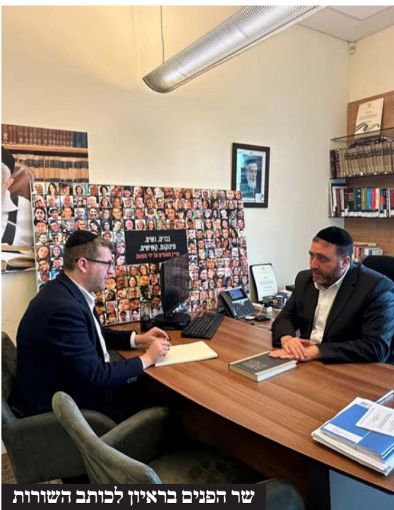
שר הפנים בראיון לכותב השורות

"אם נרצה התשובה היא כן. השאלה עוד לפני זה אם אנחנו נמצאים באירוע שמכיר לעומק את האתגרים ההסתגלותיים שיש ביחס לאוכלוסיות האלו. למה ברור לכולנו שכשיש אירוע של אוכלוסיות של מיעוטים אחרים שצריכים לפנות מאיזו אדמת מדינה, אז מנהלים איתם שיח ושומעים את המורכבות ומבינים, ובסוגיה הזו זה נתפס כתהליך טכני שמבקש הכתבה מלמעלה? ברור שפסיקת בג"ץ בצו הביניים הזה, המשמעות