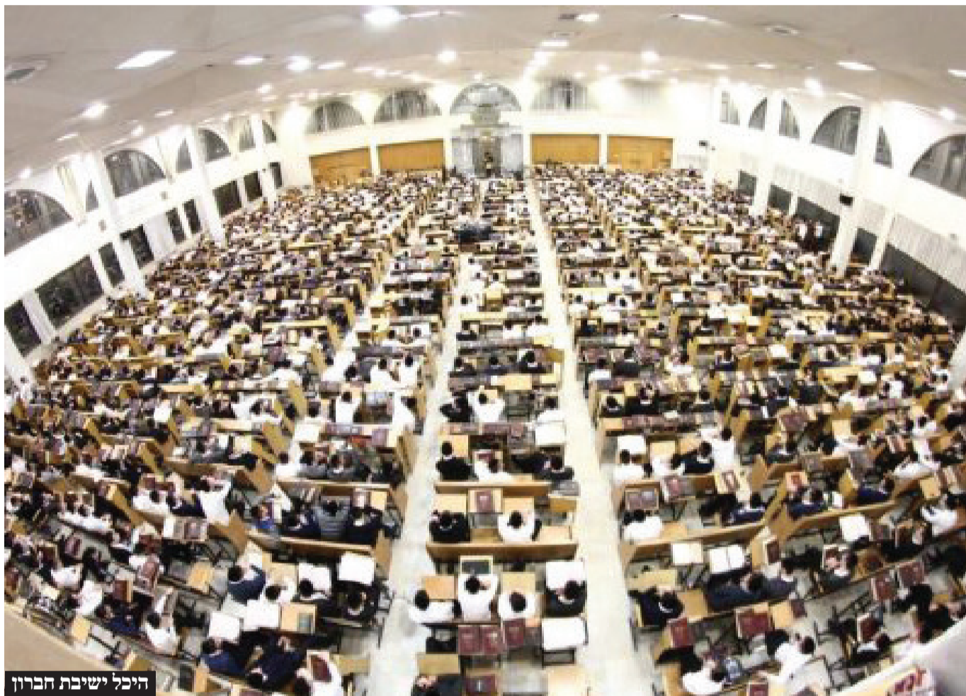
היכל ישיבת הברון

בעקבות החלטת בג"צ, פג תוקפה של הוראת השעה הממשלתית שאפשרה לדחות את גיוס תלמידי הישיבות והמדינה לא תעביר כספים לישיבות • ראש הממשלה בנימין נתניהו הבטיח לפצות על התקציבים שנעצרו, וכן לגייס את תמיכת חברי הכנסת של הליכוד בחוק הגיוס המתגבש • נתניהו: "דרוש עוד פרק זמן קצר לגיבוש סופי של ההסדר, ולהבטיח שאלו ש'תורתם אומנותם' יוכלו ללמוד תורה"