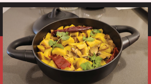
המתכון באדיבות: מירי חיון ובאדיבות המותג סולת

ארטישוק מבושל הוא תוספת חמה, אלגנטית, מענגת וטעימה לכל ארוחת ובכלל. הארטישוק משתלב עם כל מנה ואף עומד כמנה צמחונית בפני עצמה