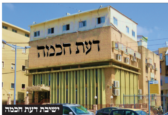
ישיבת דעת חכמה

שואה! ובאמת עשו את החיזוק בעולם הישיבות ובטלה הגזירה בשעתו. עתה שחם ושלום מנסים להחזירה אני מבקש ממכם ללמוד בתענית דיבור, אולם דורנו מספיק ללמוד רבע שעה ראשונה בכל סדר, וברור שאם יתחזקו בדעת חוכמה ובעוד ישיבות הגזירה תתבטל בעזרת השם. כמובן שהבחורים קיבלו על עצמם את הדברים להתחזק בהתמדה ללימוד התורה.