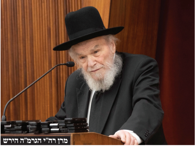
מִן הַגֵּר מ"ה הִירֵשׁ

בחודשים האחרונים לפיהן הציבור החרדי צריך "להיכנס תחת האלונקה ולשאת בנטל המלחמה" ואמר כי יש את "אלה שלא דווקא שונאים אותנו ואת הדת. רק שלא מאמינים ולא מבינים שהתורה זה מה שמציל אותם, שזה שארץ ישראל עדיין קיימת כשיש את כל השונאים מסביב זה רק בגלל שיש תורה בא"י הם לא מאמינים בזה רח"ל, ולכן הם אומרים אם ככה למה לא לנהוג שווה בשווה". לאחר שנגע בטענות הזהיר כי "בזה שמוותרים על התורה, כורתים את הגזע שהמדינה עומדת עליו". עם זאת הבהיר כי "יש שני סוגי אנשים בין אלו שדוחפים לבטל את העניין של התורה אצלנו וזה סוג אחד של אנשים" אך "יש סוגים אחרים שהם ממש רשעים, שלא אכפת להם בכלל מהשווה בשווה. הם שונאים את הדת. שונאים את התורה. שונאים את הבן תורה". כאן לראשונה מִן הַגֵּר שְׁלִיט"א הִתְיַחַס בְּפוּמְבֵי בֵּאֲשֶׁר לְעוֹבְדָה שֶׁבִּגְץ שֶׁפֶסַק בְּחוֹמַרְת יֵתַר עַל דְרִישׁוֹת הַיּוֹעֵצֵי מִשִּׁי"ת וְאֵף לְגוֹרְמִים פּוֹלִיטִיִּים עֲשׂוֹ הַכֹּל כְּדֵי לְהַפִּיל מֵתוֹוָה מוֹסָכֶם גַּם בִּמְחִיר שֶׁל הַפְּסָדִים פּוֹלִיטִי כְּשֹׁכְכָה"ג כּוֹנְנֵתוֹ לְגַדְעוֹן סַעַר שַׁע"פ סִירְבַּ לְהַסְכִּים לְמַתּוּוֹה גַּם בְּתַמּוּרָה לְצִרְוּפוֹ לְקַבִּינַט הַמַּלְחָמָה הַמְּצוּמָצֵם. "יש לזה הוכחות מיניה וביה ממה שקרה בימים האחרונים ואני לא רוצה להגיד את