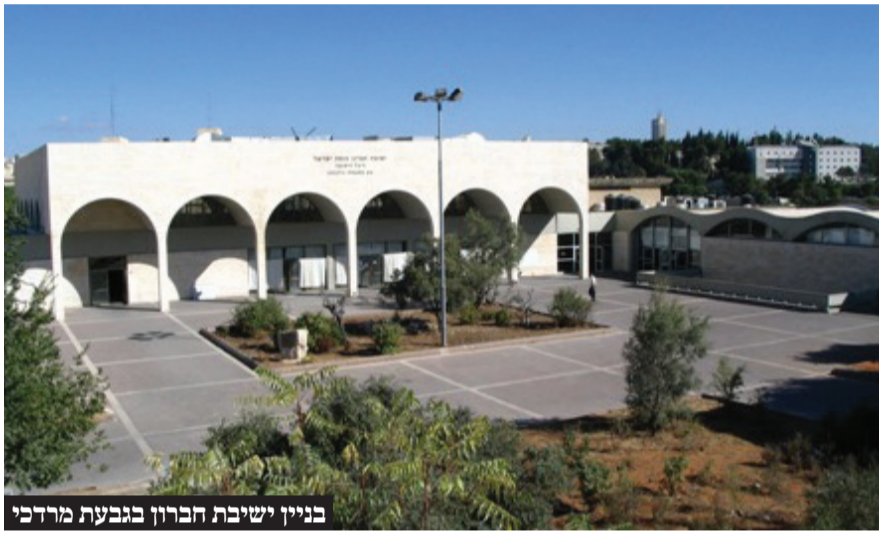
בניין ישיבת חברון בגבעת מרדכי

עסקנים העוסקים בתחום מצוקת הדיור במגזר החרדי: "הבניה לגובה היא זו שתאפשר לזוגות הצעירים להתגורר בקרבת מקום להיכלי הישיבות והחסידיות הגדולים בישראל ואין ספק שזהו הפתרון הברור למצוקת הדיור הקשה הקיימת ומרתחבת בכל הארץ"