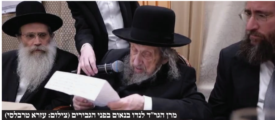
מִן הַגֵּר לַנְדוּ בְּנֵאוֹם בְּפִנֵּי הַגִּבּוֹרִים

דברים אלו הם המשך ישיר לדברים שנא מִן הַגֵּר לַנְדוּ בְּיוֹם חֲמִישֵׁי שַׁעֲבֵר שְׁעוֹת סְפוּרוֹת לְאַחַר פְּסִיקַת בִּג"צ. בְּדַבְרָיו שָׁנָא בְּכִינוּס קֶרֶן הַהֲסָעוֹת בְּבִנְיַן בְּרַק אָמַר מִן הַיִּשּׁוּבוֹת הַקְּדוּשׁוֹת וְהַכּוֹלְלִים, שְׁבֵהֶם הוֹגִים בְּתוֹרָה לֹא הֵרֵף וְלֹא הִפּוּגָה, הֵם זְכוֹת הַקִּיּוּם שֶׁלָּנוּ כֹּאֵן בְּאַרְץ, וְזֶה מֵה שְׁמַגֵּן עַל כָּל הַיְהוּדִים בְּאַרְץ יִשְׂרָאֵל מִכָּל צָרִיהֶם. וְכָל שִׁירְבוֹ לּוֹמְדֵי הַתּוֹרָה בְּיִשּׁוּבוֹת וְהַכּוֹלְלִים תְּרַבֵּה הַהֲגָנָה עַל כָּל יוֹשְׁבֵי הָאָרֶץ, וְחִלְלִיהָ לְהִיפֵךְ.