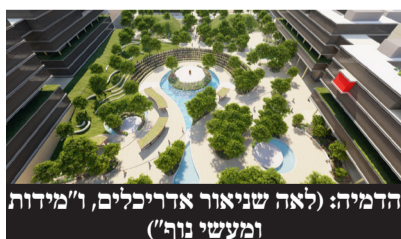
הדמייה: (לאה שניאור אדריכלים, ו"מידות ומעשי נוף")

האקדמי, המתחם יכיל גם מעונות לסטודנטים, בית ספר תיכון, מתקני ספורט ותרבות, בריכת שחיה, מגרשי חניה, מרפאות ציבוריות ועוד.