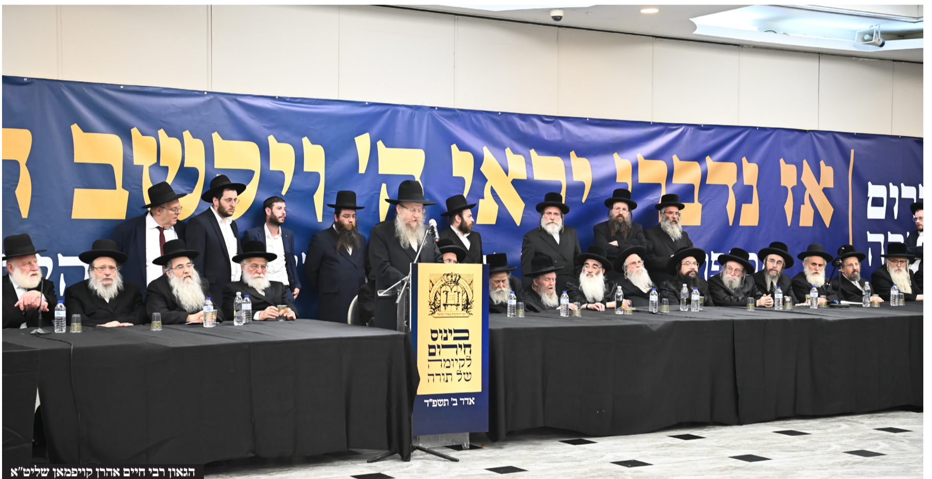
הגאון רבי חיים אהרן קויפמאן שליט"א

את התורה הלאה, וכשהקול קול יעקב אין אפשרות לפגוע בו, סך הכל מה שהם יכולים זה לנגוע בתמכין דאורייתא, ראשי הישיבות יש לנו קושי להשיג את התקציב, אבל עם קודש האברכים הצעירים לא צריכים אפילו לחשוב על זה, תמשיכו ללמוד תורה, אנחנו לומדים תורה, את מי הם מחרפים? אותנו? את הקב"ה הם מחרפים! הקב"ה ברא את העולם ללמוד תורה, ויתקיים בנו שבטך ומשענתך המה ינחמוני".