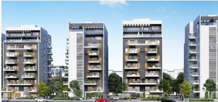
הדמיית הפרויקט (משרד האדריכלים CityBee)

שני בנייני בוטיק חדשים יחליפו ארבעה בנייני רכבת ותיקים, במסגרת פרויקט רחב היקף הכולל בניית שבעה בניינים חדשים ברחוב צלח שלום