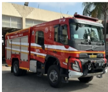
הכבאית החדשה

מול המלחמה המתמשכת ואירועי השגרה. רכבי הכיבוי החדשים יוצבו בתחנה הראשית ויתנו מענה מתקדם לאתגרים הרבים והמורכבים איתם מתמודדים במקצועיות לוחמי האש".