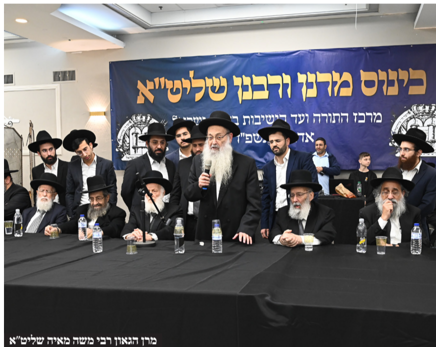
מרן הגאון רבי משה מאיה שליט"א

שומר בדבריו כי "המטרה שלהם על עמך יערימו סוד, הם לא מסתפקים שעם ישראל לא ילמד, הם לא צריכים את בני הישיבות בצבא שלהם, הם לא מעוניינים בכך, הם רוצים לנתק את עם ישראל מהקב"ה ולכלול אותו עם האומות רח"ל. והכוח שלנו הוא על ידי שנתאחד, זה הכוח הגדול ביותר שיש לעם ישראל." עם ישראל שלוחמים עבור ריבונו של עולם, עבור התורה, בוודאות, אם יהיה אחדות, כולם, כל העדות וכל החוגים וכולם ביחד, נהיה ביחד וכך לא יוכלו לעם ישראל. כמו כן עמד על החובה של בני התורה לשקוע בלימוד התורה בהתמסרות, שבכך יש קיום ללימוד התורה. את המעמד חתם בדברים הגאון רבי דוב לנדא שליט"א מראשי רבני חסידי גור, שאמר כי התורה היא קיום העולם, וכשאנו רואים שניתכות עלינו גזירות, מלחמה, הרצון לייבש את ים התורה, אנחנו צריכים להתחזק בלימוד התורה עם יראת שמים, ולהקים קול זעקה שתישמע למרחוק, כפי שגדולי ישראל יחליטו. בסיום דבריו הקריא את החלטות הכינוס כפי שנקבעו ע"י גדולי ישראל. המעמד המיוחד שבו התכנסו ראשי הישיבות, מרביצי ומוסרי התורה שבדור תחת קורת גג אחד, הותיר רושם כביר על המוני בית ישראל ששמעו של הכינוס המיוחד ודבריהם ומשאותיהם של גדולי הדור הגיעו לאזניהם, ותקוותם איתנה יחד עם כלל רבבות בני התורה ועמליה, כי כלל ישראל בארץ הקודש ימשיך להתקיים כצורתו וכתבניתו וכיחודו בקיומו של עולם התורה בלא שום שינוי.