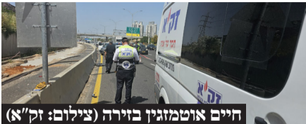
חיים אוטמזגין בזירה

תאונת פגע וברח בין רכב מסחרי לרוכב אופניים גרמה למותו של גבר כבן 40 • המשטרה עצרה לחקירה את הנהג הפוגע