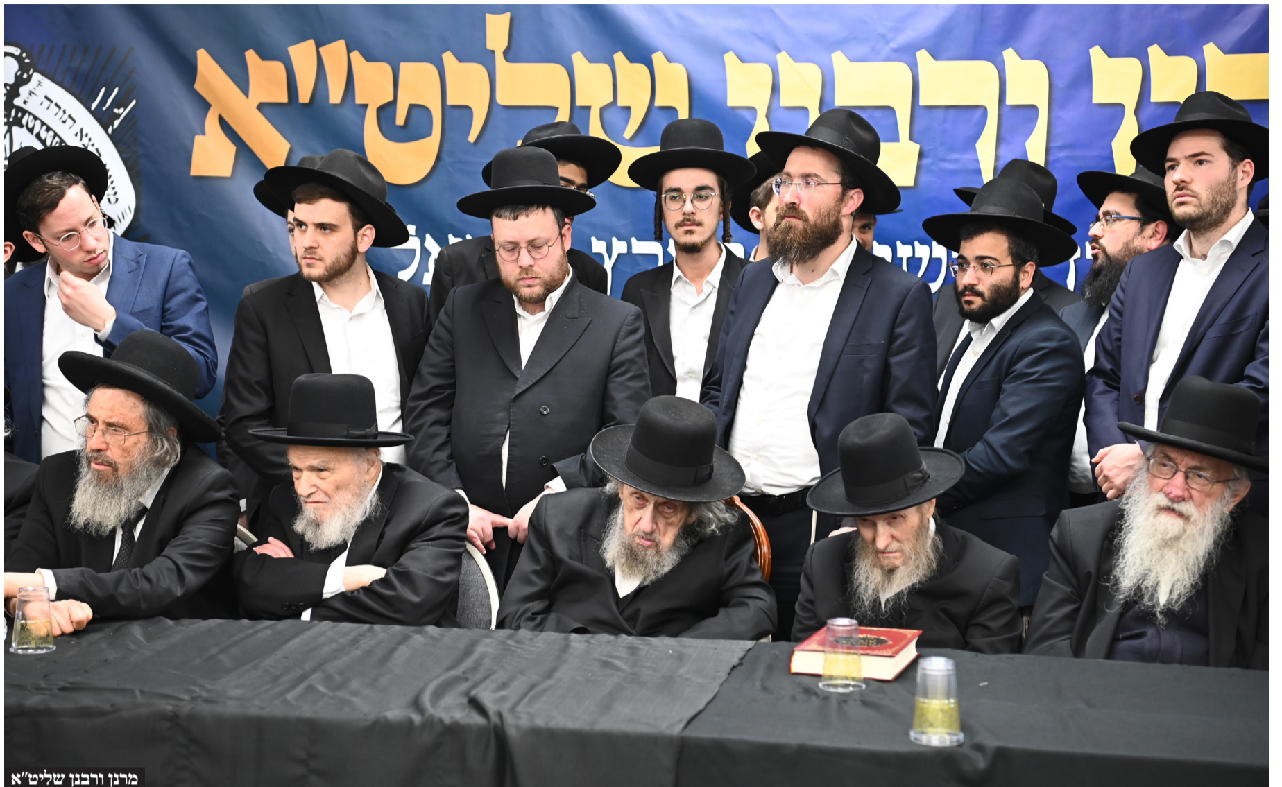
מרנן ורבנן שליט"א