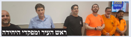
ראש העיר ומפקדי היחידה