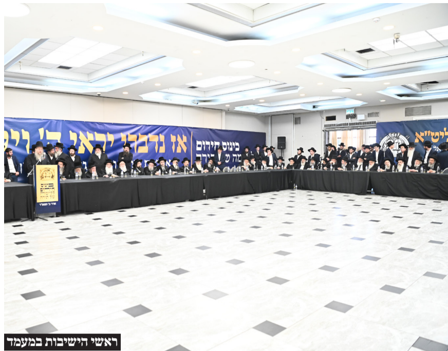
ראשי הישיבות במעמד