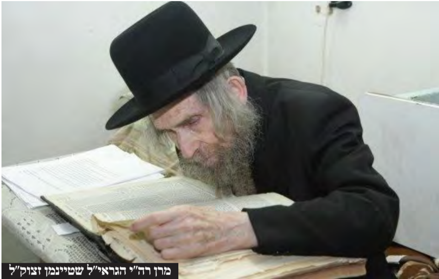
מרן רה"י הגראי"ל שטיינמן זצוק"ל