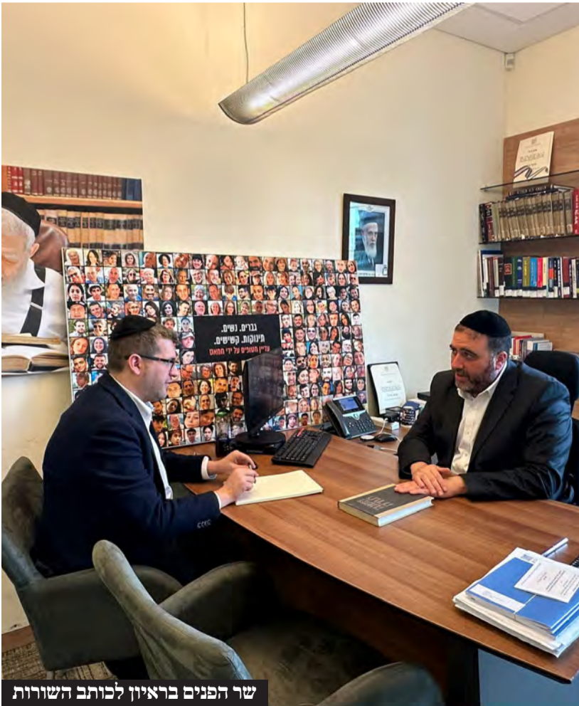
שר הפנים בראיון לכותב השורות