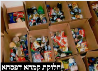
חלוקת קמחא דפסחא