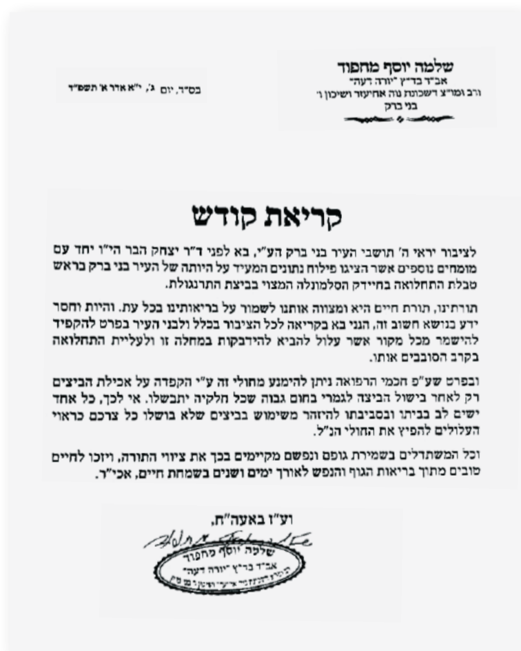
הגאון הרב שלמה יוסף מחפור