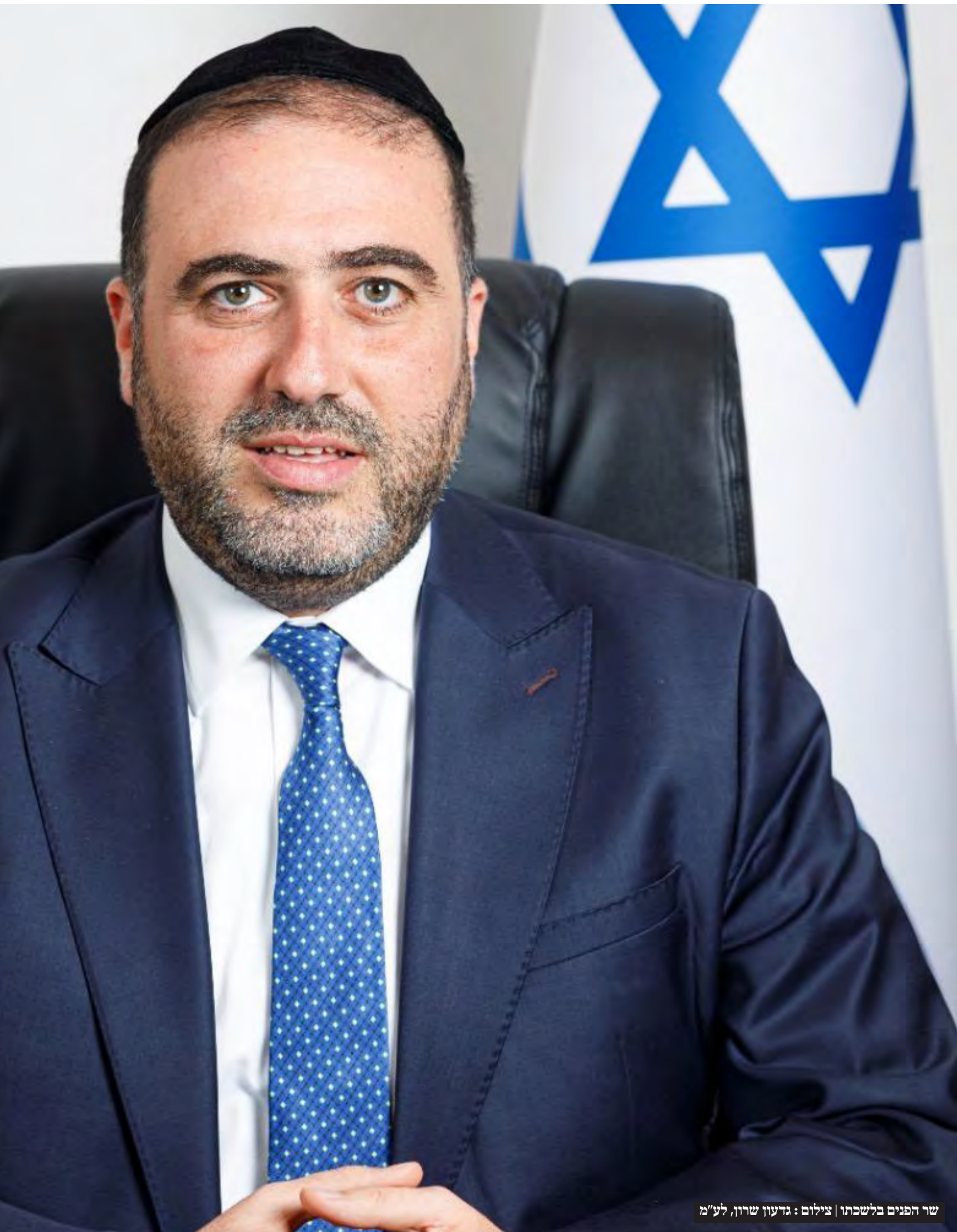
שר הפנים בלשכתו