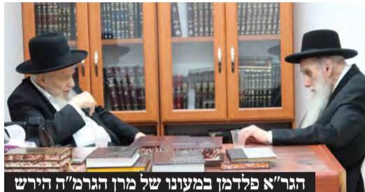
הגר"א פלדמן במעונו של מרן הגרמ"ה הירש