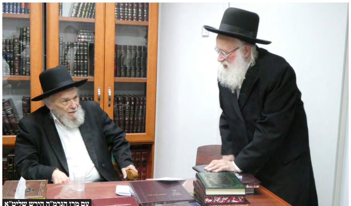
עם מרן הגרמ"ה הירש שליט"א

שהקים, והוא עומד בראשו ואחראי על החזקתו. מהכולל המפורסם הזה, הממוקם בבית הכנסת שלו ברמת אלחנן, יצאו דיינים בעלי שם. הלימוד בכולל נמשך עד השעה אחת ושלושים באופן קבוע, קיץ וחורף, כשמיד לאחר מכן מתפללים מנחה. לאחר התפילה מלווים אותו כאלו שזקוקים לתשובה או עצה דחופה, ומנצלים את הדקות בדרך הביתה. 13:55 אחת לשבוע מתקיים שיעור מוסר. לאחר מכן הוא אוכל ארוחת צהריים וסר לחדרו לנוח כשעה. בשעה רבע לארבע הוא כבר ניצב בחדר הלימוד, כמו נער צעיר ומלא עיזו וגבורה, לקראת סדר שני ארוך הנמשך עד שמונה בערב. לסדר הזה הוא מקפיד לקחת חברותא אך ורק בחורים. בדרך כלל משיבת סלבודקה. הנימוק: לאברכים יש מדי פעם אילוצים שגורמים להם להיעדר. לבחורים אין. הוא מעדיף את אלו שאין להם אילוצים. 20:00 מעריב. 20:25 - ארוחת ערב ומיד לאחר מכן קבלת קהל בעיקר בנושאים ציבוריים. זו השעה שבה מגיעים רבני קהילות ודייני שכונות. 21:00 - 'סדר שלישי'. שוב חברותא עם בחורים צעירים. לימוד עמוק שנוצל את היום. 23:00 - קבלת קהל אחרונה לשאלות דחופות לעמך בית ישראל המידפקים על דלתו עד שעת הצות.