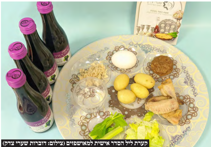
קערות ליל הסדר אישיות למאושפזים

מערך מוקפד של השגחה וכשרות מהדרין כל השנה ובמיוחד בפסח • כלל מוצרי המזון במטבח המרכזי בהכשר בד"צ העדה החרדית ללא קטניות ושרויה • המזון מוגש בכלים חד פעמיים • כלי הגשה חדשים לחלוטין • המטבח עובר הכשרה ע"י אברכים יר"ש • קערות ליל הסדר אישיות ומצות עבודת יד למאושפזים • ליל הסדר ייערך בכל המחלקות