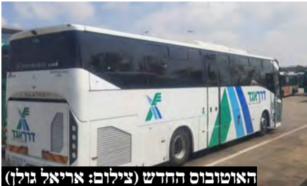
האוטובוס החדש