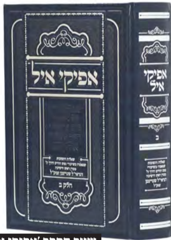
שער הספר 'אפיקי אייל'