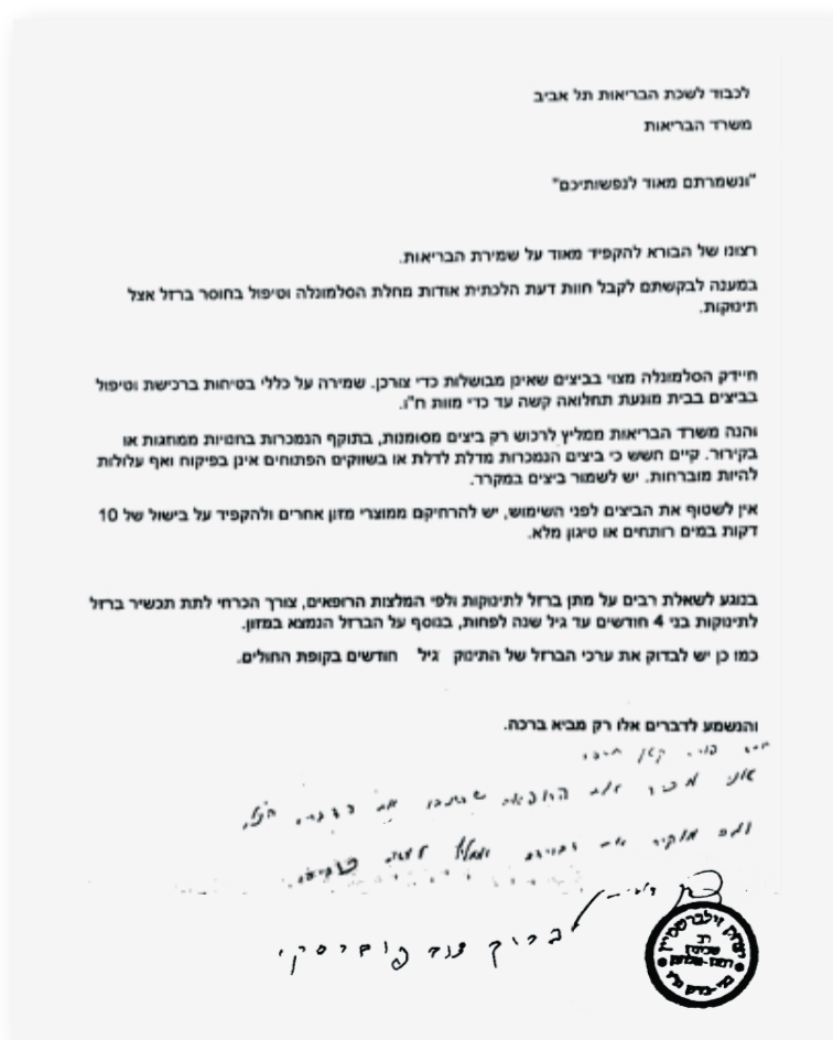
עמוד ההוראה הגאון רבי יצחק זילברשטיין | ראש ישיבת פוניבז' הגאון רבי ברוך דב פוברסקי