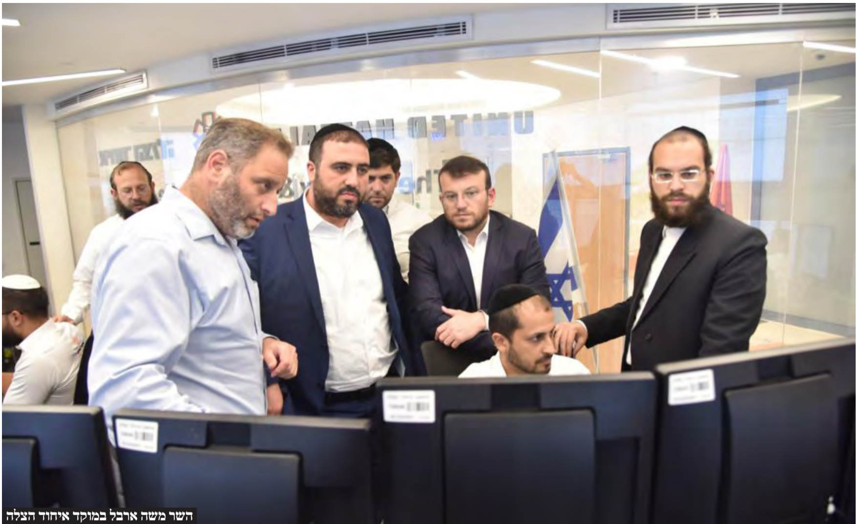
השר משה ארבל במוקד איחוד הצלה

תקציבית, אז פגענו בראש ובראשונה בתושבים."