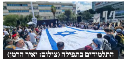
התלמידים בתפילה