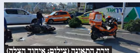
זירת התאונה

בתאונת דרכים בין שני רוכבי אופנוע שהתרחשה ביום שלישי ברחוב שלמה שמלצר בפתח תקווה, נפצעו שני הרוכבים ופוגו לבית החולים במצב בינוני. יוסי אקלר ויוסי סוויד חובשי איחוד הצלה מסרו: "מדובר בתאונה עם מעורבות שני אופנועים. בסיוע חובשים נוספים הענקנו סיוע ראשוני בזירה לרוכב אופנוע (כבן 25) שנפצע בינוני, ולרוכב מהאופנוע השני שנפצע קל. שני הרוכבים פוגו להמשך קבלת טיפול רפואי בבית החולים בלינסון."