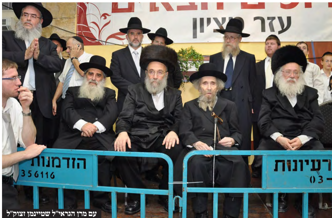
עם מרן הגרא"ל שטיינמן וצוק"ל