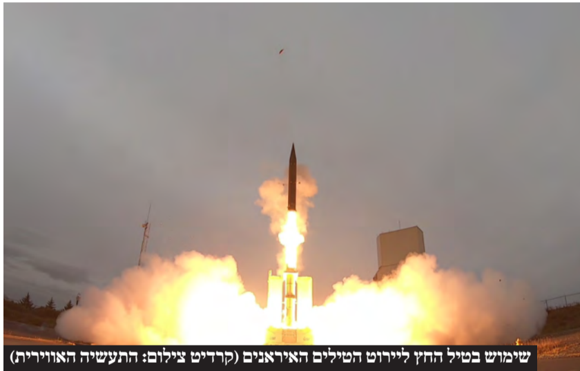
שימוש בטיל החץ ליירוט הטילים האיראנים