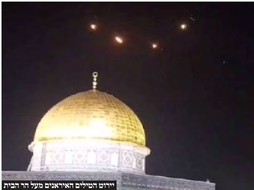
יירוט הטילים האיראנים מעל הר הבית