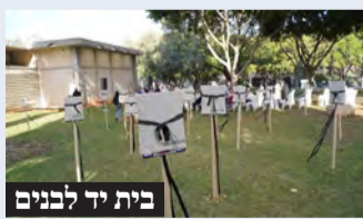
בית יד לבנים

במלאת חצי שנה לטבח הנורא, התקיים טקס מרגש בבית יד לבנים ובו השתתפו משפחות נרצחים וחללים ומשפחות חטופים. ראש העיר כתב: "פתח תקווה זוכרת ולעולם לא תשכח את המשפחות שאיבדו את היקר מכל ואת המשפחות הרבות שמצפות לפגוש את יקיריהן המוחזקים בשבי המחבלים הארורים. מדינת ישראל חווה את אחת מהתקופות הקשות בתולדותיה, אבל אנחנו חזקים ונצא מהתקופה הזו מחוזקים יותר. מתפללים, מייחלים ומצפים לשובם של החטופים הביתה במהרה, לשובם של חילונם הגיבורים בריאים ושלמים, ולימים טובים יותר לכל עם ישראל."