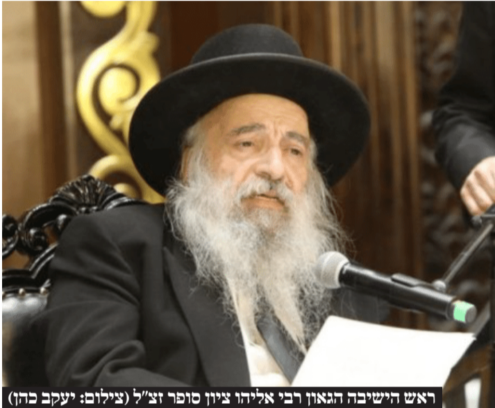
ראש הישיבה הגאון רבי אליהו ציון סופר זצ"ל

הגר"א סופר מתייחד בשילוב נדיר המתבטא בגדולתו ובנסתרו וכוחו גדול גם כן בפסק. ספרו העיקרי על הש"ס הוא באר ציון כאשר לצד זה חיבר גם כן את סדרת הספרים שיעורי ציון על סדר המסכתות, כמו כן חיבר את סדרת הספרים ציון אליהו על ספרא דצניעותא ועוד ספרים רבים. בשנים עברו כיהן הגר"א סופר כדין בביה"ד של הגר"נ קרליץ כשלצד זה חיבר את הספרים 'שערי ציון' ו'ציון במשפט' בהם מפורטים פסקי דין והמסעף לזה.