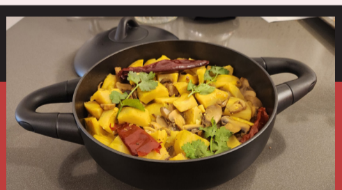
המתכון באדיבות: מירי חיון ובאדיבות המותג סולתם

ארטישוק מבושל הוא תוספת חמה, אלגנטית, מענגת וטעימה לכל ארוחת ובכלל. הארטישוק משתלב עם כל מנה ואף עומד כמנה צמחונית בפני עצמה