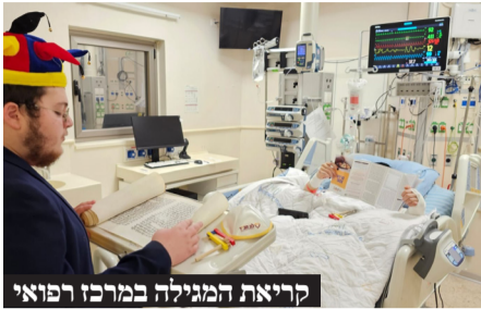
קריאת המגילה במרכז רפואי

שבועיר שכללה גם סעודת פורים מפוארת ועשירה למשפחות המלוות את המאושפזים. שיא הפעילות היה במהלך אירוע ה'עדלאידע' שם התקיים מרתון צפוף של קריאות מגילה עבור באי האירוע. הכל התבצע בבית חב"ד ברחוב ר' חיים עוזר, בנוסף חולקו אלפי משלוחי מנות למשתתפים. בקצה השני של מתחם העדלאידע ברחוב וולפסון הופעל דוכן נוסף של קריאת מגילה שבו מאות הניחו תפילין וחולקו בו מאות משלוחי מנות לבאי האירוע.