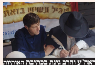
ראש העיר והרב גינת בכתיבת האותיות

בהשתתפות ראש העיר וממלא מקומו, ספר תורה הוכנס ברוב פאר והדר לבית כנסת 'תהילות השם'