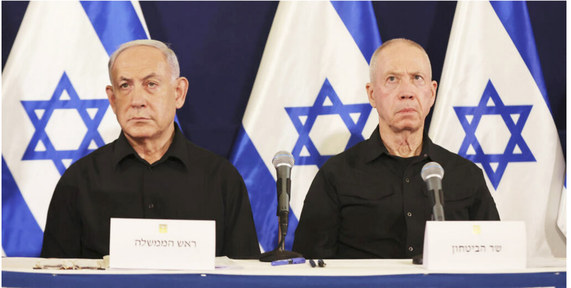
ציר להפלת הממשלה באמצעות חוק הגיוס, שר הביטחון יואב גלנט וראש הממשלה נתניהו