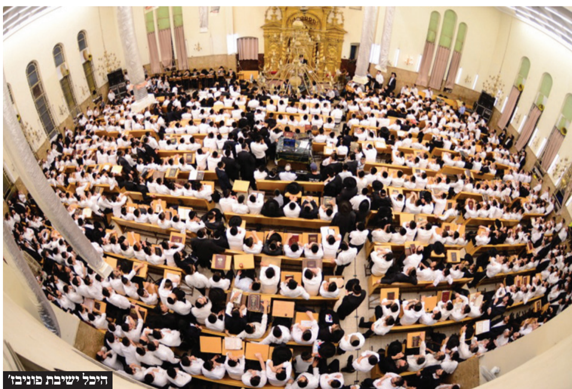
היכל ישיבת פוניבז'