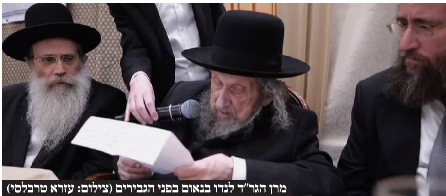
מִן הַגֵּר לְנִדּוּ בְּנֵאֻם בְּפִנֵי הַגְּבִירִים

דברים אלו הם המשך ישיר לדברים שנא מִן הַגֵּר לְנִדּוּ בְּיָוֵם חֲמִישִׁי שֶׁעֶבֶר שְׁעוֹת סְפוּרוֹת לְאַחַר פְּסִיקַת בִּג״צ. בדברים שנשא בכינוס קרן ההסעות בבני ברק אמר מִן הַגֵּר לְנִדּוּ שְׁלִיט״א מֵאֵרֶה ב׳ הַמְּסִיעִים בְּהַחֲזִקַת עוֹלָם הַתּוֹרָה, בְּמִסְגֵּרַת שְׂמִיחַת שִׁבְעַת בְּרֻכּוֹת, לְאַחַר מַחֲשׁוֹבֵי רֵאשֵׁי הַכּוֹלֵלִים, בּוֹ שֶׁתְּתַפֵּן גַּן מִן שְׁלִיט״א.