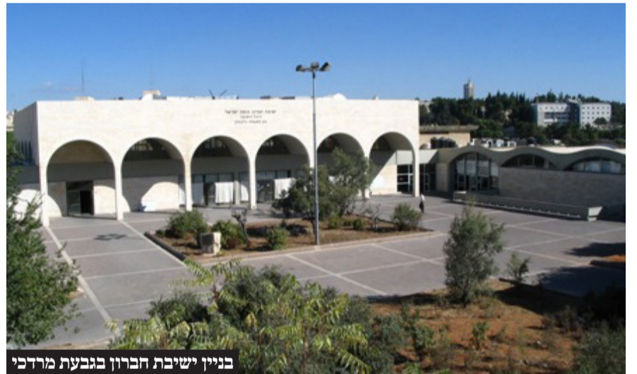
בניין ישיבת חברון בגבעת מרדכי

עסקנים העוסקים בתחום מצוקת הדיור במגזר החרדי: "הבניה לגובה היא זו שתאפשר לזוגות הצעירים להתגורר בקרבת מקום להיכלי הישיבות והחסידיות הגדולים בישראל ואין ספק שזהו הפתרון הברור למצוקת הדיור הקשה הקיימת ומרתחת בכל הארץ"