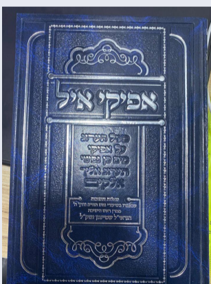
כריכת הספר אפיקי אייל חלק ב'

ורק השתבחו עם הזמן. המחבר נתנם בדיהם של גדולי ישראל ותלמידי חכמים הן לעבור על הדברים והן להוסיף מקורות לדברי רה"י מגדולי הדורות הראשונים והאחרונים. וכן המחבר יגע להביא מקורות עפ"י הספרים אשר ברובם היו בבית רה"י וכפי הנראה עליהם התבסס בעיקרי הדברים.