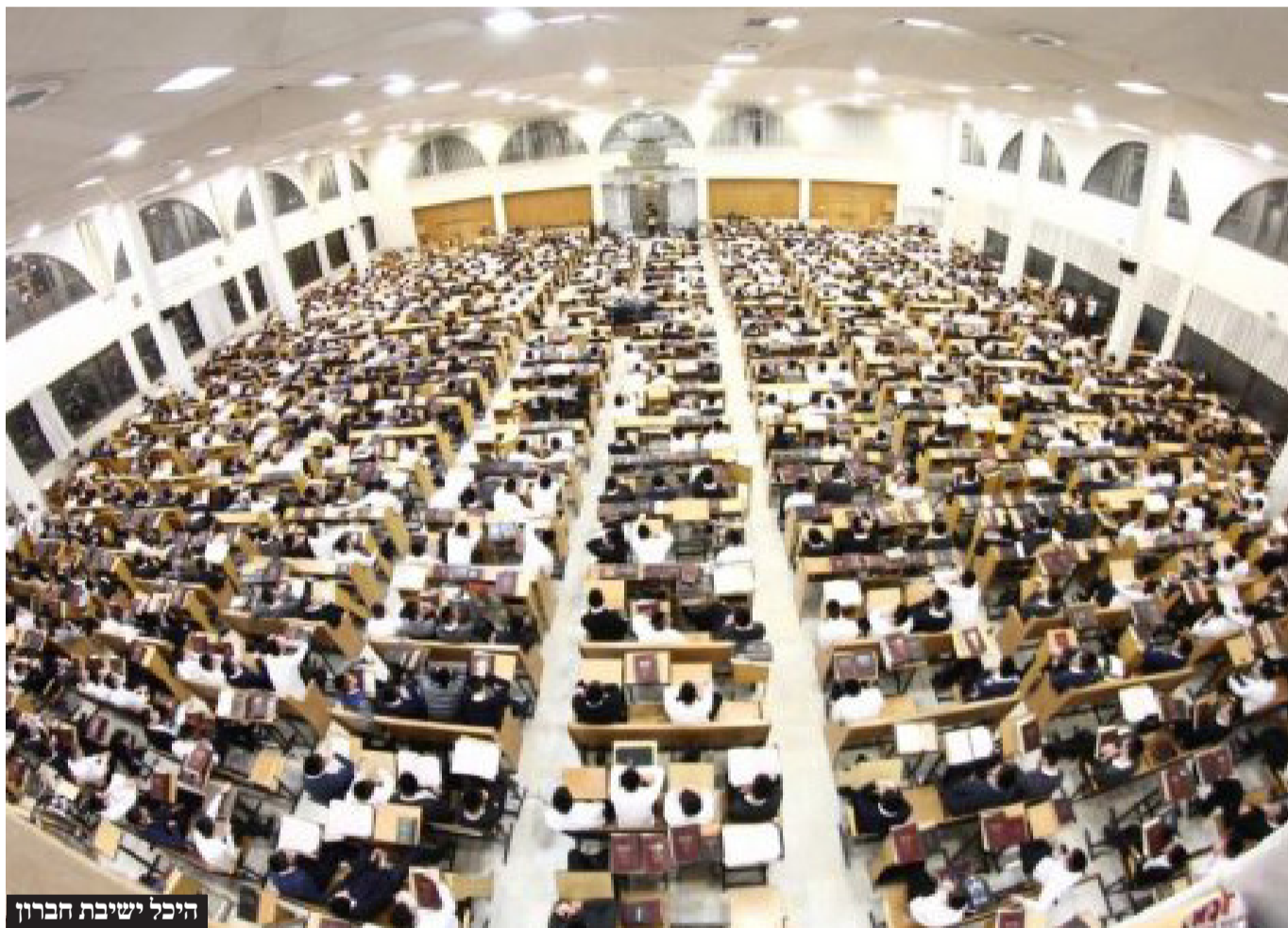
היכל ישיבת הברון

בעקבות החלטת בג"צ, פג תוקפה של הוראת השעה הממשלתית שאפשרה לדחות את גיוס תלמידי הישיבות והמדינה לא תעביר כספים לישיבות • ראש הממשלה בנימין נתניהו הבטיח לפצות על התקציבים שנעצרו, וכן לגייס את תמיכת חברי הכנסת של הליכוד בחוק הגיוס המתגבש • נתניהו: "דרוש עוד פרק זמן קצר לגיבוש סופי של ההסדר, ולהבטיח שאלו ש'תורתם אומנותם' יוכלו ללמוד תורה"