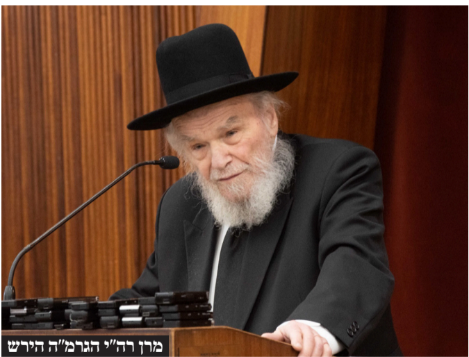
מִן הַגֵּר מֵהִירֵשׁ

בְּחֻדְשֵׁים אַחֲרוֹנוֹים לְפִיֵּהוּן הַצִּיּוּר הַחֲרָדִי צְרִיךְ ״לְהִיכַנס תַּחַת הָאֲלוֹנָקָה וְלִשְׂאֵת בְּנִטְל הַמְּלַחְמָה״ וְאֵמַר כִּי יֵשׁ אֵת ״אֵלֶּה שְׁלֹא דוּוֹקָא שׁוֹנְאִים אוֹתָנוּ וְאֵת הַדֵּת. רַק שְׁלֹא מֵאֲמִינִים וְלֹא מִבִּינִים שֶׁהַתּוֹרָה זֶה מֵה שְׂמִצִּיל אוֹתָם, שׁוֹה שְׂאֲרֵץ יִשְׂרָאֵל עֲדִיין קִיִּימַת כְּשִׁישׁ אֵת כָּל הַשׁוֹנְאִים מִסְבִּיב זֶה רַק בְּגַלְלֵי שִׁישׁ תּוֹרָה בְּא״י הֵם לֹא מֵאֲמִינִים בּוֹה רַח״ל, וְלִכֵּן הֵם אוֹמְרִים אִם כִּכָּה לִמָּה לֹא לְנַהוּג שׁוֹוֶה בְּשׁוֹוֶה״. לְאַחַר שְׁנֵגַע בְּטַעֲנוֹת הַזֹּהֵר כִּי ״בּוֹה שְׂמוֹתֵיהֶם עַל הַתּוֹרָה, כּוֹרְתִים אֵת הַגּוֹזֵעַ שֶׁהַמְּדִינָה עוֹמַדַת עֲלֵינוּ״.