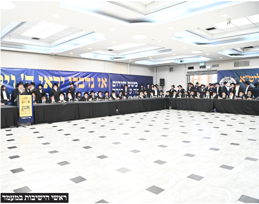
ראשי הישיבות במעמד