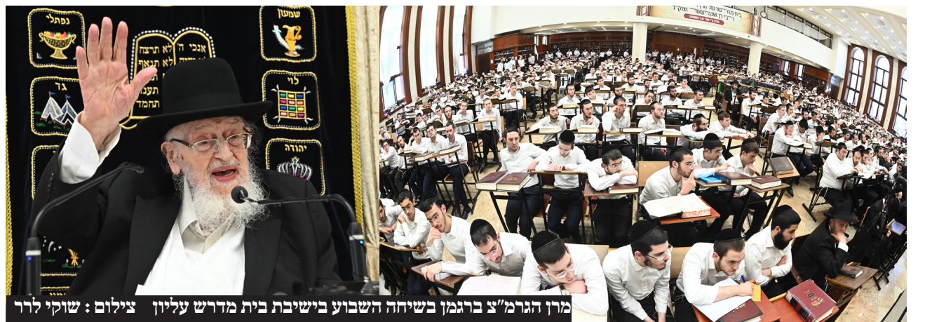
מרן הגרמ"צ ברגמן בשיחה השבוע בשיבת בית מדרש עליון

נהיה מחזוקים בזה, אותם אחים תועים יפנימו אל לבם, כי אין תועלת ותכלית למעלליהם, בניסיון להלך אימים על עולם התורה, ובעזה"י יעזובנו לנפשנו". עוד מוסיף מרן שליט"א ופונה לבני הישיבות: "ואתם בני הישיבות הקדושות, לגיונו של מלך, אל ירך לבבכם, אל תיראו ואל תחפזו ואל תערצו מפניהם! כי לא מפיהם אנו חיים. ערככם וערך תורתכם לא יסולא בפז. "ויש להתבונן את אשר לפנינו, כאשר יבואו בדברים אל בני הישיבות, בטענות או באופני שנובו שונים, אם בטוב אם ברע, הרי שאין לבני הישיבות להיכנס לדו"ר בנושא זה כלל וכלל. "וכבר סיפרתי את שהורה לי בבחרותי מו"ר מרן החזון איש שליט"א, שכסבא לטעון ולשכנע את בני הישיבה בלומז'א לצאת להגן על ארץ ישראל, ובפרט בטענה של הוראת שעה, הורה לי מרן ז"ל, כי אין להשיב לגופם של דברים, כי אם לומר להם נחמדות, כי חפצי הוא אך ורק לימוד התורה!! ויותר לא להוסיף. בלא כל הסברים. משום שעצם הכניסה לדו"ר עמהם, הוא תחילה נפילה ברשתם, ואחרית הדברים מי ישיבנו. "וזה יש להעביר לבני הישיבות. כי אין להשיב חרשים דבר, לא בטוב ולא ברע. אלא רצוננו עז, רק בלימוד התורה הקדושה, כי היא חיינו ואורך ימינו. "ונזכה כולנו לישועה ה' על עמו ונחלתו, כאשר אין ידוע מה ילד יום ה' הנה"ה' ומה"ה' אנונו וצאצאינו כולנו יודעי שמך ולומדי תורתך. ומלאה הארץ דעה את ה' והיתה לה' המלכה". יצוין כי לקראת סיום זמן החורף הגיע מרן רה"י הגרמ"צ שליט"א לשאת משא חיזוק בהיכל ישיבת בית מדרש עליון בבני ברק, שם, בפני מאות בני הישיבות ובמעמד ראשי ורבני הישיבה, השמיע דברי נוקבים נוכח גזירת גיוס בני הישיבות.