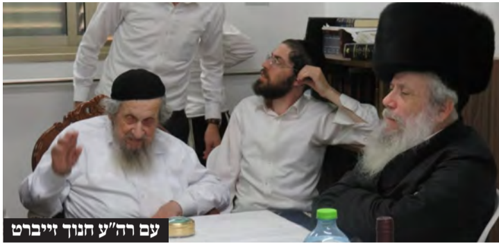
עם רה"ע חנוך זייברט