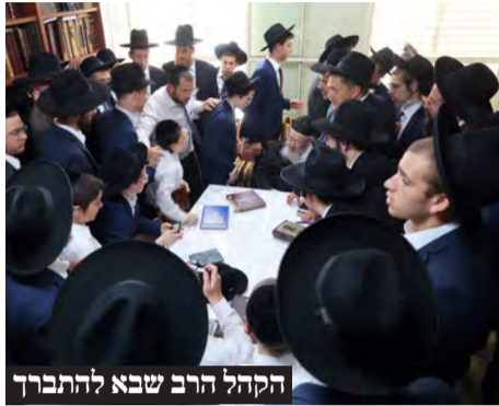
הקהל הרב שבא להתברך