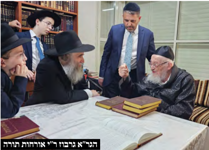
הגר"א גרבוז ר"י אורחות תורה

ביום ראשון של חול המועד הגיע ראש הישיבה לעצרת חג בקהילת "היכל יחזקאל - חברון", במרכז פתח תקווה שם הקבילו את פני מרן שליט"א המונים מתושבי העיר בראשות רבני הקהילות בעיר פ"ת. מדובר באירוע חריג ונדיר שכן בדרך כלל מרן שליט"א אינו יוצא להשתתף בשיעורים וכינוסי חג במהלך חוה"מ.