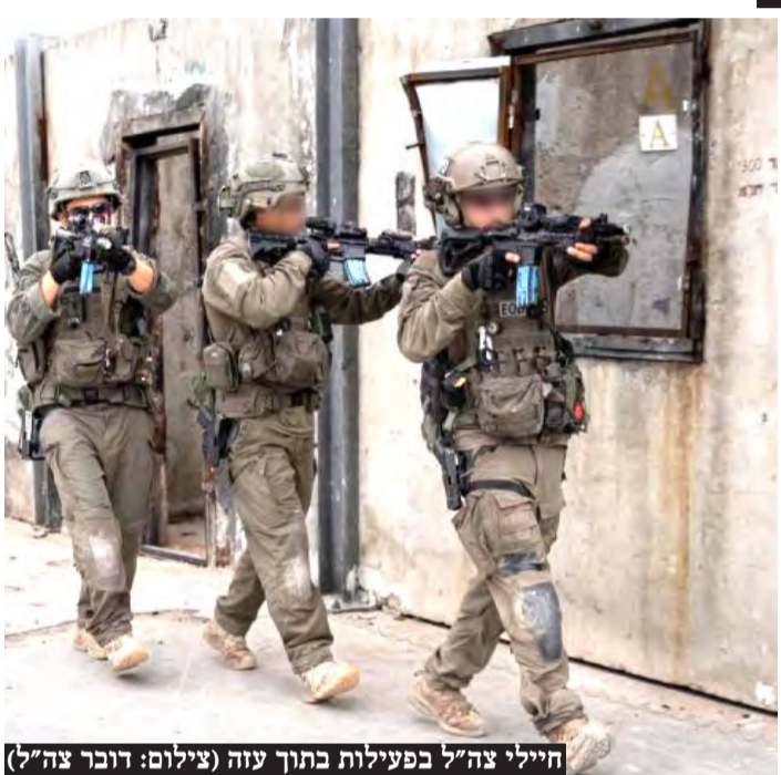
חיילי צה"ל בפעילות בתוך עזה

האם ומתי כוחות הצבא יכנסו לרפייה? מהי המשמעות האסטרטגית לכניסת ישראל לדרום הרצועה והאם זה משפיע על מצבם של החטופים? • כשמצד אחד נשמעות הטענות שחמאס מורה זמן, מוסרים מהצד השני שלחטופים אין הזמנות שניה נוספת • תמונת מצב מלחמה | עמ' 12