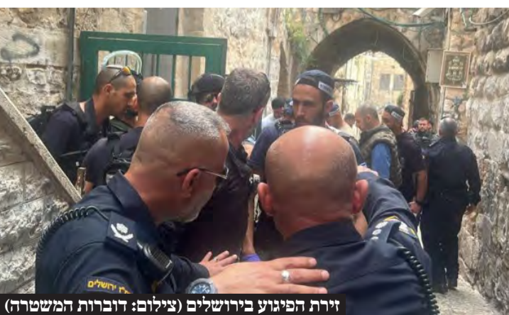
זירת הפיגוע בירושלים

אזרח טורקי ביצע פיגוע בירושלים ונוטרל - צעירה נפצעה כתוצאה ממחבל שדרס לוחמים בשומרון • שני פיגועים בזה אחר זה