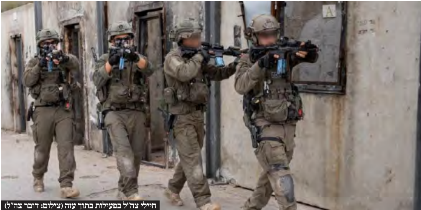
חיילי צה"ל בפעילות בתוך עזה

האם ומתי כוחות הצבא יכנסו לרפיח? מהי המשמעות האסטרטגית לכניסת ישראל לדרום הרצועה והאם זה משפיע על מצבם של החטופים? • כשמצד אחד נשמעות הטענות שחמאס מורח זמן, מוסרים מהצד השני שלחטופים אין הזמנות שניה נוספת • תמונת מצב מלחמה