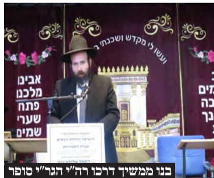
בנו ממשיך דרכו רבי הגר"א סופר