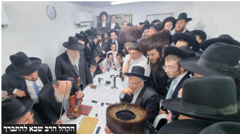
הקהל הרב שבא להתברך

במהלך חג הפסח הגיעו רבנות עמק בית ישראל להקביל את פני מרן הגר"ד לנדו שליט"א, כאשר ביום רביעי התקיים מעמד הקבלת פני רבו מרכזי בהיכל ישיבת "סלבודקא", כשהמונים עוברים על פני מרן לאחר תפילת מנחה, ולמחרת ביום חמישי התקיים הקבלת פני רבו בביתו, ברחוב הרב שר 17.