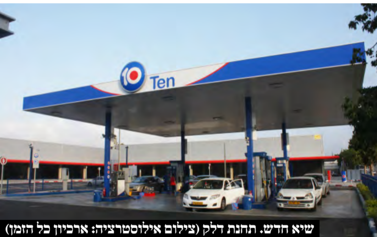
שיא חדש. תחנת דלק

פעם אחרי פעם, מחירי הדלק ממשיכים ועולים • למה המחירים עולים והאם נראה בלימה בקרוב? • וגם: מי סבסד לנו דלק כדי לשמור על מחיר שפוי? • אז.. כמה יעלה לכם ליטר דלק?