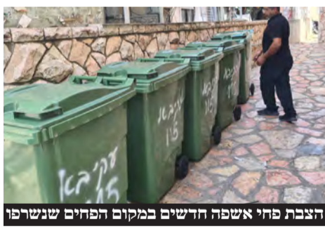
הצבת פחי אשפה חדשים במקום הפחים שנשרפו

בשיטור העירוני מבהירים: "תמו הימים של מעשי וונדליזם במרחב הציבורי ללא תגובה. כל פעילות מתועדת ומזוהה ומטופלת ביד תקיפה בהתאם למדיניות הברורה של ראש העיר בנושא"