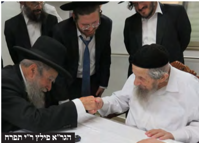
הגר"א פילץ ר"י תפוח