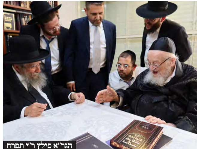
הגר"א פילץ ר"י תפרח