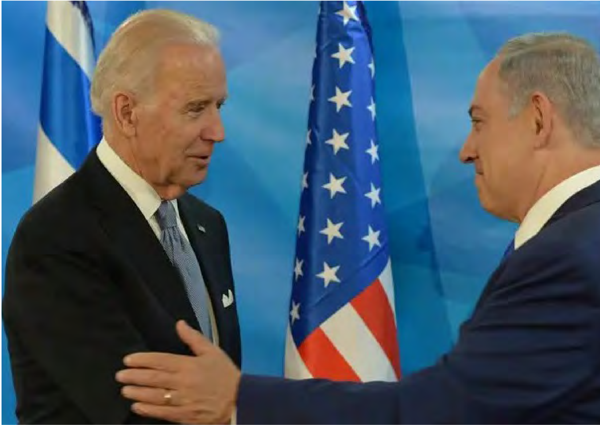
ניגוד אינטרסים? ראש הממשלה ונשיא ארה"ב

» ההיבט הביטחוני השלישי הוא ההבנה שתחלחל לארגוני הטרור על כך שישראל מוכנה ללכת בעסקאות חטופים לא רק עד הקצה, אלא ממש עד הסוף המר. במונח הזה, ברור מאוד שנראה כבר בעתיד הנראה לעין סדרה של ניסיונות חטיפה נוספים, בארץ ובעולם, כשראש הנחש האיראני יפעיל את כל זרועותיו למטרה זו.