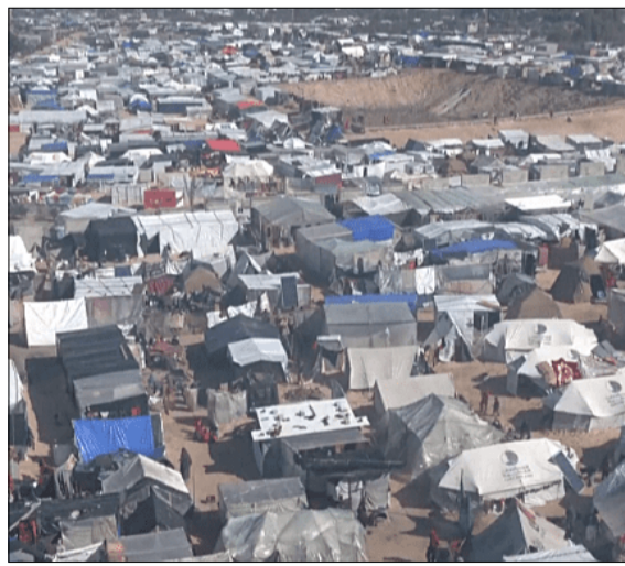
ממתינה לכניסת צה"ל? רפיח

הדבר השני שצריך לזכור, הוא שלאור השינויים במבנה האלקטורים הבוחרים את הנשיא (אחת לעשור נערך בארה"ב שינוי כזה בעקבות ניתוח מחדש של מספרי המצביעים בכל מדינה וחלוקה הוגנת יותר), כדי להגיע למספר הקסם המנצח של 270 אלקטורים, ביידן זקוק ראשית כל לשמור על כל מדינות הבית הכחולות, ושנית, עליו לנצח לפחות בפנסילבניה, מישגן וויסקונסין, המספקות יחד ארבעים וארבעה אלקטורים. רק ניצחון בשלושתן יחד יביא אותו בדיוק למאתיים ושבעים צירים. נכון לעכשיו, כמעט בכל סצנריו, הוא מפסיד לטראמפ לפחות באחת מהן, שלא לומר בשלושתן.