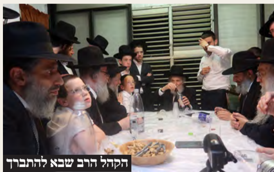
הקהל הרב שבא להתברך