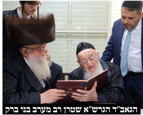
הגאב"ד הגרש"א שטרן רב מערב בני ברק

במהלך ימי החג עברו המונים להקבלת פני רבו אצל רבינו מרן ראש הישיבה הגרמ"צ ברגמן ברחוב האדמו"ר מגור בבני ברק בהם גדולי ישראל וראשי ישיבות, רבנים ויושבי על מדין, חברי כנסת, נציגי ציבור ועמך בית ישראל מכל החוגים. בערב יו"ט עלה למעונו של מרן שליט"א, הגאון רבי יצחק סורוצקין שליט"א חבר מועצהגה"ת בארה"ב וראש מתיבתא דלייקווד.