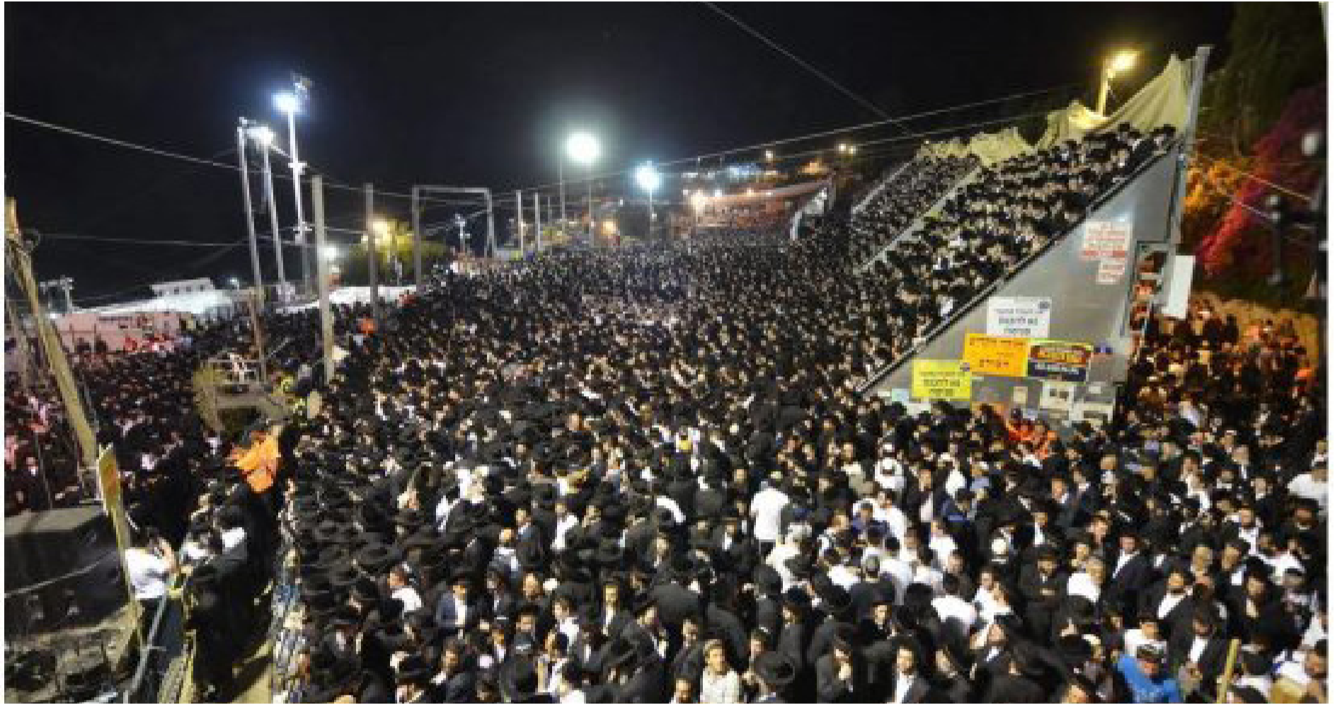
שנה בלי היולא. ההדלקה בציון הרשב"י אשתקד

» מלכיאלי, פוליטיקאי משופשף דיו, הבהיר כבר בתחילת הישיבה כי הוא לא מתכוון בכלל לעסוק בסעיף הזה, משום שבלאו הכי הדיון הזה יוכרע אצל ראש הממשלה בהמשך הדרך. נתניהו יצטרך לשמוע את דרעי ואת פרוש, ולקבוע האם הוא בוחר באחד הצדדים או מעדיף להקפיא את המצב הנוכחי ולהתעלם מההמלצה הראשונה של הועדה, כשכולם מבינים את המשמעות התקשורתית והציבורית שתהיה להתעלמות כזו. למזלו, כאמור, המצב הביטחוני סידר לו ארכה של שנה עד לקיומה של היולא ממשיית (אם כי ההחלטה תצטרך ליפול עוד הרבה קודם לכן, כדי לאפשר את ההיערכות מבחינה תקציבית ולוגיסטית). במהלך הדיון הוחלט על הקמתה של ועדת מנכ"לים של מנכ"לי משרדי הממשלה הרלוונטיים, שתכלול את המטלות השונות ותתחיל להניע את הנדרש. תוך שימת דגש על פרויקטים שעשויים להימשך זמן ולדרוש גם סיוע משפטי ותקציבי מוגבר, כמו ביצוע הפקעות, התנהלות מול ההקדשות, ועוד כהנה וכהנה. בינתיים, ביום חמישי השבוע, צפוי מלכיאלי לקיים דיון גם לקראת ההיולא של רבי מאיר בעל הנס, השר צפוי להגיע גם לדיון הזה עם מסר אחיד וברור - מה שכוחות הביטחון יאפשרו וימליצו, זה גם מה שיתאפשר לביצוע על ידי המשרד, בדיוק כפי שהשר נהג בהיולא הבאבא סאלי זע"א, שנערכה גם היא בחודשים האחרונים, באזור מסוכן ותחת שורה של הנחיות מכבידות.