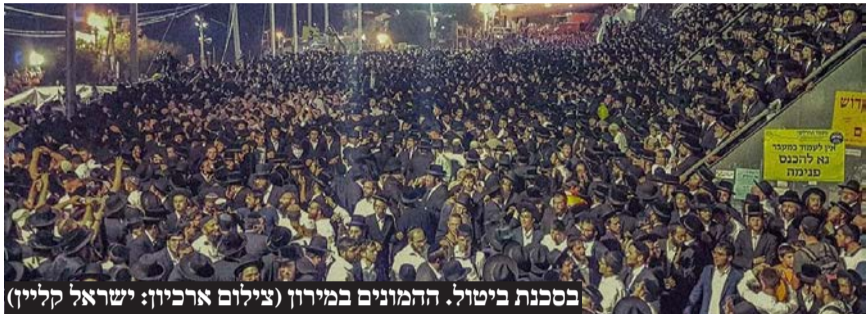
בסכנת ביטול. ההמונים במירון

מחד נמשכות ההכנות במלא המרץ תוך בניית והכשרת מתחם הרשב"י ומאיך מתחלחלת ההבנה כי ייתכן והשנה לא ניתן יהיה לעלות לציון בל"ג בעומר • כך נערכות ההכנות אצל רשב"י להילולא בצל המלחמה בצפון