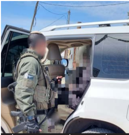
קצין שליטה את החילוץ נושא את אחד הילדים

המבצע המורכב הותר לפרסום: אישה יהודייה שנישאה לפני 6 שנים לערבי והתאסלמה, יצרה קשר עם יד לאחים ובערב החג, חולצה מלב הפלסטינית וחגגה את החג כבת חורין