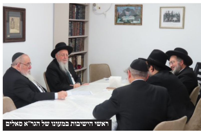
ראשי הישיבות במעונו של הגר"א סאלים

כמה מראשי הישיבות הספרדיות עלו למעונו של חבר מועצת חכמי התורה הגר"א סאלים כדי לדון בענייני השעה ובפרט בנושא גיוס בני הישיבות