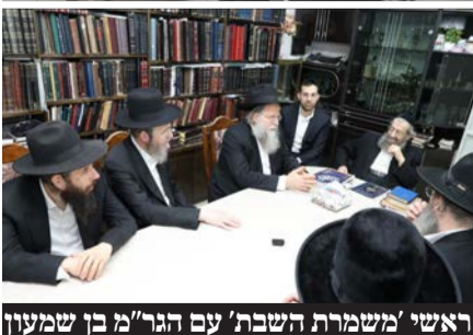
ראשי 'משמרת השבת' עם הגר"מ בן שמעון

והוסיף והצטרף לחתימתם של גדולי ישראל שעוררו על חשיבות הסוגיה.