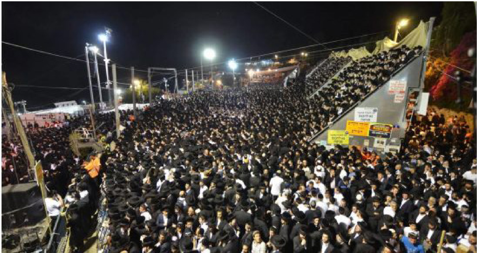
שנה בלי היולא. ההדלקה בציון הרשב"י אשתקד

» מלכיאלי, פוליטיקאי משופשף דיו, הבהיר כבר בתחילת הישיבה כי הוא לא מתכוון בכלל לעסוק בסעיף הזה, משום שבלאו הכי הדיון הזה יוכרע אצל ראש הממשלה בהמשך הדרך. נתניהו יצטרך לשמוע את דרעי ואת פרוש, ולקבוע האם הוא בוחר באחד הצדדים או מעדיף להקפיא את המצב הנוכחי ולהתעלם מההמלצה הראשונה של הוועדה, כשכולם מבינים את המשמעות התקשורתית והציבורית שתהיה להתעלמות כזו. למזלו, כאמור, המצב הביטחוני סידר לו ארכה של שנה עד לקיומה של היולא ממשיית (אם כי ההחלטה תצטרך ליפול עוד הרבה קודם לכן, כדי לאפשר את ההיערכות מבחינה תקציבית ולוגיסטית). במהלך הדיון הוחלט על הקמתה של ועדת מנכ"לים של מנכ"לי משרדי הממשלה הרלוונטיים, שתכלול את המטלות השונות ותתחיל להניע את הגדרש. תוך שימת דגש על פרויקטים שעשויים להימשך זמן ולדרוש גם סיוע משפטי ותקציבי מוגבר, כמו ביצוע הפקעות, התנהלות מול ההקדשות, ועוד כהנה וכהנה. בינתיים, ביום חמישי השבוע, צפוי מלכיאלי לקיים דיון גם לקראת היולא של רבי מאיר בעל הנס, השר צפוי להגיע גם לדיון הזה עם מסר אחיד וברור - מה שכוחות הביטחון יאפשרו וימליצו, זה גם מה שיתאפשר לביצוע על ידי המשרד, בדיוק כפי שהשר נהג בהילולת הבאבא סאלי זע"א, שנערכה גם היא בחודשים האחרונים, באזור מסוכן ותחת שורה של הנחיות מכבידות.