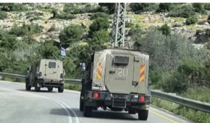
בדרך אל החופש. הרכבים של צה"ל יוצאים מהכפר אל נקודת המפגש

בארגון הצליחו לתחזק איתה קשר קבוע מתחת לאפו של הערבי ואחרי שנתיים מלאות חששות שירה החליטה לעזוב למרות החשש שהערבי האלים יחפש אותה ויפגע בה.