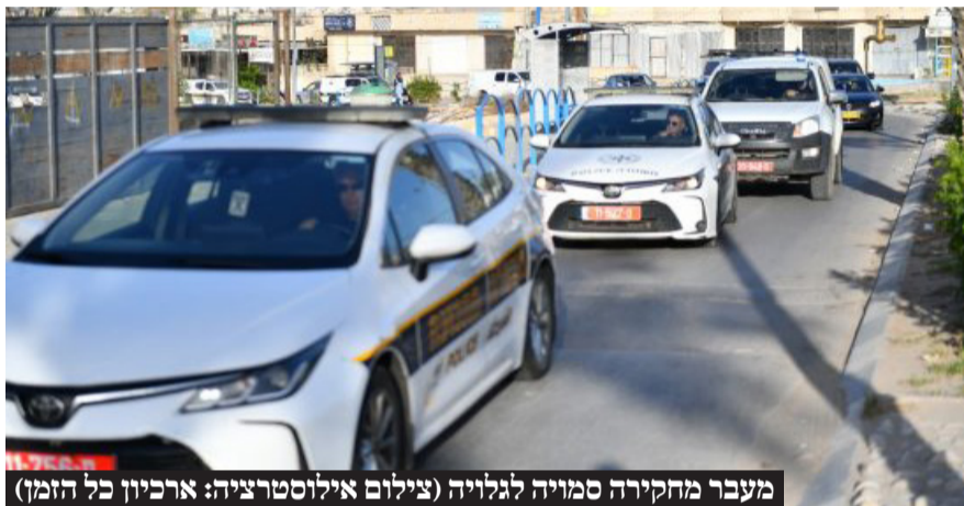
מעבר מחקירה סמויה לגלויה

מהחקירה הסמויה עלה כי החשודים איתרו באופן שיטתי קשישים עריריים מאזור גוש דן, שהלכו לעולמם זמן לא רב לפני כן, זייפו את צוואותיהם, הציגו מצג כאילו הם אשר יועדו להיות היורשים החוקיים של הקשישים, ובסיוע של עורכי דין, פעלו מול רשויות המדינה על מנת