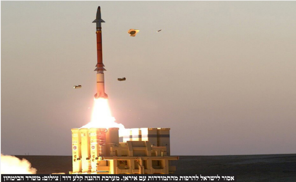
אסור לישראל להרפות מהתמודדות עם איראן. מערכת ההגנה קלע דוד

משקף את מצב הרוח בארצות הברית ואת הרתיעה מפני הרפתקאות צבאיות מעבר לים. במצב זה השאלה המתבקשת היא האם ישראל יכולה להרתיע את איראן מלהשתמש בנשק הגרעיני שעלול להיות ברשותה כנגד מדינת היהודים. אם לשתי המדינות יהיה נשק גרעיני יהיה קשה מאוד לקיים מאזן הרתעה יציב, זאת בניגוד למה שכותבים אקדמאים חסרי אחריות. באופן כללי, קשה לחקות את היחסים שהיו בין שתי המעצמות הגרעיניות, ברית המועצות וארצות הברית. יצירת "מאזן אימה" יציב הוא בעייתי מאוד במזרח התיכון. צריך לזכור שהמציאות שלשני צדדים יש נשק גרעיני דומה לשני אקדוחנים הניצבים זה מול זה. השולף המהיר הוא המנצח. "מאזן אימה" אולי עובד כאשר לשני הצדדים יש מה שקרוי "כוח מכה שנייה", כלומר היכולת לגרום נזק בלתי נסבל לצד השני למרות הפגיעה הגרעינית שספג. אז כוח המכה שנייה מרתיע מליזום מלחמה גרעינית. בניית כוח מכה שנייה הוא עניין מורכב שיש בו חוסר ודאות. יתר על כן, הוא תלוי ברגישות לכאב. במזרח התיכון האיראנים מוכנים לשלם מחיר גבוה. מה זה נזק בלתי נסבל מבחינתם? הם מוכנים לספוג כאב רב, והם אמרו שהם מוכנים לשלם במיליוני איראנים כדי להרוס את המדינה היהודית.