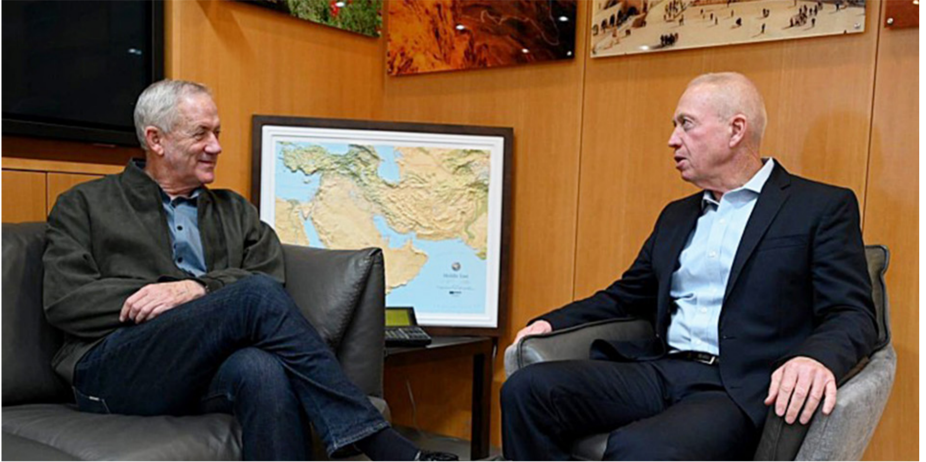
צמד הגימלים נלכדו ברגעי חולשה, שר הביטחון יו"ר המחנה הממלכתי

אחריו על בסיס יומי. פינדרוס ספציפית סיים את הפגרה במקום השביעי בדירוג הנוכחות של חברי הכנסת. ככלל, בעשירייה הראשונה יש שמונה נציגים לקואליציה ושניים בלבד לאופוזיציה - ח"כ מירב כהן במקום השישי וח"כ קינלי טורפזו במקום השמיני. את הצמרת מאיישים בבטחה יו"ר הכנסת אמיר אוחנה, יו"ר ועדת חוקה שמחה רוטמן, הח"כ החרוץ בשורות ש"ס ינון אזולאי, וחברי הכנסת צגה מלקו ועמית הלוי מהליכוד. ואיפה נמצאים לפיד וחבריו, כולל איווט ליברמן, שתפס גם הוא טרמפ על הקמפיין המדובר? ובכן, לפיד נמצא בשיפולי הרשימה, במקום התשעים ותשע (!) מעט מתחת לליברמן במקום ה-86. ח"כים נוספים מיש עתיד אפשר למצוא בין השאר במקום ה-50 (רם בן ברק), ה-66 (מיכל שיר), ה-74 (להב הרצנו) וה-83 (בועז טופורובסקי). או כמו שקוראים לזה ב'יש עתיד' - "תמיד בשבילכם". חמירא סכנתא בשולי הדברים, מן הראוי להזכיר שוב את הסיבות לביטול ההילולא במירון: קיומה של סכנת נפשות מוחשית וממשית, כולל התראות מודיעיניות ממקורות לניסיונות אפשריים של חיזבאללה לפגוע בעולים להר, העדר זמן התראה מספק (עד 15 שניות, במקרה הטוב) והעדר מיגוניות בשטח ההר. לא לחינם הורו רוב מניין ובניין של גדולי ישראל לציית להוראות ולהימנע מפיקוח נפש, ומיותר לציין גם את ההיבט התקשורתי והפומבי, בהילולא שתיסרק במסרקות הברזל של התקשורת הישראלית, כדי לאתר את "החרדים העבריינים" בתקופה רגישה כל כך.