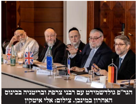
הגר"פ גולדשמידט עם רבני צרפת ובריטניה בכינוס האחרון במינכן.

קריאות האב ובתו לעזרה מהעוברים והשבים לא נענו. מוקדם יותר השבוע, גל יריות התבצע על שגרירות ישראל בשבדיה בשטוקהולם. הנושא נמצא עדיין בבדיקת המשטרה המקומית. רבני הקהילות היהודיות מביעים דאגה מהמצב החמור. נשיא ועידת רבני אירופה, הגאון רבי פנחס גולדשמידט הגיב לאירועים הקשים: "אני מודה לממשלת צרפת על המענה המהיר לניסיון הפיגוע בבית הכנסת. הם מנעו אסון גדול. היהודים נמצאים