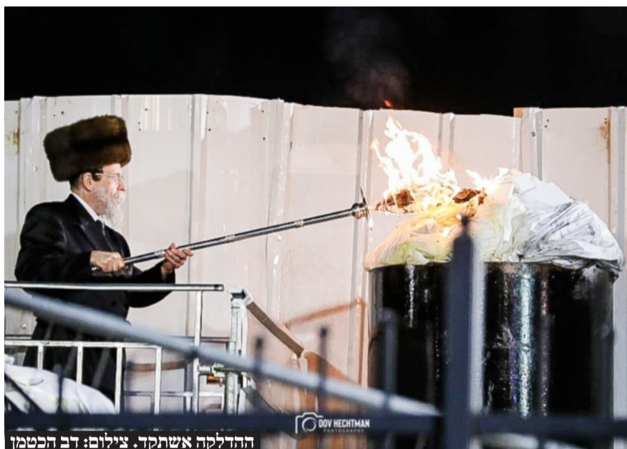
הדלקה אשתקד.

כאמור, בחוק שיוצע יינתנו אישורים לשלוש הדלקות על ההר, אחד במתחם הציון, ושתיים במתחם בני עקיבא, לפי החלטת השר הממונה פרוש. שמות מקבלי ההיתרים לשהייה בהר יפורסמו באתר המשרד 48 שעות לפני זמן ההילולא. לגבי בני משפחות הקדושים נכתב כי