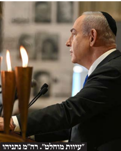
"עיוות מוחלט". רה"מ נתניהו

תגובות חריפות בישראל ובעולם להחלטת התובע הכללי של בית הדין הפלילי הבינלאומי בהאג להשוות בין חמאס לישראל ולהוציא צווי מעצר נגד רה"מ בנימין נתניהו ויואב גלנט, לצד ראשי ארגון הטרור הנתעב