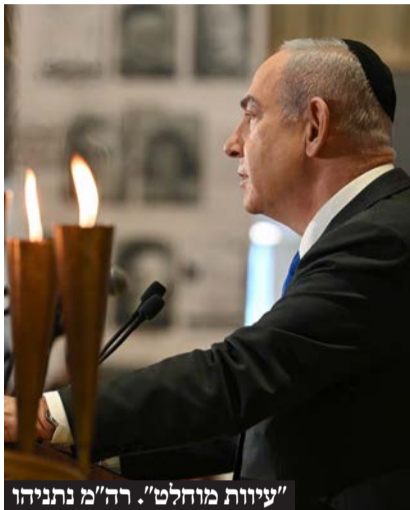
"עיוות מוחלט". רה"מ נתניהו

תגובות חריפות בישראל ובעולם להחלטת התובע הכללי של בית הדין הפלילי הבינלאומי בהאג להשוות בין חמאס לישראל ולהוציא צווי מעצר נגד רה"מ בנימין נתניהו ויואב גלנט, לצד ראשי ארגון הטרור הנתעב