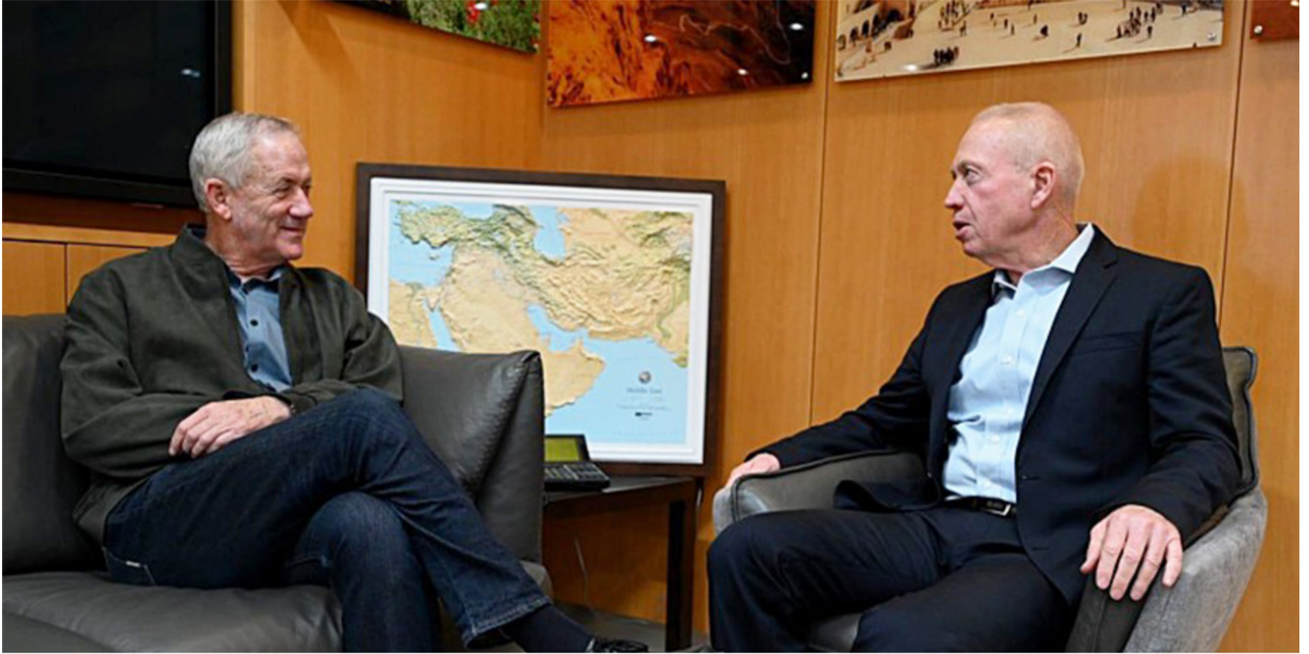
צמד הגימלים נלכדו ברגעי חולשה, שר הביטחון ויו"ר המחנה הממלכתי

אחריו על בסיס יומי. פינדרוס ספציפית סיים את הפגרה במקום השביעי בדירוג הנוכחות של חברי הכנסת. ככלל, בעשירייה הראשונה יש שמונה נציגים לקואליציה ושניים בלבד לאופוזיציה - ח"כ מירב כהן במקום השישי וח"כ קינלי טורפזו במקום השמיני. את הצמרת מאיישים בבטחה יו"ר הכנסת אמיר אוחנה, יו"ר ועדת חוקה שמחה רוטמן, הח"כ החרוץ בשורות ש"ס ינון אזולאי, וחברי הכנסת צגה מלקו ועמית הלוי מהליכוד. ואיפה נמצאים לפיד וחבריו, כולל איווט ליברמן, שתפס גם הוא טרמפ על הקמפיין המדובר? ובכן, לפיד נמצא בשיפולי הרשימה, במקום התשעים ותשע (!) מעט מתחת לליברמן במקום ה-86. ח"כים נוספים מיש עתיד אפשר למצוא בין השאר במקום ה-50 (רם בן ברק), ה-66 (מיכל שיר), ה-74 (להב הרצנו) וה-83 (בועז טופורובסקי). או כמו שקוראים לזה ב'יש עתיד' - "תמיד בשבילכם". חמירא סכנתא בשולי הדברים, מן הראוי להזכיר שוב את הסיבות לביטול ההילולא במירון: קיומה של סכנת נפשות מוחשית וממשית, כולל התראות מודיעיניות ממקורות לניסיונות אפשריים של חיזבאללה לפגוע בעולים להר, העדר זמן התראה מספק (עד 15 שניות, במקרה הטוב) והעדר מייגוניות בשטח ההר. לא לחינם הורו רוב מניין ובניין של גדולי ישראל לציית להוראות ולהימנע מפיקוח נפש, ומיותר לציין גם את ההיבט התקשורתי והפומבי, בהילולא שתיסקר במסרקות הברזל של התקשורת הישראלית, כדי לאתר את "החרדים העבריינים" בתקופה רגישה כל כך.