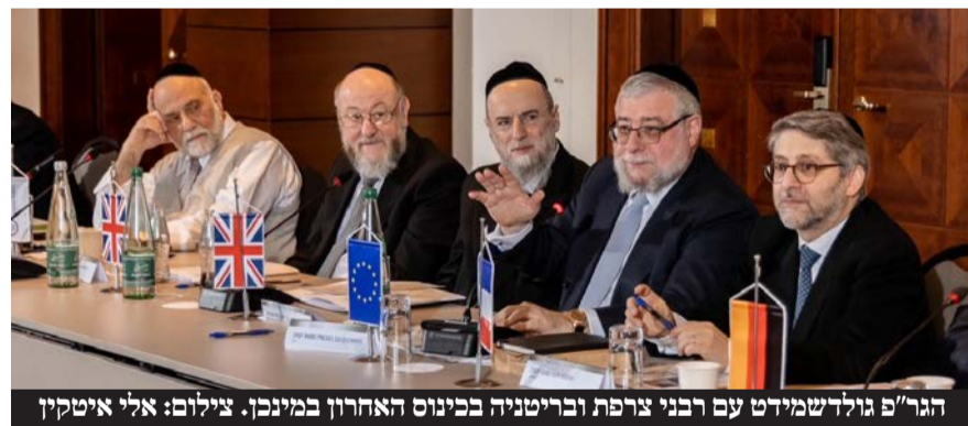
הגר"פ גולדשמידט עם רבני צרפת ובריטניה בכינוס האחרון במינכן.

גל האנטישמיות באירופה המשיך להסלים: בשוודיה נשמעו יריות בסביבות השגרירות הישראלית, בבלגיה הותקף ישראלי בידי פרו פלשתינים, ובצרפת הוצת בית כנסת בחבל נורמנדי