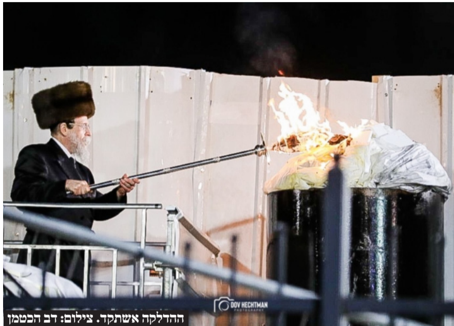
הדלקה אשתקד.