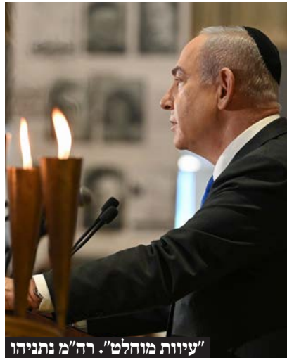
"עיוות מוחלט". רה"מ נתניהו

איזו בושה. אזרחי ישראל, אני מבטיח לכם דבר אחד - הניסיון לכבול את ידינו ייכשל. לפני 80 שנה, העם היהודי היה חסר מגן מול אויביו - אבל לא עוד."