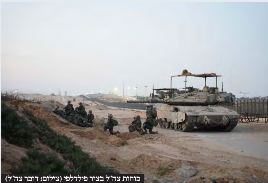
כוחות צה"ל בציר פילדלפי

סוגיית 'היום שאחרי': גנרל דיוויד פטראוס, ראש ה-CIA לשעבר מפרסם מאמר מקיף ומעמיק אודות המלחמה בעזה יחד עם מומחים נוספים • "על ישראל לבסס שירותים ציבוריים, בהמשך תועבר השליטה לגורם אחר - בגיבוי צה"ל"