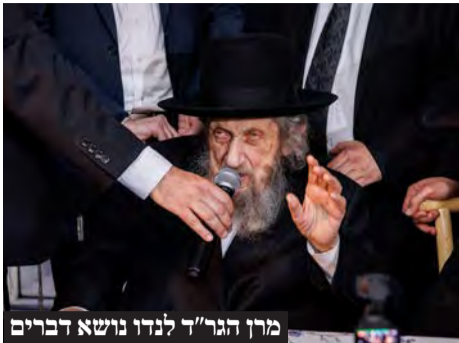
מרן הגר"ד לנדו נושא דברים