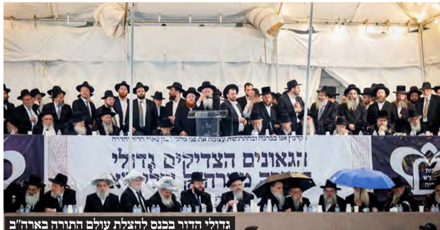
גדולי הדור בכנס להצלת עולם התורה בארה"ב

"ובאנו בגלל זה, לבקש שתצילו את התורה בארץ ישראל, כדי שלא יבוטל התורה בארץ ישראל, ולעשות את זה במסירת נפש, להגיע לדרגות נשגבות, וכל אחד יביא עצמו לדרגה של מסירת נפש, והשי"ת יברך לכל הנוטלים חלק במשימה זו, יבורך מהשי"ת בסייעתא דשמיא בכל דבריו ברוחניות ובגשמיות, כבריאות נחת מהילדים, שלום בית, וכל טוב, ומהלילה יצא כבוד התורה, שתביא קידוש שם שמים, ובתקווה שכבוד התורה הזו תביא הגאולה השלימה בב"א."