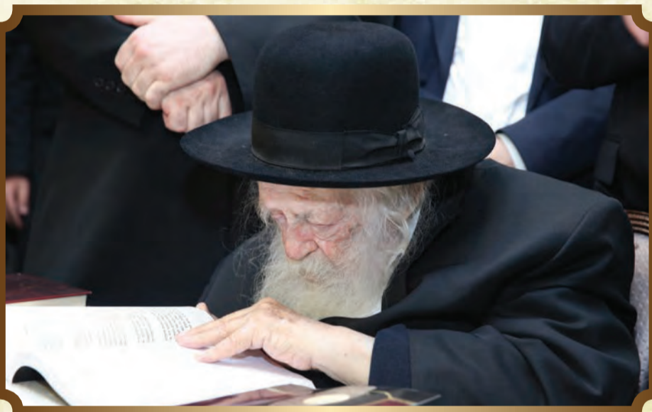
מרן זצוק"ל מנצל כל רגע ללימוד התורה.

ד' סיון הרב משה קטרי בית שמש ספר ב' ד' סיון הבה"ח חיים כהן בני ברק משניות * ב' ד' סיון הרב ברוך קיין בדרכו * 8 דף * ספר ב' ד' סיון הרב ברכי אייזנשטיין בני ברק כהנהגתו * 500 ב' ד' סיון הבה"ח אהרון אברהם שלמה קוטלר טלז סטון משניות * ספר ב' ד' סיון הרב אפרים פישל הלוי סגל ירושלים בדרכו * 8 דף * ספר ג' ה' סיון בורשטיין מו"ע בדרכו * 8 דף * ספר ג' ה' סיון הרב שמעון אליהו בני ברק בדרכו * 8 דף * ספר ג' ה' סיון הרב חיים כץ מודיעין עילית דף * ספר ג' ה' סיון הרב שלמה חיים גולבסקי ירושלים שיח 500 ג' ה' סיון הרב שלמה חיים ירושלים בדרכו * 8 דף * 300 ג' ה' / התלמידה חחמה ברלין מודיעין עילית כהנהגתו * ספר ג' ה' סיון התלמיד יוסף שלום שופט מודיעין עילית משניות * ספר