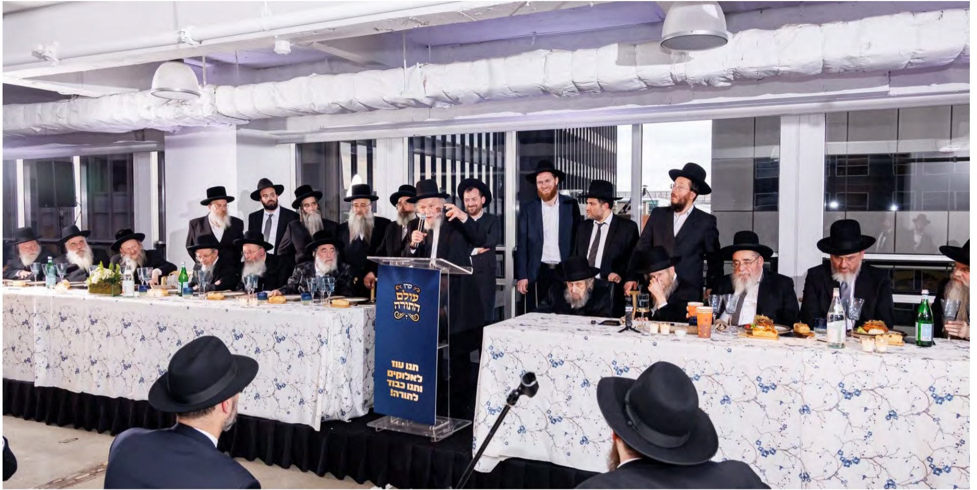
מרן גדולי ישראל במטע להצלת עולם התורה

נמנע מלהכריע בשאלת גודל צי הצוללות אף שהנושא עלה בפניו.