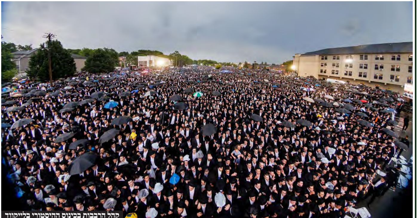
קהל הרבבות בכינוס ההיסטורי בלייקווד