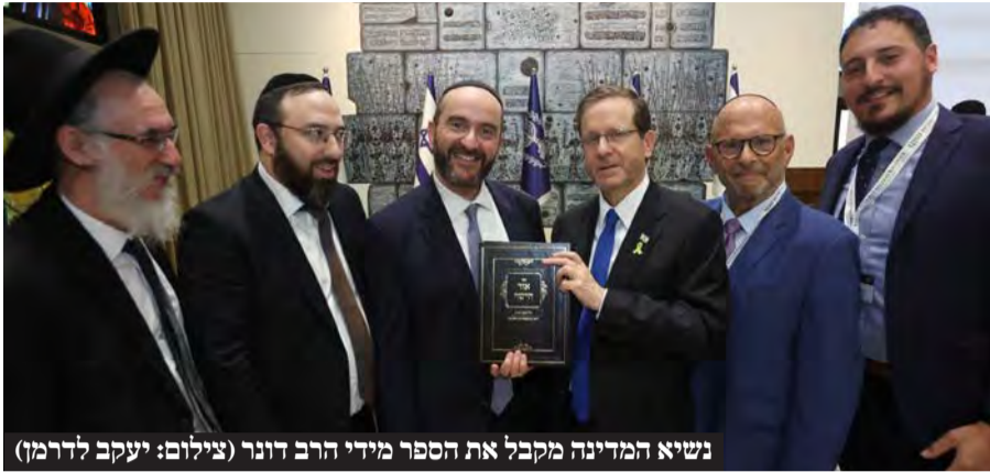
נשיא המדינה מקבל את הספר מידי הרב דונר

נשיא המדינה יצחק הרצוג ורעייתו מיכל אירחו בבית הנשיא את הרב פנחס אליעזר הלוי דונר, רבה של קהילת בוורלי הילס בלוס אנג'לס, שהגיע עם משלחת של 40 מראשי קהילתו לביקור הזדהות עם ישראל • במהלך המפגש הגיש הרב דונר לנשיא מהדורה חדשה של 'אור הישר' ספר תלמודי הלכתי שחיבר סבו של הנשיא הרב שמואל הילמן זצ"ל