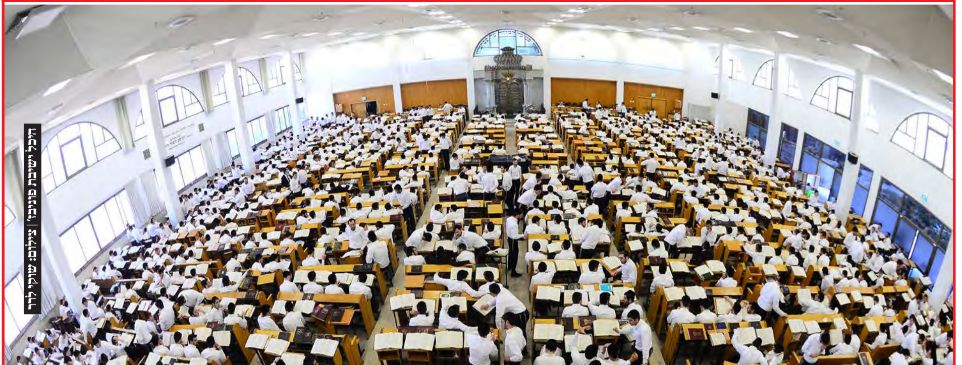
היכל הישיבות פוניבז'