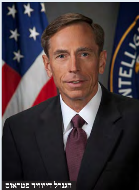
הגנרל דיוויד פטראוס

על כל מי שנכנס ויוצא משכונות ואזורים ברצועה, תוך שימוש באמצעים מתקדמים לזיהוי. הכותבים טוענים כי על ישראל לפעול לביסוס חיים אזרחיים כמה שיותר מהר ברצועת עזה - בכדי לאחוז במושכות