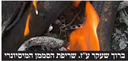
ברוך שעקר ע"י. שריפת הסממן המיסיונרי

צעיר שהתייתם מאביו בתאונה מצא עצמו בחברת שכן מיסיונר שהשפיע עליו לטבול לנצרות • במחלקה למאבק במיסיון של 'יד לאחים' הוא נטש את דרכו, ושרף את הסממן הנוצרי