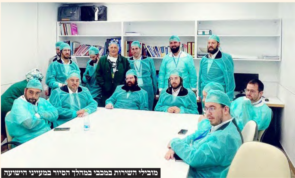
מובילי השירות במכבי במהלך הסיור במעייני הישועה

הנהלת מרחב בני ברק ואלעד עם צוות נרחב של מנהלים ומובילי שירות במכבי שירותי בריאות השתתפו בסיור מקצועי שנערך במרכז הרפואי 'מעייני הישועה' בבני ברק, לטובת העשרה מקצועית והידוק שיתוף הפעולה עם המרכז הרפואי