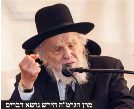
מרן הגרמ"ה הירש נושא דברים