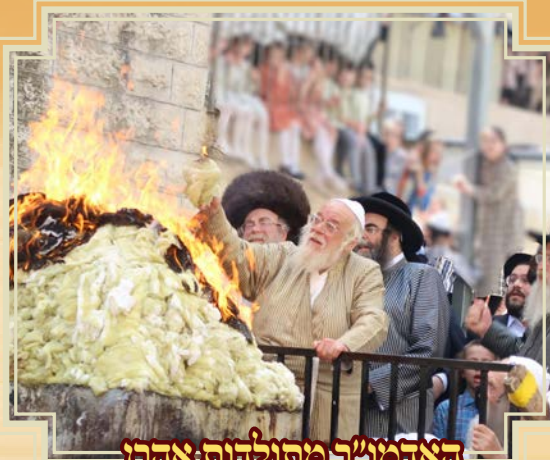
האדמו"ר מתולדות אהרן