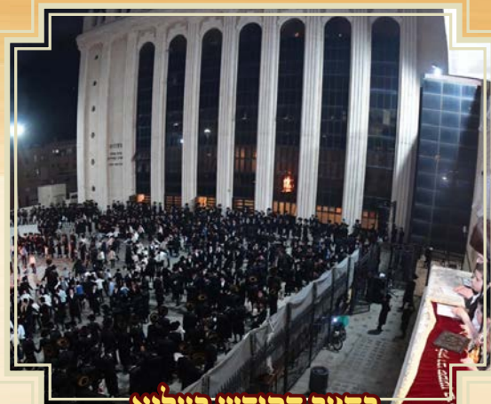
פתח תקוה בקולנוע