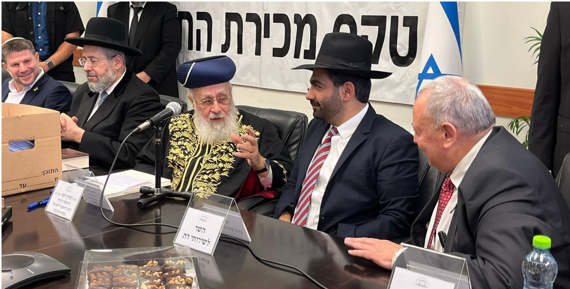
שחקני המפתח במינוי הרבנים הראשיים: הרבנים המכהנים והשרים מליאלי וסמוטריץ'

החוזרות ונשנות, וחרף סכנת החיים המובהקת (שהומחשה בתום ל"ג בעומר בשיגורים ישירים של חיובאללה לעבר מירון), העפילו כמה מאות ואולי מעט יותר לציון הרשב"י, שם התעמתו בחלקם עם שוטרים, הובילו לפציעתם של כמה מהם ובמקרים בודדים גם ספגו תגובה אלימה באופן קיצוני.