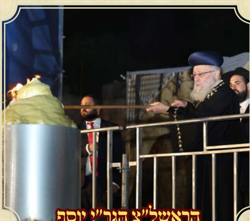
הראש"ל צ' הגר"י יוסף