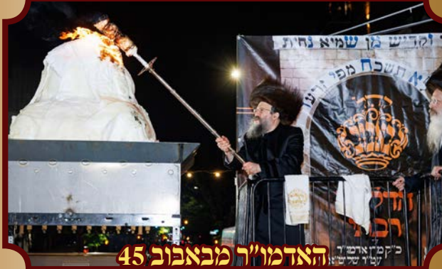
האדמו"ר מבאבוב 45