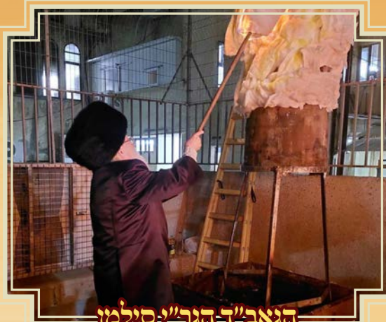
הגאב"ד הגר"י סילמן