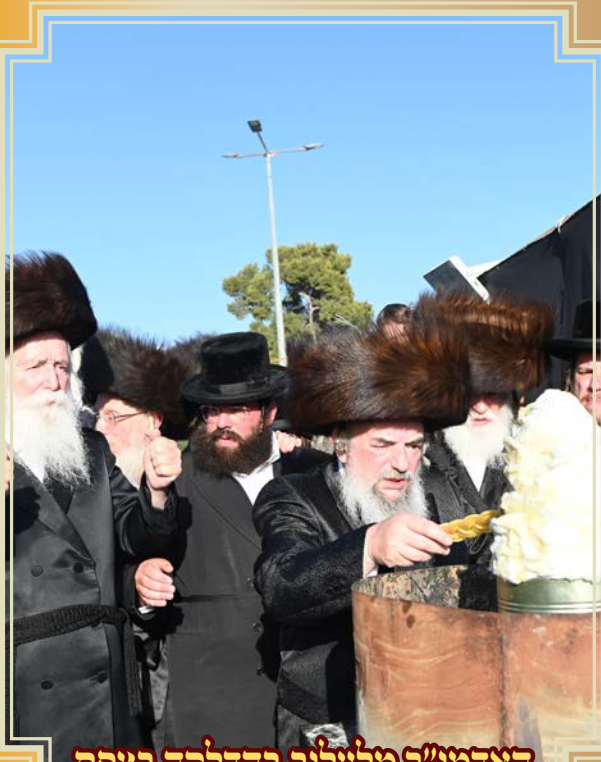
האדמו"ר מלעלוב בהדלקה בצפת