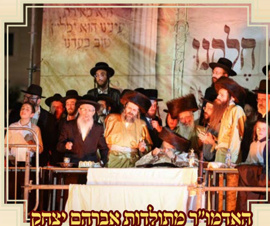
האדמו"ר מתולדות אפרהם יצחק