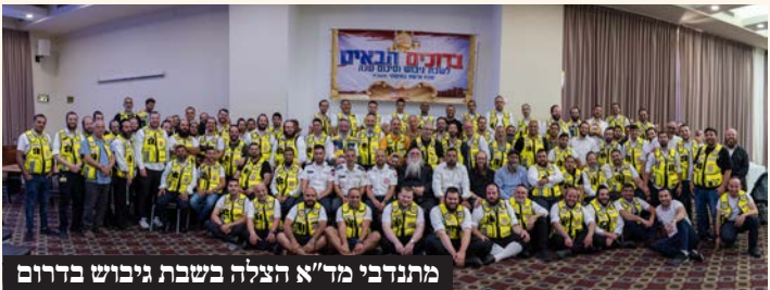
מתנדבי מד"א הצלה בשבת גיבוש בדרום

כונני מד"א - הצלה דרום שעושים לילות כימים למען הצלת חיי אדם, בפרט בעת המלחמה, התאחדו לשבת גיבוש והתחזקות בבאר שבע