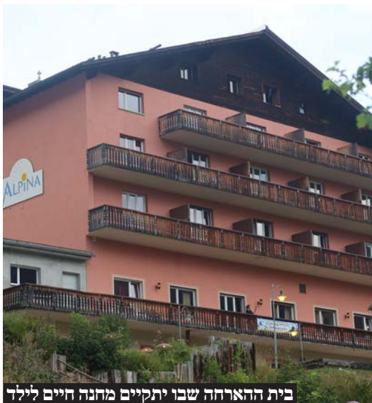
בית הארחה שבו יתקיים מחנה חיים לילד