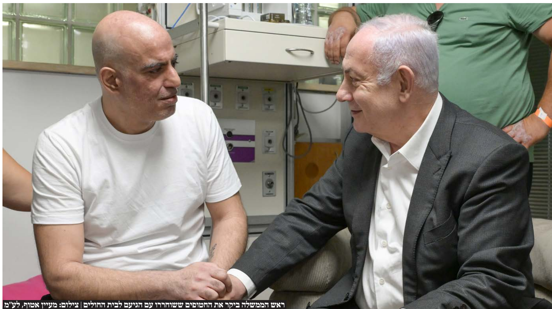
ראש הממשלה ביקר את החטופים ששוחררו עם הגיעם לבית החולים