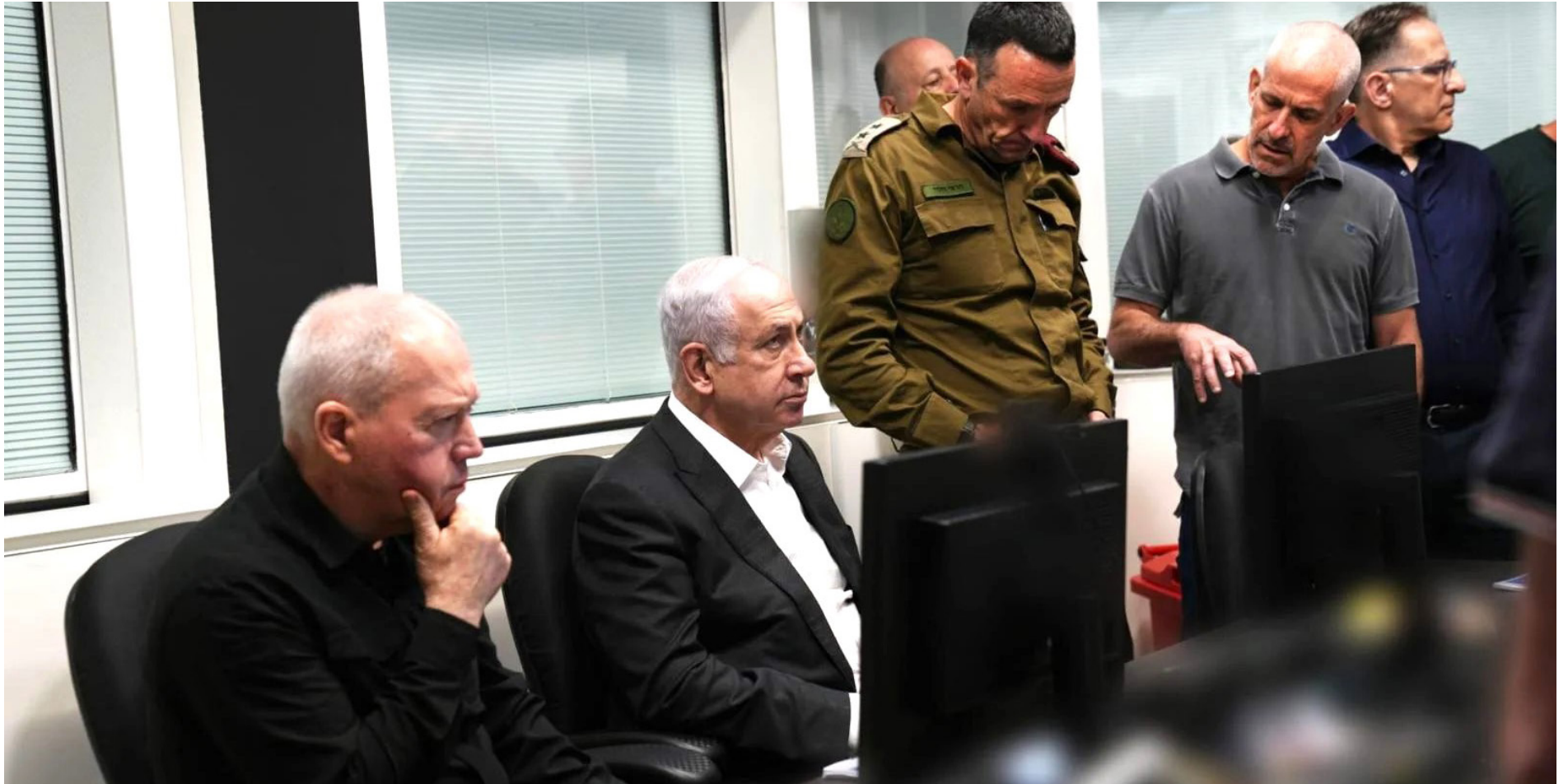
ראש הממשלה ושר הביטחון בחמ"ל הפיקוד, בלי גנץ ובלי איזנקוט

תקציבי מדינה בשנה הרגיעה את שר האוצר (שנאלץ כזכור להעביר תקציב דו שנתי ואז להעביר תקציב דו שנתי מתוקן בעקבות המלחמה, ועמד במשימה הכמעט בלתי אפשרית בגבורה), טעיתם. במרץ בלתי גדלה השיק השר בסוף השבוע את הדרך לתקציב המדינה לשנת 2025, תוך העברת מסר מרומז לכל מאן דבעי שאף אחד בממשלה לא הולך לשום מקום בתקופה הקרובה.