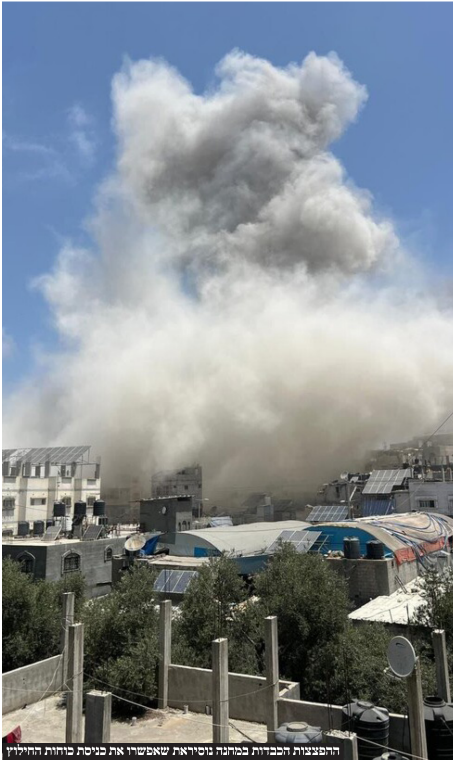
ההפצצות הכבדות במחנה נוסיראת שאפשרו את כניסת כוחות החילוץ

הבוקר - במקצועיות, בנחישות, תוך סיכון חייהם.