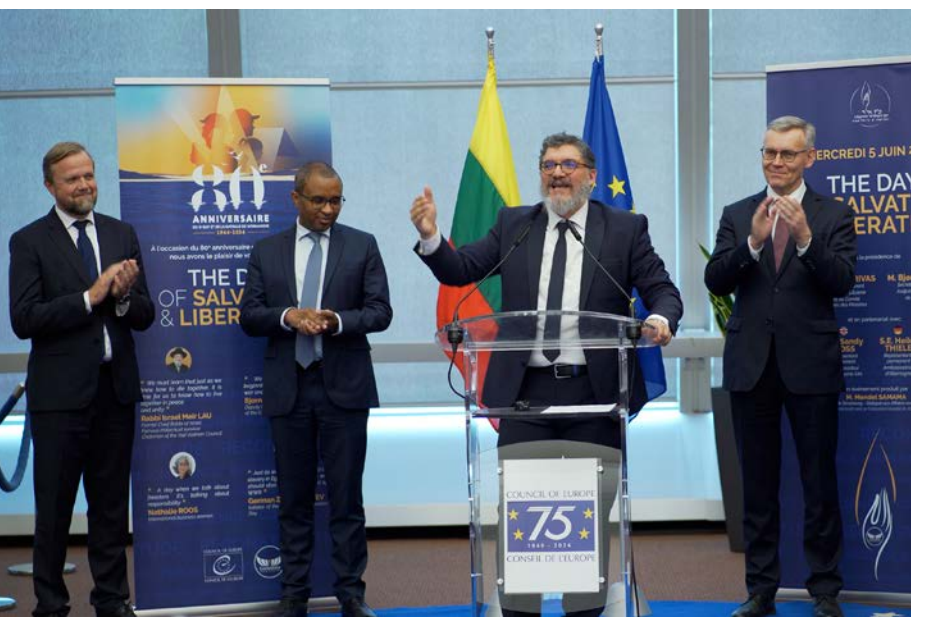
נציגי המדינות באירוע הצדעה לציון יום השחרור וההצלה