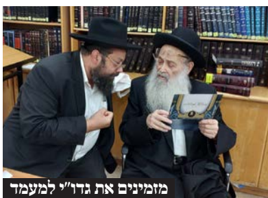
מזמינים את גדו"י למעמד

בשר משובח בכשרות המהודרת ביותר לבני התורה ובמחירים השווים לכל כיס, ומרן ראש הישיבה הוא שהדריך אותנו על כל צעד ושעל, וקבע את כללי הכשרות המחמירים ביותר בהם אנו ממשיכים לצעוד. ועל כן ראינו לזכות וחובה, ליוזם ולתרום את הכנסת ספר התורה המהודר והמיוחד הזה לעילוי נשמתו של מרן ראש הישיבה זצוק"ל". מהוועדה המכינה נמסר, כי יש לעקוב אחר הפרסומים בימים הקרובים בדבר סדרי המעמד המלאים והמפורטים.