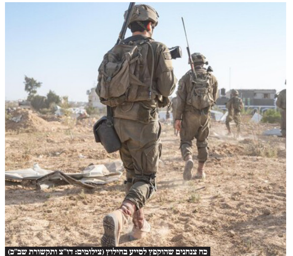
כח צנחנים שהוקפץ לסייע בחילוץ

מיד עם עליית הכוחות יחד עם החטופים למסוק חיל האוויר, וחציי המסוק לשטח ישראל, נשמעה אנחת רווחה במטה השב"כ שם התקיים חמ"ל המבצעים המרכזי בנוכחות אש הממשלה, שר הביטחון ובכירי מערכת הביטחון. מיד עם נחיתתם בישראל הועברו החטופים למרכז הרפואי שיבא למפגש מרגש