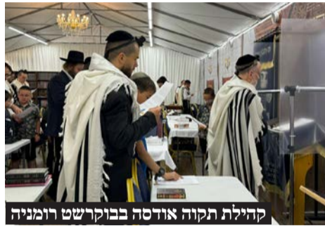
קהילת תקוה אודסה בבוקרשט רומניה