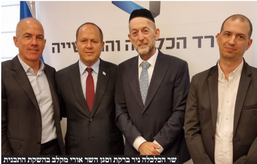
שר הכלכלה ניר ברקת וסגן השר אורי מקלב בהשקת התכנית

התכנית של הרשות החרדית במשרד ראש הממשלה והסוכנות לעסקים במשרד הכלכלה והתעשייה, בהיקף של 2 מיליון ש"ח במימון הרשות החרדית, פונה לעסקים בחברה החרדית ומסייעת להם בכלים מקצועיים לצמיחת העסק