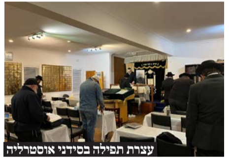
עצרת תפילה בסידני אוסטרליה