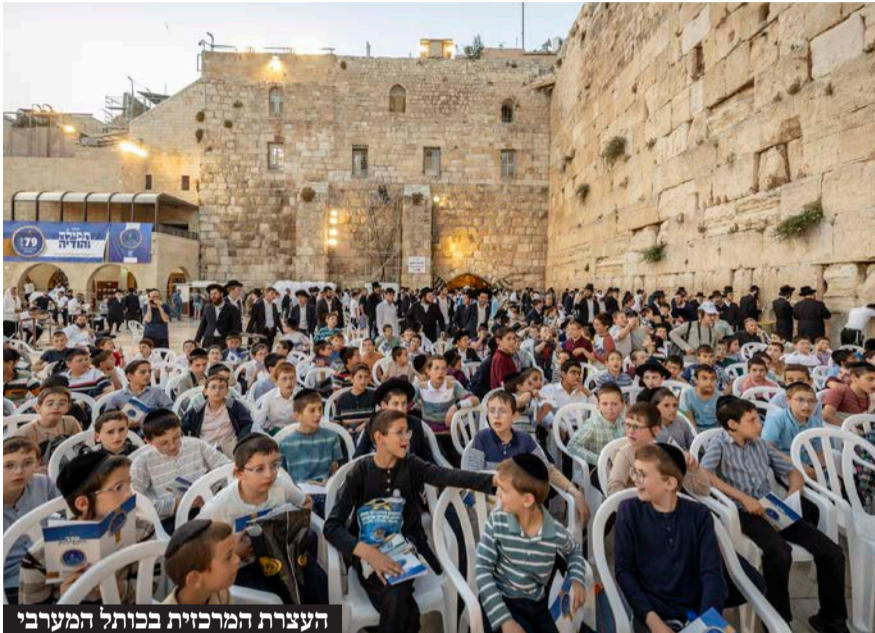
העצרת המרכזית בכותל המערבי

בארגוני ובשבידה, בסין ובתוניסיה, צרפת וגרמניה, אוסטריה פולין ורוסיה, הונגריה ארה"ב בלארוס מולדובה ואוסטרליה התקיימו עצרות תפילה והודיה במעמד הרבנים הראשיים נציגי בעלות הברית וניצולים • מאות פליטים מאוקראינה בעצרת מרגשת בבוקרשט • ילדי המפעל הגדול בעולם ללימוד משניות ריגשו את בני המשפחות בקריאת מזמורי תהילים וקטעי שירה לשחרור החטופים ולרפואת הפצועים בעצרת המרכזית בכותל המערבי • הנשיא הרצוג וראש הממשלה נתניהו שיגרו דברי ברכה מיוחדים: "המעמד החשוב שאתם מקיימים ממלא אותי לא רק בגאווה אלא גם בתקווה"