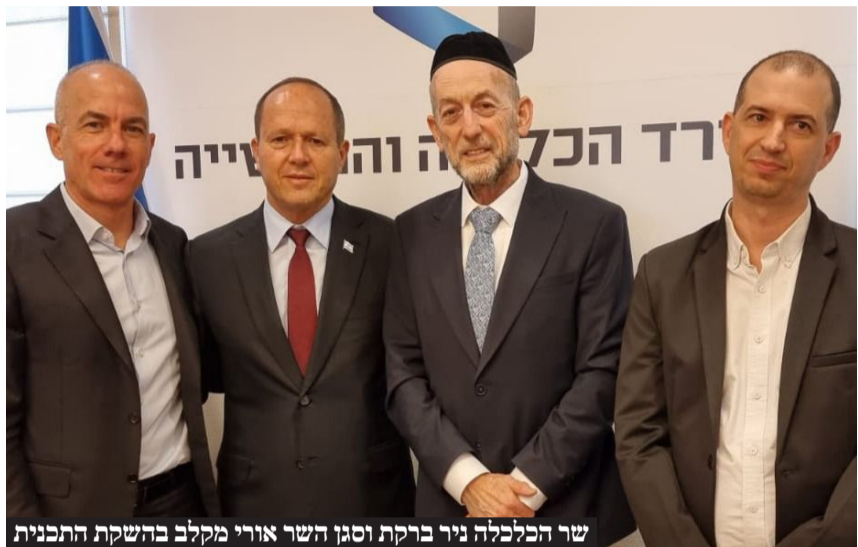
שר הכלכלה ניר ברקת וסגן השר אורי מקלב בהשקת התוכנית

התכנית של הרשות החרדית במשרד ראש הממשלה והסוכנות לעסקים במשרד הכלכלה והתעשייה, בהיקף של 2 מיליון ש"ח במימון הרשות החרדית, פונה לעסקים בחברה החרדית ומסייעת להם בכלים מקצועיים לצמיחת העסק