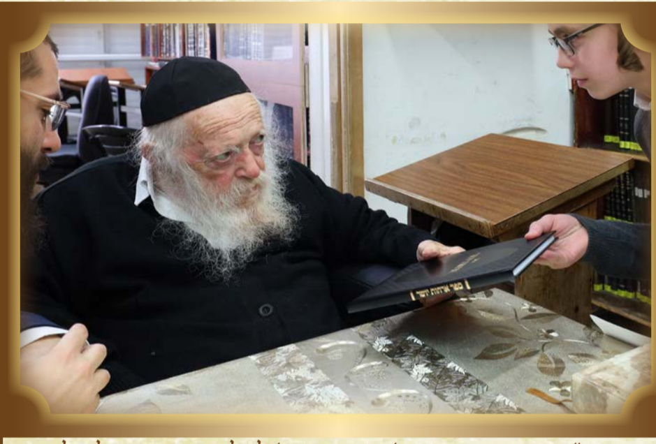
מרן זיע"א מעניק את ספרו 'ארחות יושר' לתלמיד שנבחן על תלמודו

י"ב אייר הרב שמעון חבין בני ברק בדרכו 8 דף * 100 ב' י"ב בני ברק משניות * ספר ב' י"ב אייר הבה"ח יהודה סיטון בני ברק י"ג אייר התלמיד שלמה זונבנד בדרכו 8 דף * ספר ג' י"ג אייר הרב ח. עמאר ביתר בדרכו 8 דף * ספר ג' י"ג אייר הרב משה קליין מו"ע בדרכו 8 דף * 100 ג' י"ג אייר הגב / התלמידה תמר בדרכו 8 דף * ספר ג' י"ג אייר הרב בנימין וינר בני ברק ירושלמי י"ג אייר הרב משה טאוסקי חיפה שיח ההלכה * ספר ג' י"ג הבה"ח שמואל קטריס בדרכו 8 דף * ספר ג' י"ג אייר התלמיד ברק בתורתו * ספר ג' י"ג אייר התלמיד שלמה קרישר אלעד * ספר ד' י"ד אייר הרב מרדכי קנר בני ברק ירושלמי * ספר ד' י"ד אייר הרב נחמן זיגלמן אשדוד שיח ההלכה * ספר ד' י"ד הבה"ח שמואל בן-דוב בני ברק בדרכו 8 דף * 500 ד' י"ד אייר התלמידה אילה גרינברג אלעד כהנהגתו * ספר ד' י"ד אייר התלמיד צבי ברנדווין משניות * ספר ד' י"ד אייר הרב משה בני ברק ירושלמי * ספר ד' י"ד אייר הרב יוסף בן צבי בני ברק