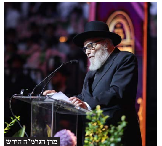
מרן הגרמ"ה הירש

מתאוה שכלל ישראל יהיו עמלים בתורה, ואז 'תנו עוזו לאלקים', עצם העמלות נותן כביכול כח ועוז לאלקים". בסיום הדברים אמר מרן שליט"א: "אדירי התורה הלומדים פה בלייקוד, נותנים עוז לאלקים ומרבים כבוד ומלכות שמים, ואם ירצה השם בסיעתא דשמיא זה יביא את הגאולה השלימה בב"א". מרן שליט"א הוסיף: "אני חייב להגיד אגב אורחא, אנשים תמיד מספרים לי בהתפעלות גדולה מאוד מאוד איך שראו דבר שלא ראו בחייהם, אברכים לומדים בהתמדה גדולה שישה ימים בשבוע ובארץ ישראל מתפעלים ממה שקורה פה בלייקוד". אחר משאו של מרן שליט"א, התקיים מעמד סיום הש"ס בבלי ירושלמי לע"נ המשגיח דלייקוד הגה"צ רבי מתתיהו סלומון שליט"א, במעמד התכבד הגאון הגדול רבי ישראל ניומן שליט"א מראשי הישיבה. במהלך המעמד נשא דברים נלהבים הגאון המפורסם רבי אפרים וקסמן שליט"א מגדולי הדרשנים בארה"ב אשר חיזק את המשתתפים בדברים חוצבי לב. במעמד הגדול נטלו חלק כל גדולי התורה שליט"א של יהדות ארה"ב, אשר ללא ספק יותיר רושם עז על התורה דאמריקה ולומדיה.