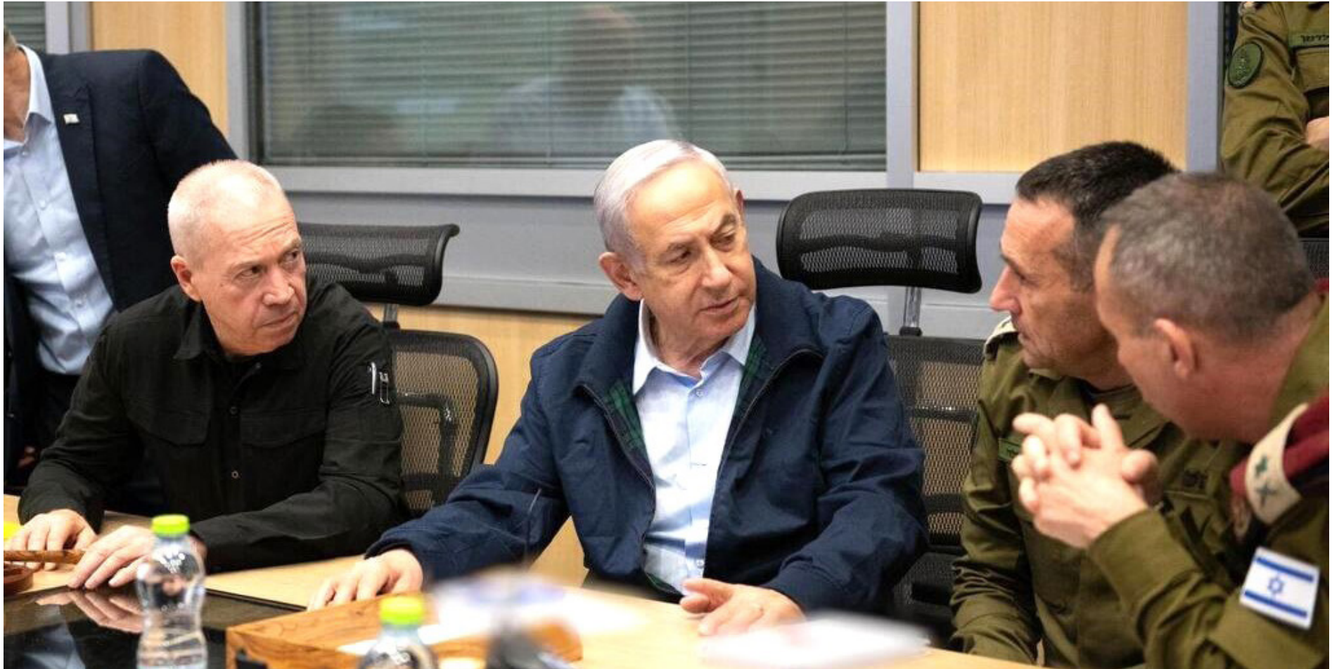
דין אחרון בקבינט מיותר? קבינט המלחמה לפני התפרקותו