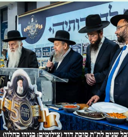
מראות מהמעמד לציון יובל שנים לת"ת סוכת דוד