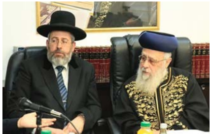
לא ישתתפו באספה הבוחרת. הרבנים הראשיים לישראל

וכן, לא ניתן יהיה להיוועץ בהם במינוי נציגי ציבור. ע"פ החלטת המשנים ליועמ"שית, מי שימלאו את מקומם בגוף הבוחר, הם "הקשיש בחברי מועצת הרבנות הראשית והוותיק שבדייני בית הדין הרבני הגדול". כמו כן השניים הם אלו שיבחרו את נציגי הרבנים בגוף הבוחר. יצוין כי השניים שימלאו את תפקיד הרבנים הראשיים בבחירות לרבנות לא ימונו בפועל למלאי מקום הרבנים הראשיים, כך שלאשונה בהיסטוריה לא יכהנו רבנים ראשיים בתקופת המעבר עד לבחירת רבנים חדשים. במשרד המשפטים הוסיפו כי הרבנים שימלאו את מקומם של הרבנים הראשיים ישקלו לבחור גם נשים על תקן 'רבניות' לגוף הבוחר את הרבנים הראשיים. אלא שבהחלטת מועצת הרבנות הוחלט שלא ימונו נשים על תקן 'רבניות', כך שהפלוונטר סביב מינוי 'רבניות' לגוף הבוחר טרם הוכרע.