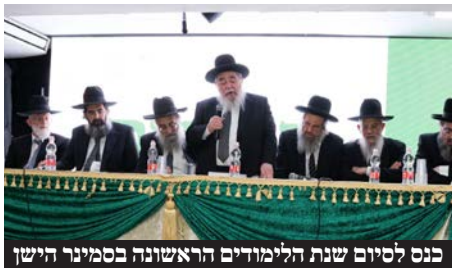
כנס לסיום שנת הלימודים הראשונה בסמינר הישן

שלוחת הסמינר הישן בירושלים שהוקמה בשנה שעברה סיכמו שנה בכנס מיוחד שאותו פיארו גדולי התורה וראשי הישיבות • מנהלות בתי יעקב האזוריים לא הסתירו את התפעלותן מהבנות האיכותיות וממשפחותיהן • לקראת שנה "ל הבאה יש לחץ גדול מהציבור לפתוח שתי כיתות מקבילות • החזון שהפך לבשורה היסטורית