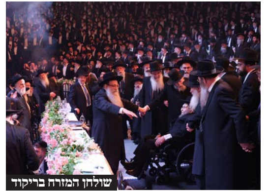
שולחן המזרח בריקוד