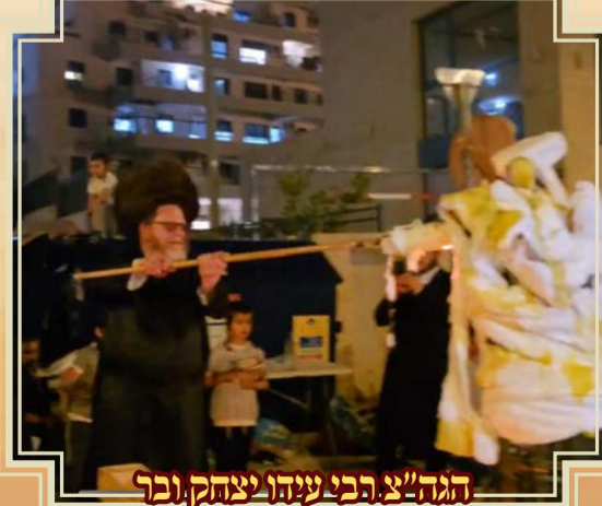
הגה"צ רבי עשהו יצחק ובר