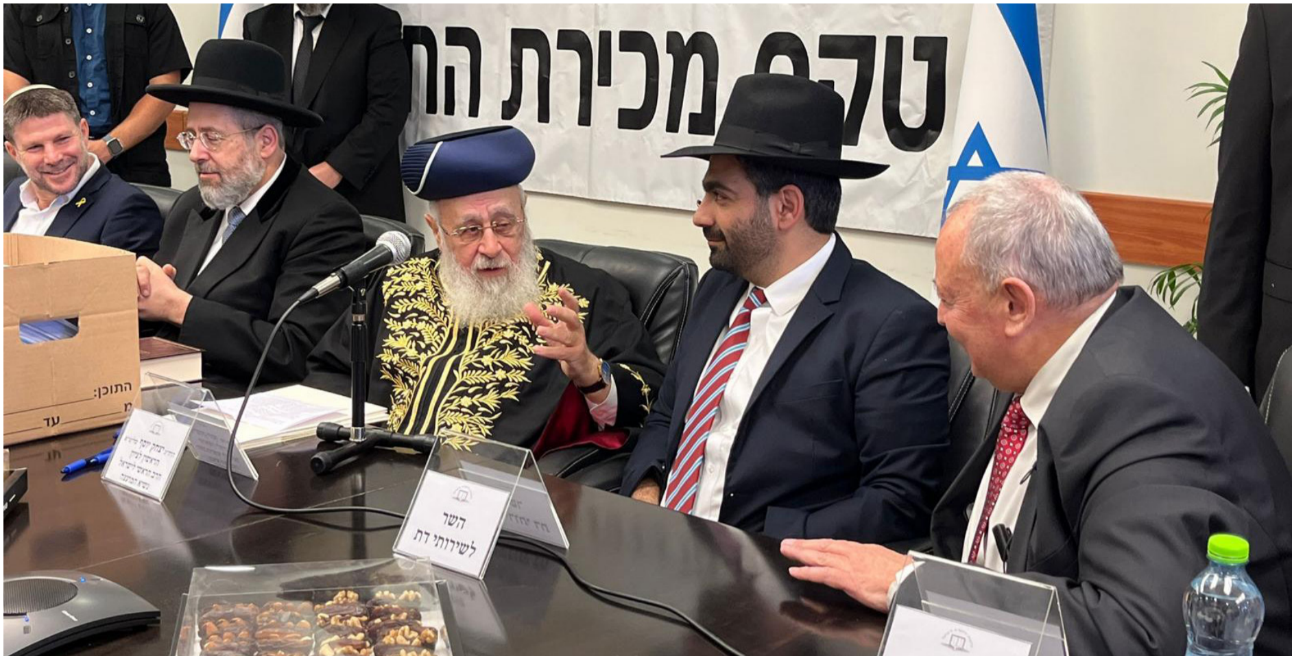
שחקני המפתח במינוי הרבנים הראשיים: הרבנים המכהנים והשרים מליכיאלי וסמוטריץ'

החוזרות ונשנות, וחרף סכנת החיים המובהקת (שהומחשה בתום ל"ג בעומר בשיגורים ישירים של חיזבאללה לעבר מירון), העפילו כמה מאות ואולי מעט יותר לציון הרשב"י, שם התעמתו בחלקם עם שוטרים, הובילו לפציעתם של כמה מהם ובמקרים בודדים גם ספגו תגובה אלימה באופן קיצוני.