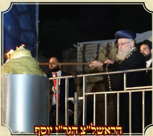
הראש"ל צ' הגר"י יוסף