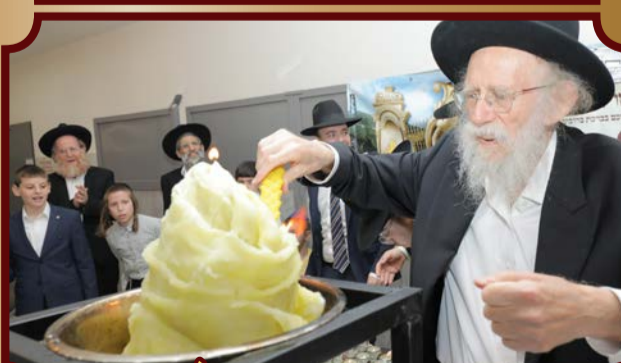
הגה"צ הב"ש שמעון גלאי