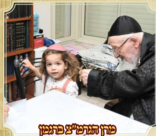
מחן הגרמ"צ בתל אביב