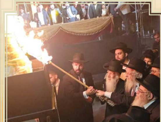
הגר"א סאליב, הגר"י כהן והגר"ש זעפרני