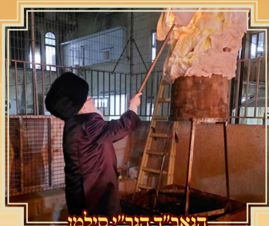
הגאב"ד הגר"י סילמן