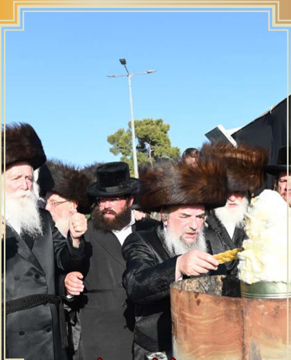
האדמו"ר מלעלוב בהדלקה בצפת