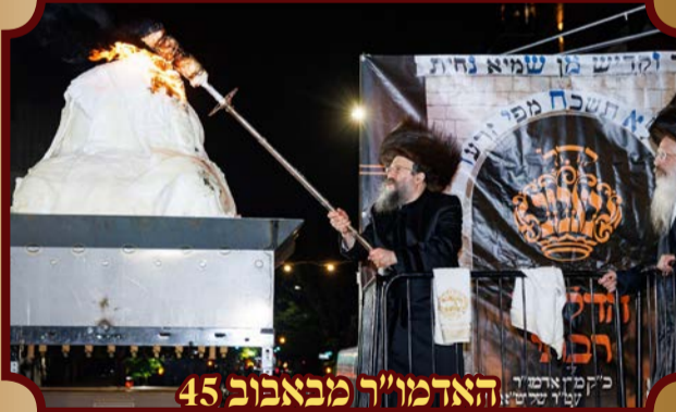
האדמו"ר מבאבוב 45